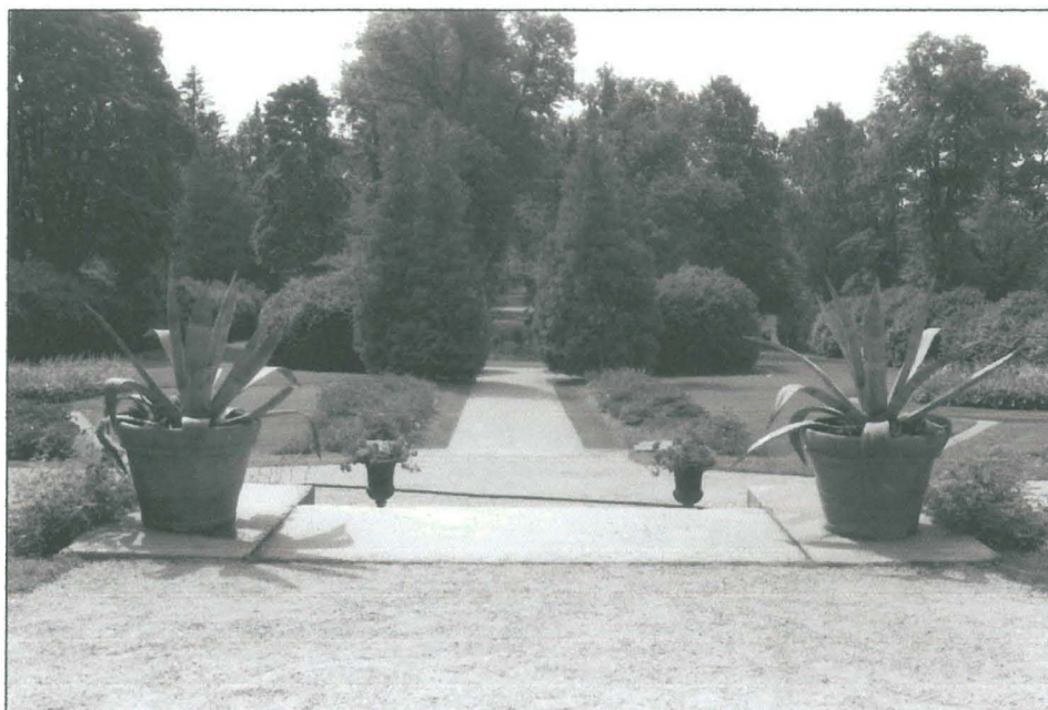
Utsikt från gårdens sydterass i riktning mot det södra lusthuset (2006)

har rätt få besökare. Parken besöks av enstaka barnfamiljer och solbadare under varma dagar och är mycket fridfull åtminstone dagtid. Grävningssområdet fick stå orört under hela utgrävningens gång trots stor synlighet i media sommaren 2006 och 2007.