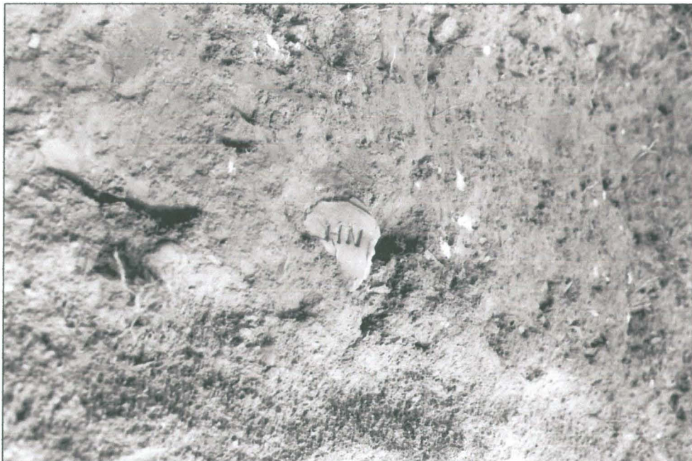
Fragment av taktegel med stämpel HN i profilen till utgrävningsområdet (2007). Hertonäs gårds museums samlingar.

Utgrävningsfynden bestod huvudsakligen av tegel- och kakelfragment. Tegelbitarna togs inte tillvara. Bland kakelbitarna dominerar fragment av krökta kakel.