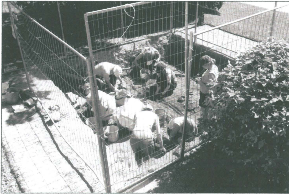
Utgrävningarna igång innanför inhägnaden, lager 4 utgrävs (2006)

Eftersom utfyllnadslagret också innehöll intressanta fynd framskred arbetet långsamt. Ett beslut att fortsätta utgrävningsarbetet år 2007 fattades under den andra utgrävningsveckan i samråd med Museiverket och finansören Svenska Odlingens Vänner i Helsinge r.f. Utgrävningsarbetet avslutades tidsenligt i nivå 5 den 14.7.2006 då ca hälften av utgrävningsområdet grävts fram till bottensanden. Utgrävningnivån täcktes med presenning i väntan på igenfyllningen som exemplariskt nog påbörjades redan nästa dag.