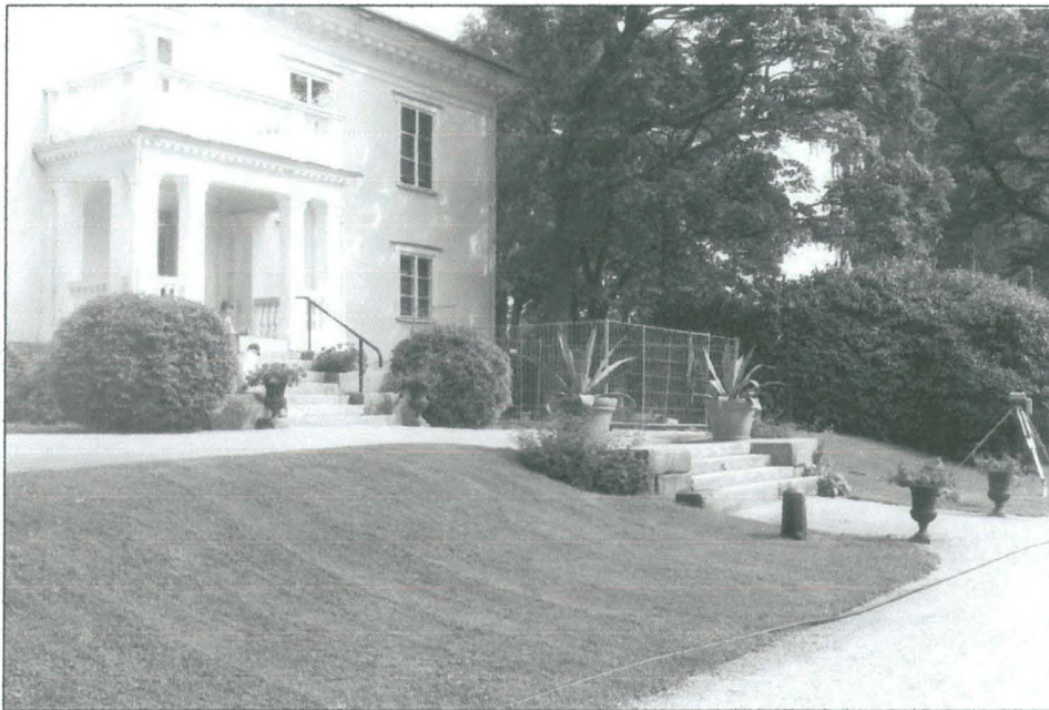
Det inhägnade utgrävningsområdet på gårdens sydsida fotograferat från sydväst (2006).

Utgrävningssplatsen är belägen alldeles intill Hertonäs gårds huvudbyggnad, intill fasaden mot den vackra rokokoparken (se översiktskarta s. 8).