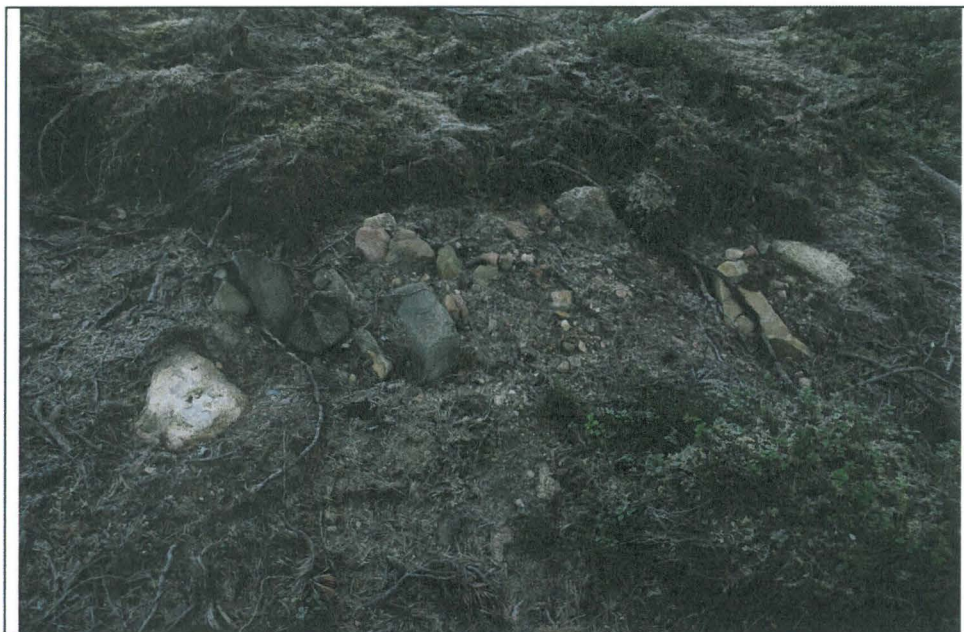
Kuva 7. Terassin reunan alta paljastunutta, käsiteltyä sekakiviainesta palaneessa sorassa. Esiintymä antoi vaikutelman "kivisepän pajasta". Kuvaussuunta SW – NE. Luntanginkangas 1.