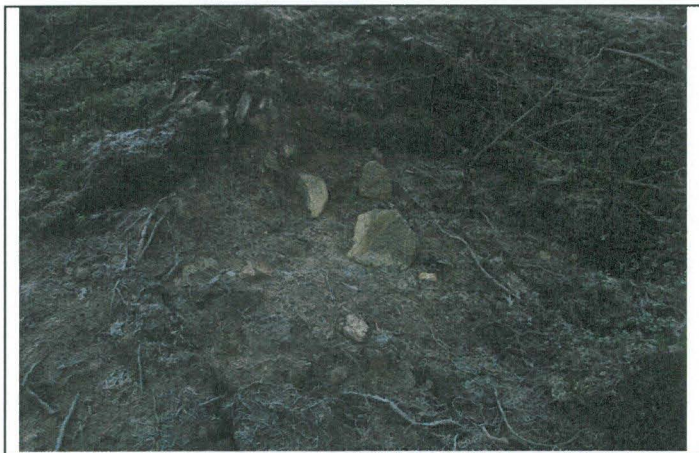
Kuva 6. Iskemällä käsiteltyjä, lievästi palaneita kiviä eri mineraaleista, ilmeisesti hajonneesta tulisijasta, joka on metsäkoneen paljastama. Ympäröivä hiekka on punaisenruskeaksi palanutta. Luntanginkangas 1 (S – N).