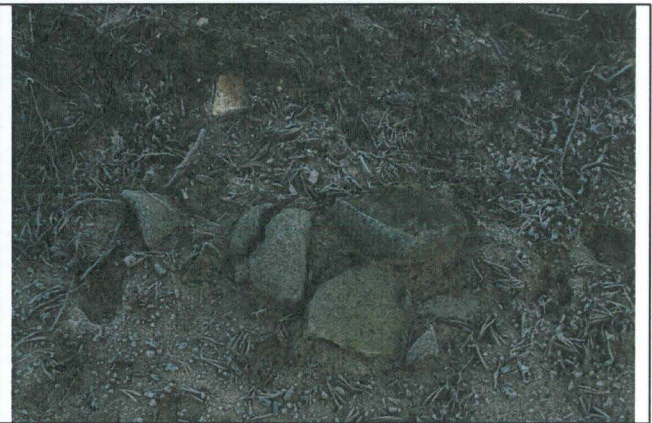
Kuva 5. Sama tulisija lähempää, kuvaussuunta S – N.