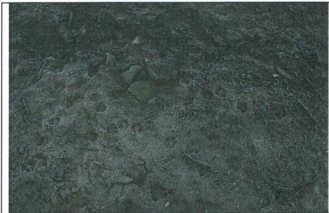
Kuva 4. Luntanginkangas 1, raportissa mainittu tulisijan pohja alueella A. Osa vaaleista pisteistä on luulöytöjä.