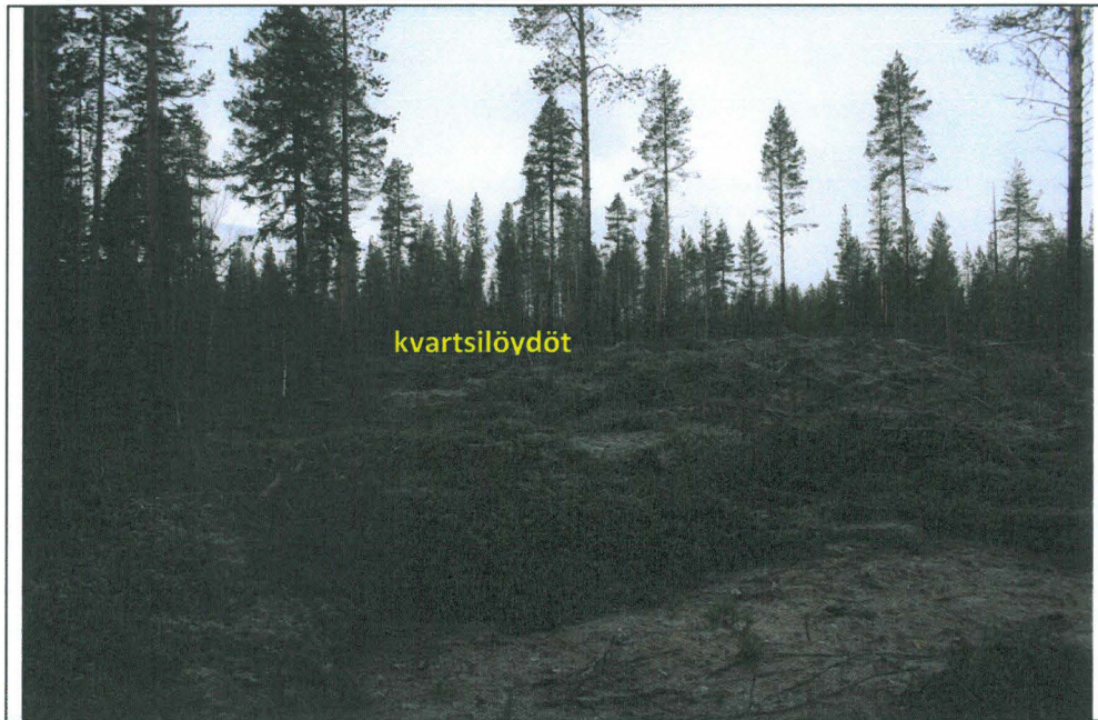
Kuva 3. Näkymä kaakosta kohti Luntanginkangas 2:n löytöaluetta.