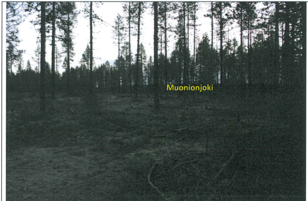
Kuva 2. Luntanginkangas 2, kuvaussuunta pohjoisluoteesta eteläkaakkoon. Horisontissa näkyvä metsä on Ruotsin Pajalan Koskenkangasta, terassi pudottaa kohti Muonionjokea.