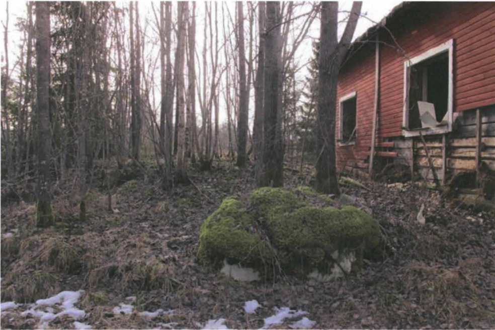
Kuva 3. Autoituneen talon takana oleva kivijalaksi tulkittu kumpare. Pohjoisesta.