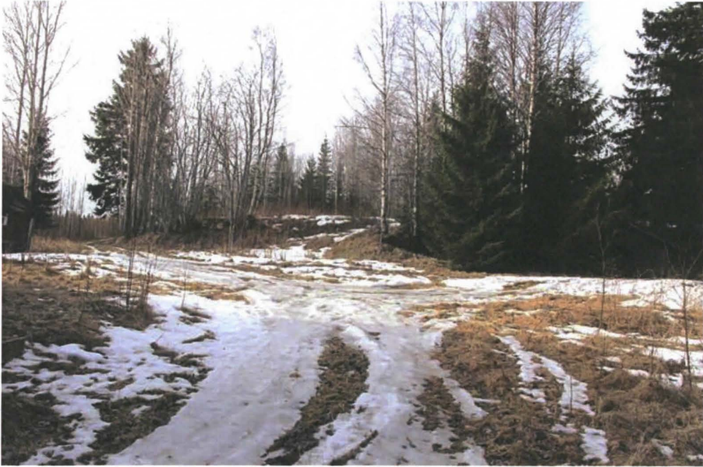
Kuva 5. Kummun asuinpaikka idästä, aution talon pihalta kuvattuna. Kellarin katto pilkottaa oikealla.