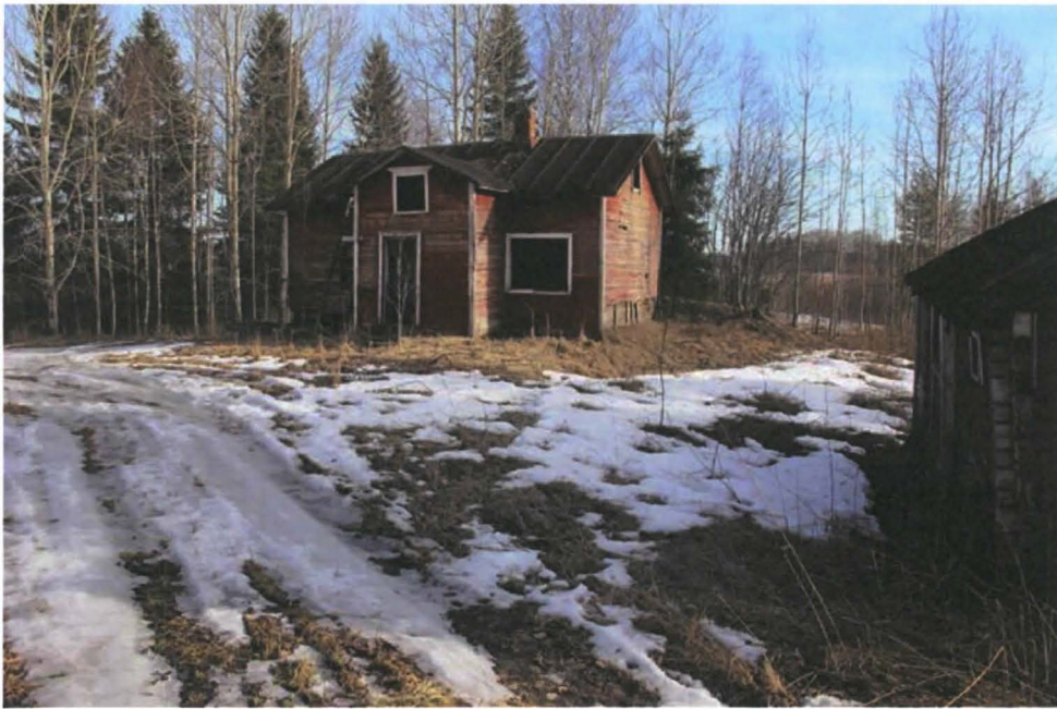
Kuva 1. Kummun rakennusryhmä jonne uutta taloa suunnitellaan. Lounaasta. Takana Rantasenjärvi

Kuvat 1.-6. Kaikki kuvat kuvannut Leena Lehtinen 11.3.2014