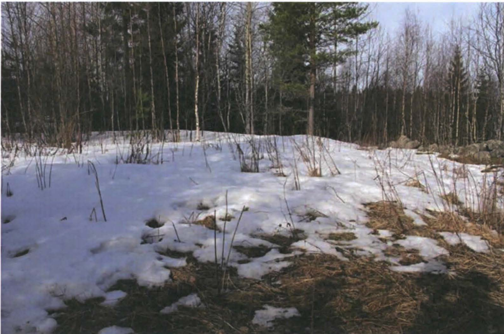
Kuva 6. Kummun asuinpaikan lakea idästä kuvattuna. Takaoikealla kiviäitaa.