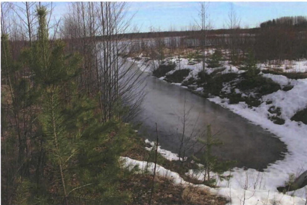
Kuva 2. Näkymä Kummun talon pihapiirin kaakkoispuolelta. Luoteesta. Uusi järveen menevä vesiväylä