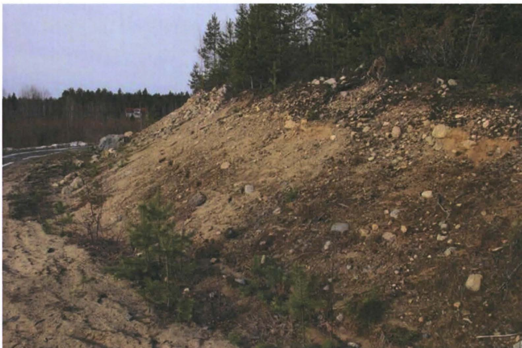
Kuva 4. Kummun asuinpaikan lounaisrinnettä tienleikkauksen kohdalla. Kaakosta.