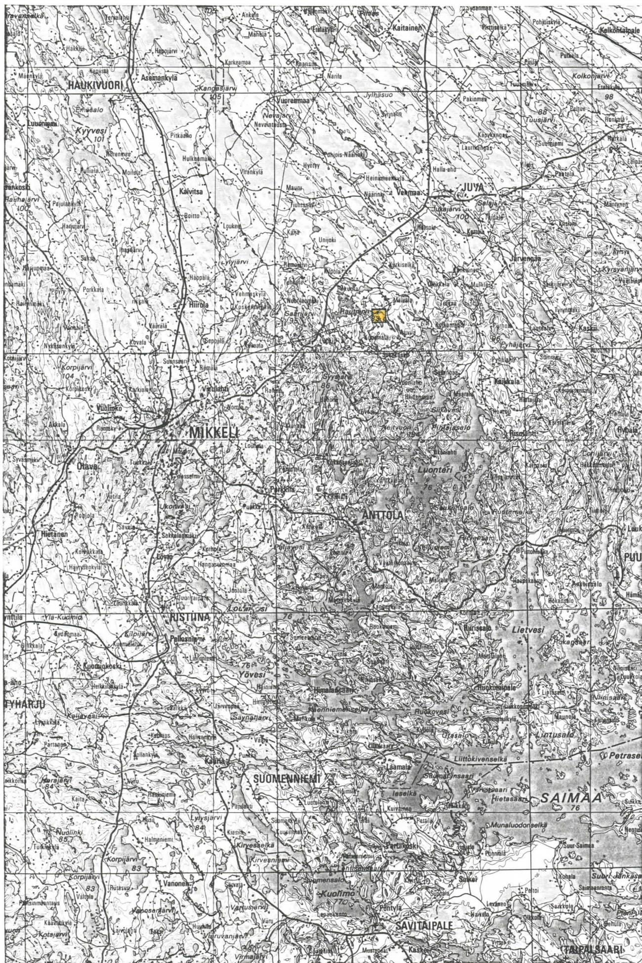
JUVA MURTONEN, HAAPARANTA 1-5, KOHTEIDEN SIJAINTI TIEKARTALLA, 1:400000