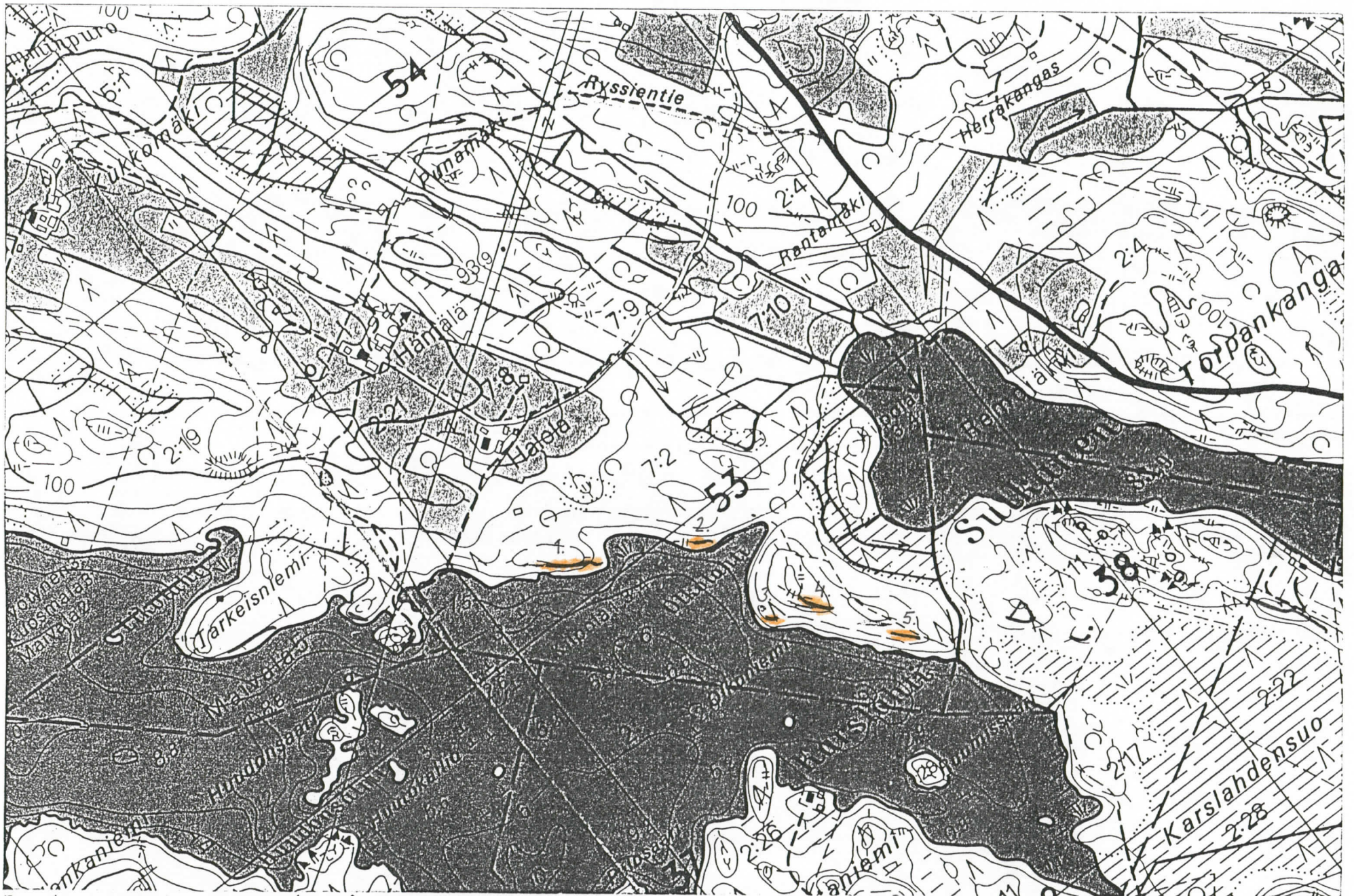
PK N:0 3142 12 MAIVALA (1987) MK 1:10 000 JUVA MURTONEN, HAAPARANTA 1-5, KOHTEIDEN SIJAINTI KENTTÄVARUSTUS