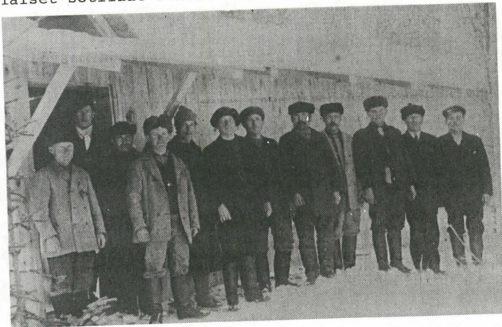
Venäjän valtion sotilastöissä olleita parakkityöläisiä Juvan Kauramäessä v. 1917. Kuva on otettu 30. päivänä maaliskuuta parakin seinustalla.

Sitten alkoivat patterityöt, johon otettiin miehiä töihin omalta kylältä sekä kauempaa, niin että miehiä oli satoja töissä, venäläiset sotilaat olivat vain valvojina.