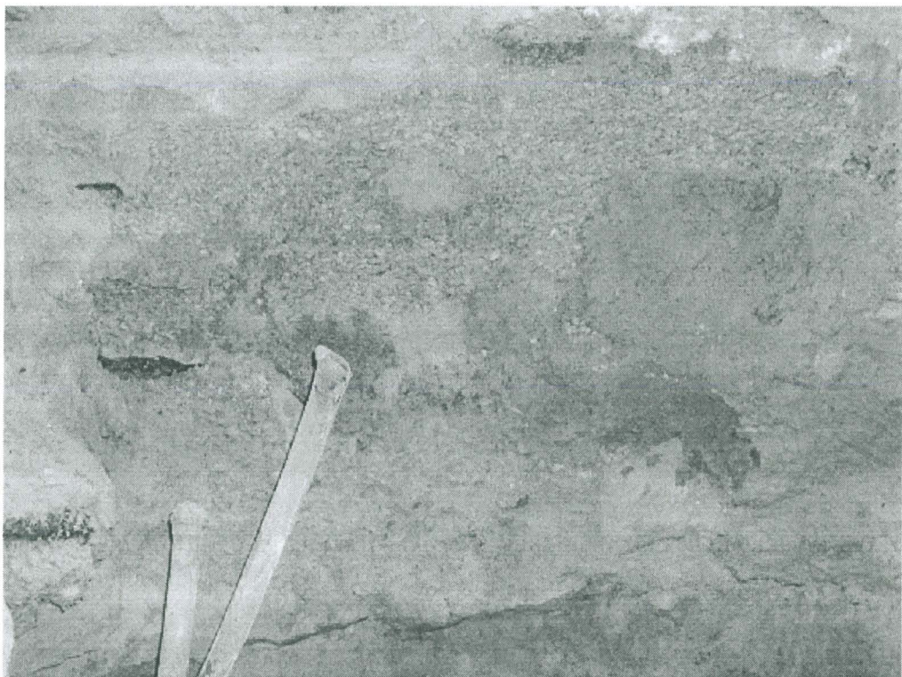
Kuva 4. Koekuoppa 3.