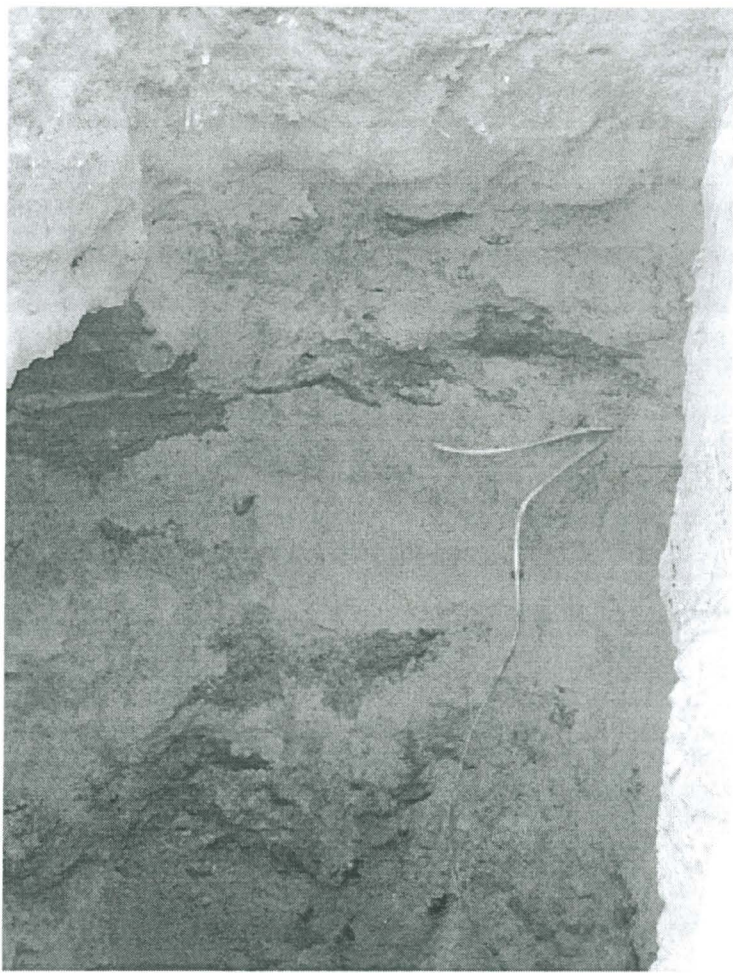
Kuva 5. Koekuoppa 4.