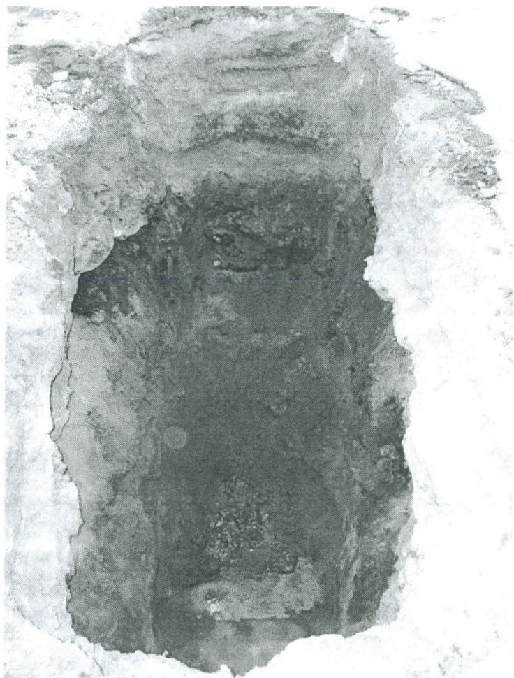
Kuva 6. Koekuoppa 5.