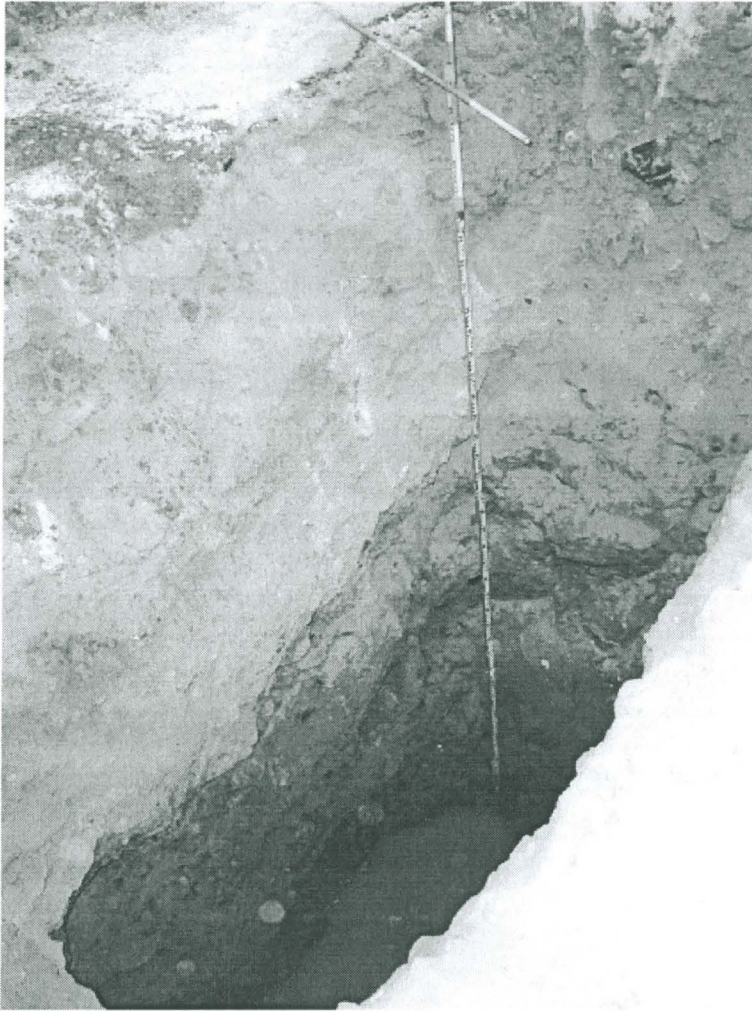
Kuva 1. Koekuoppa 1:n koillis- ja kaakkoisseinämien profiilit.