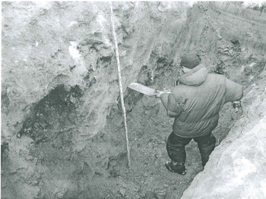
Kuva 2. Koekuoppa 2:n luoteisprofiili.