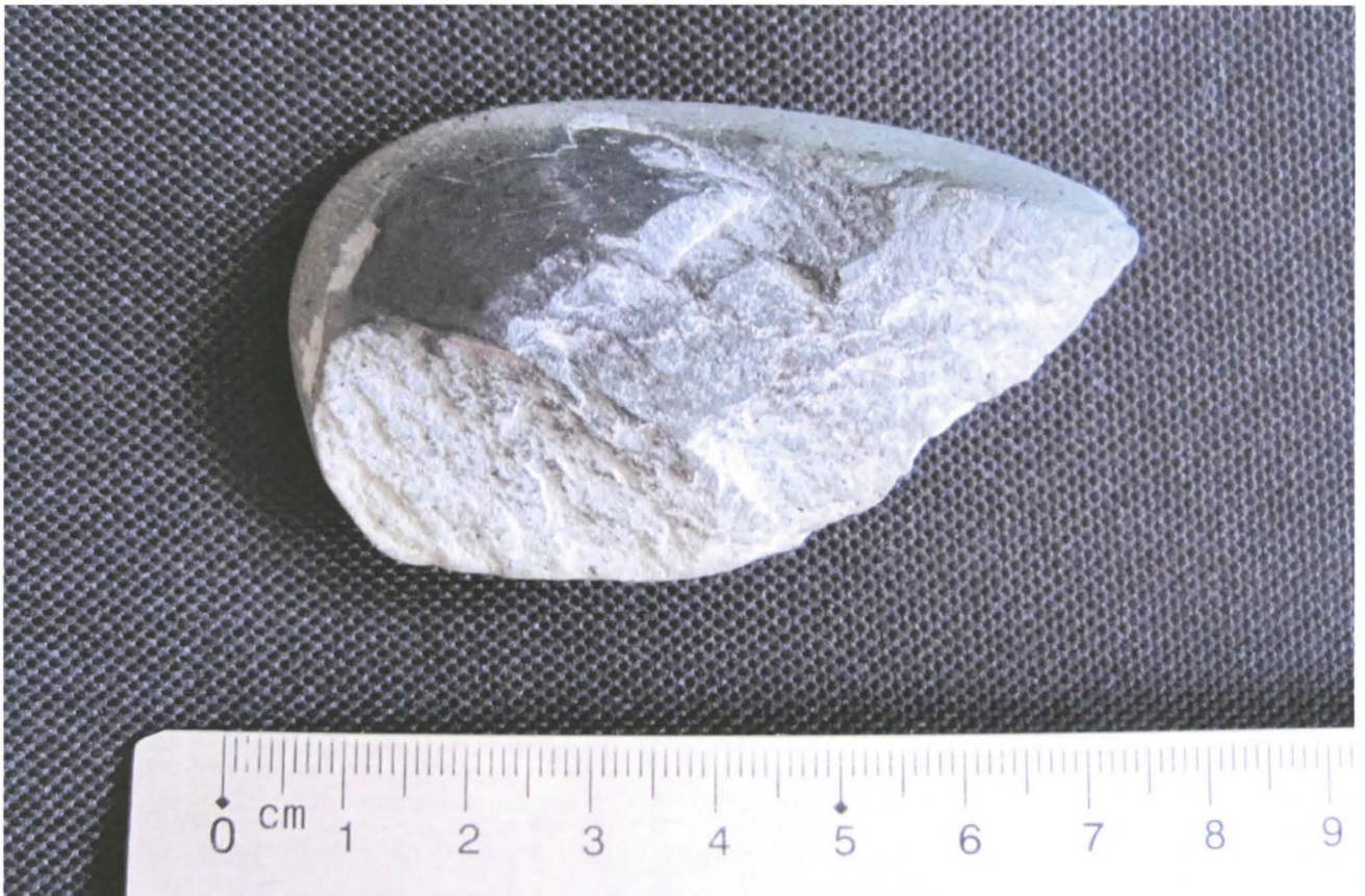
Kuva 2. Löytökuvaa. Tasataltan teräkatkelma KM 39674.