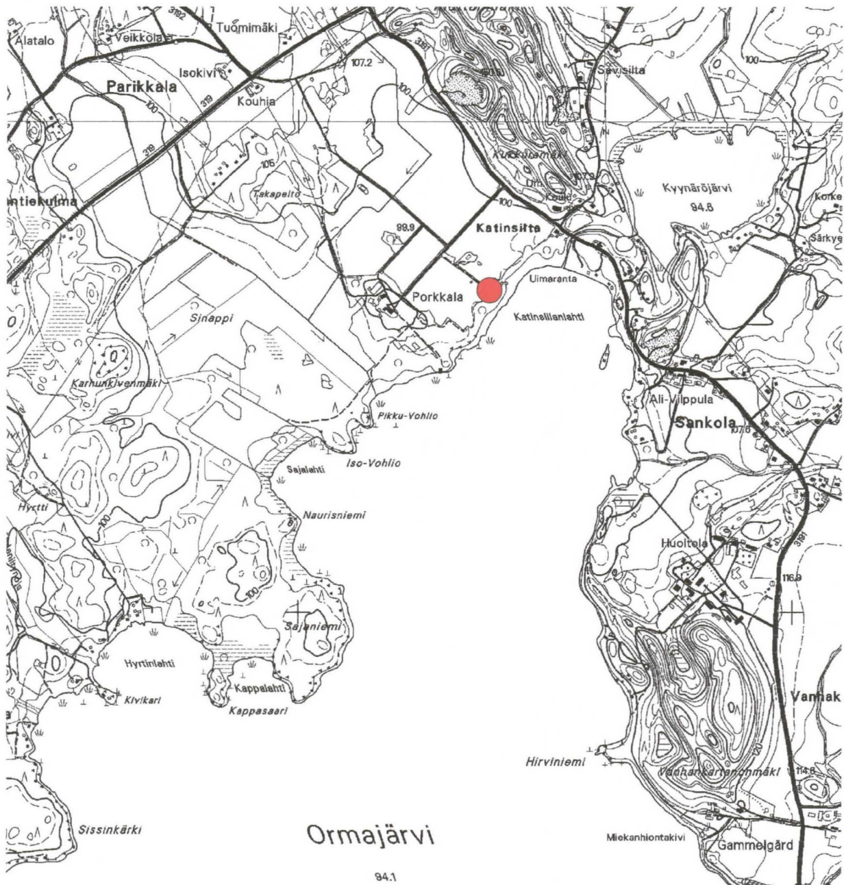
Lammi Porkkalan kartanon vanha tonttimaa MK 1:20 000