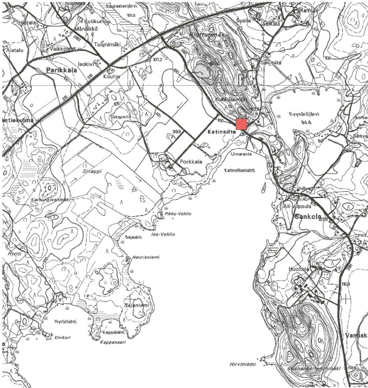
Lammi Porkkalan Krouvi K 1:20 000