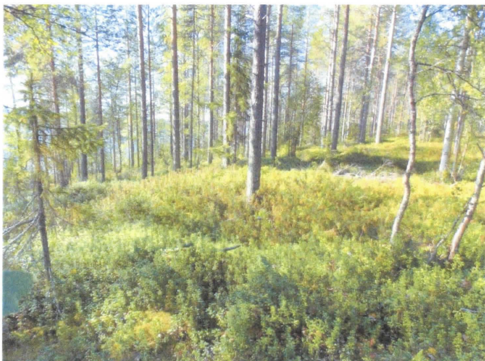
Kuusamo Pitkäsaaren itäisempi maakuoppa idästä Kuva: M. Sarkkinen (PPM DG VH 8:2013:06:01)