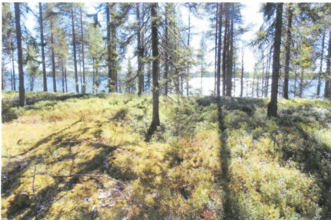
Ulkusaaren kuoppa 1 pohjoisesta. (PPM DG VH 8:2013:06:01)