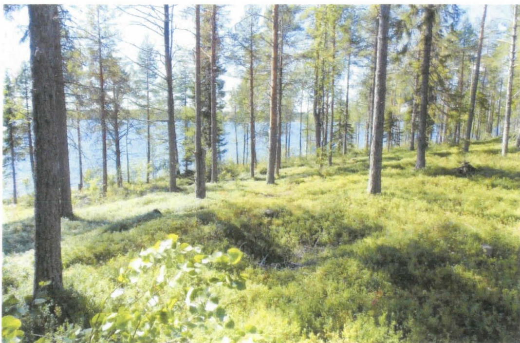
Ulkusaaren kuoppa 2 koillisesta.