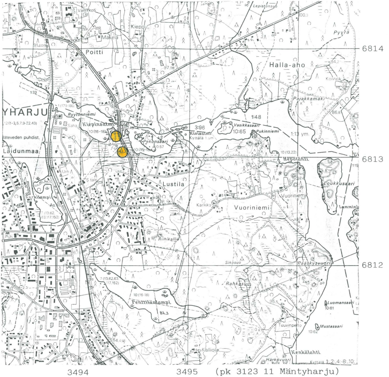
Mäntyharju I maailmansodan aikaisia puolustusvarustuksia Kiepinsalmi