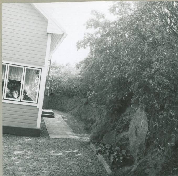
KUVA 17 NEG.2HO 32662