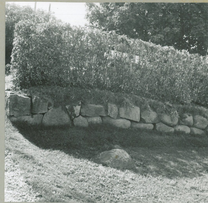
KUVA 18 NEG.2HO 32660