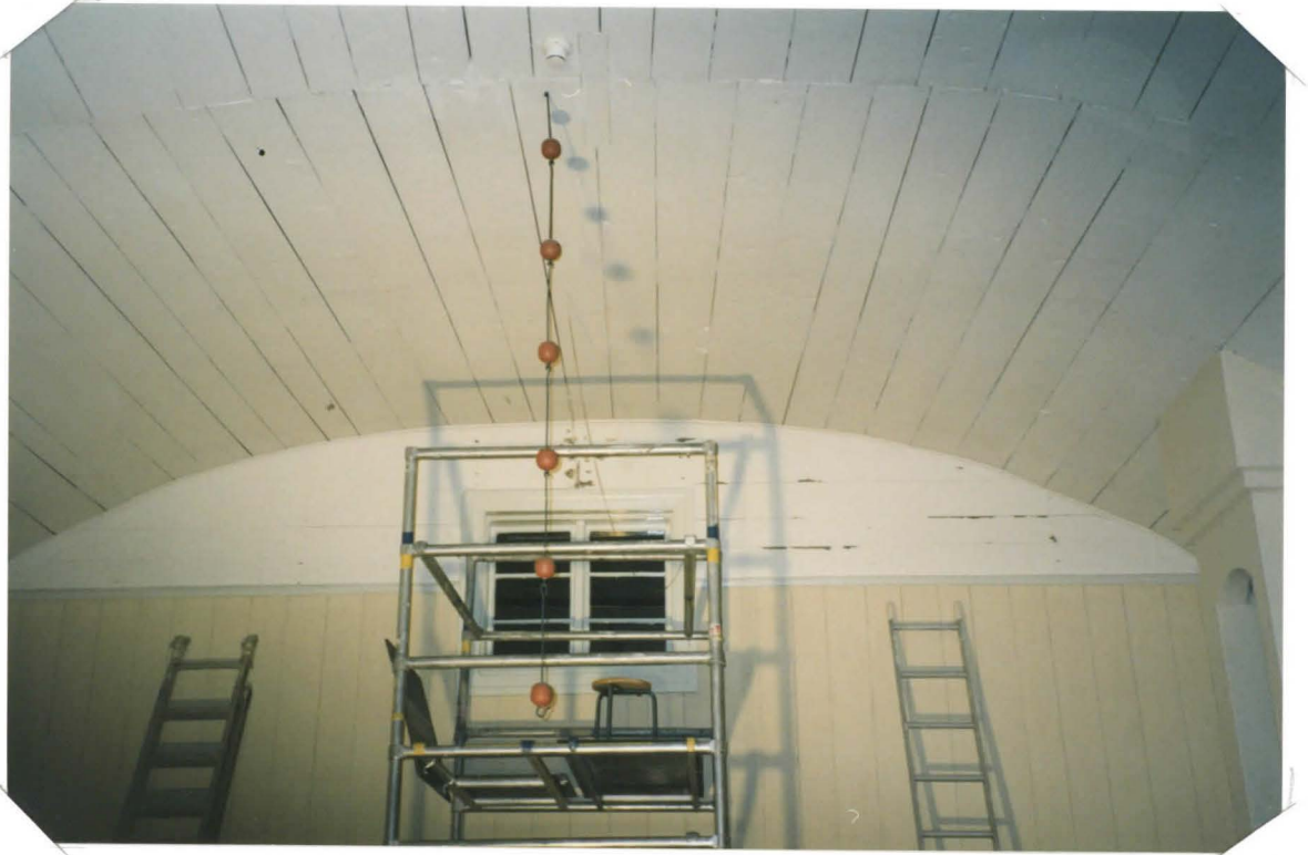
ETEL. PÄÄTYKAARI ENNEN KÄSITTELYÄ