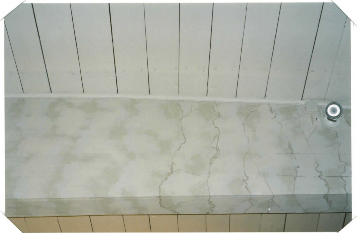
MARMOROINNIN MAALAUSTA ALTARIN PUOLEI- SEEN VETOPALKKIIN