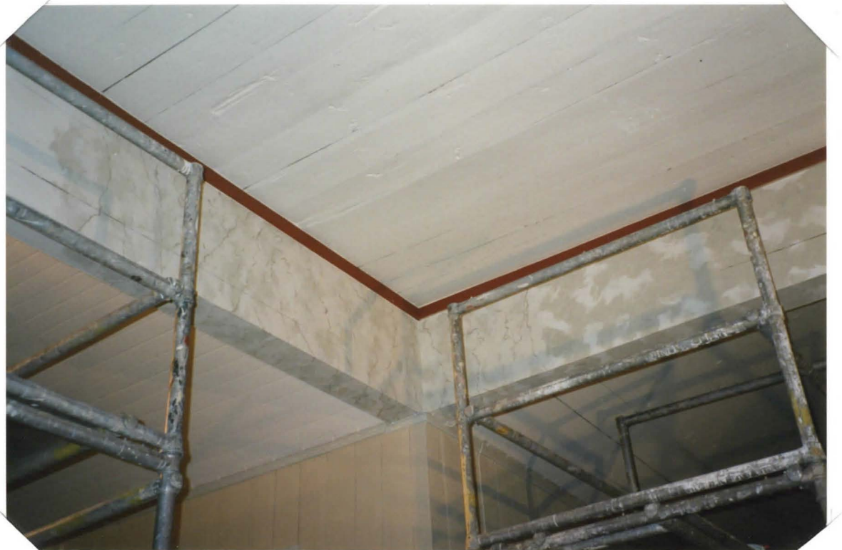
KESKISEN VETOPALKISTOJEN TYÖSTÖÄ