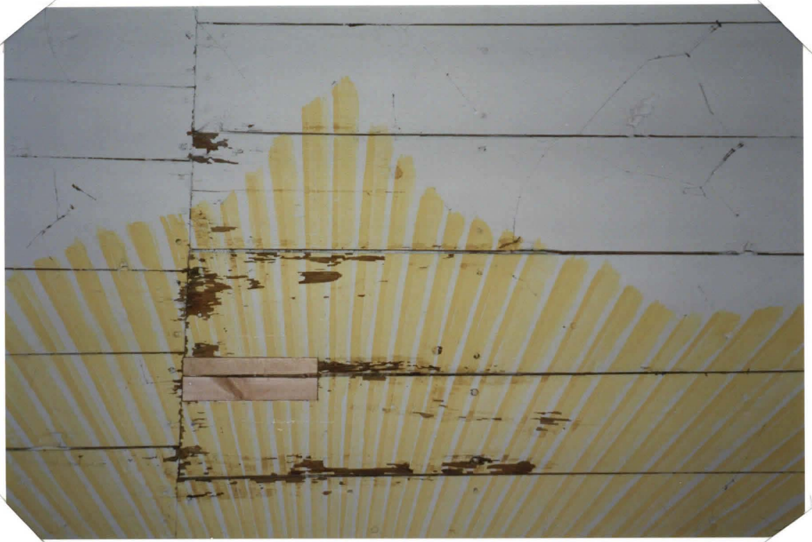
KESKUSAURINGON KOSTEUSVÄURIOITA JA UUTTA PUURAKKAUSTA