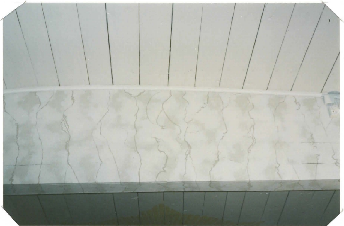
EM. VALTIINA . KUVAN KESKELLÄ PYHÄN ANDREAKSEN PROFILI; KIRKON SUOJEU PÄÄTÄMYS