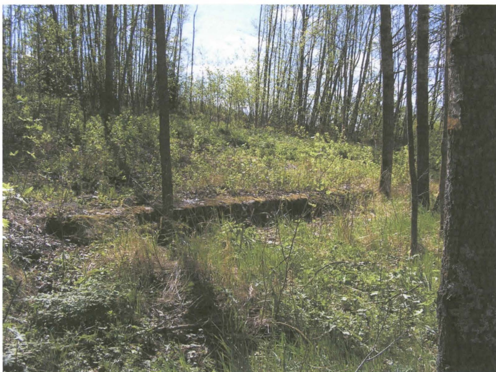
Kuva 12. Sahan/myllyn betoninen perustus.