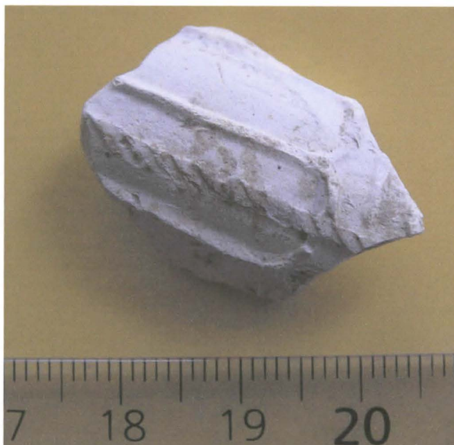
Kuva 1. Peltopöiminnassa löytynyt liitupiipun palanen.