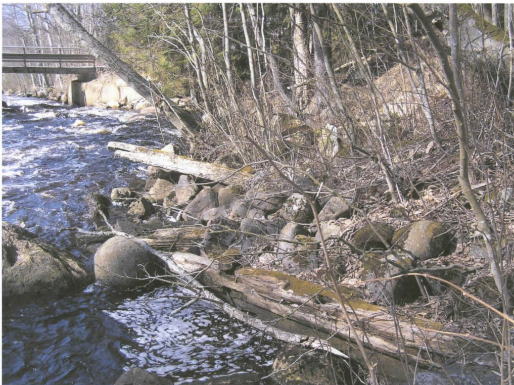
Kuva 8. Kairokosken pohjoispuolella jäljellä olevia puita.