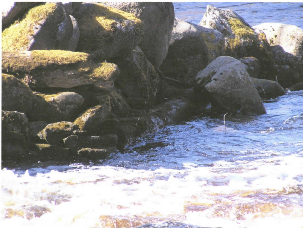
Kuva 7. Kairokosken eteläpuolella olevan arkkurakennelman puutukea.