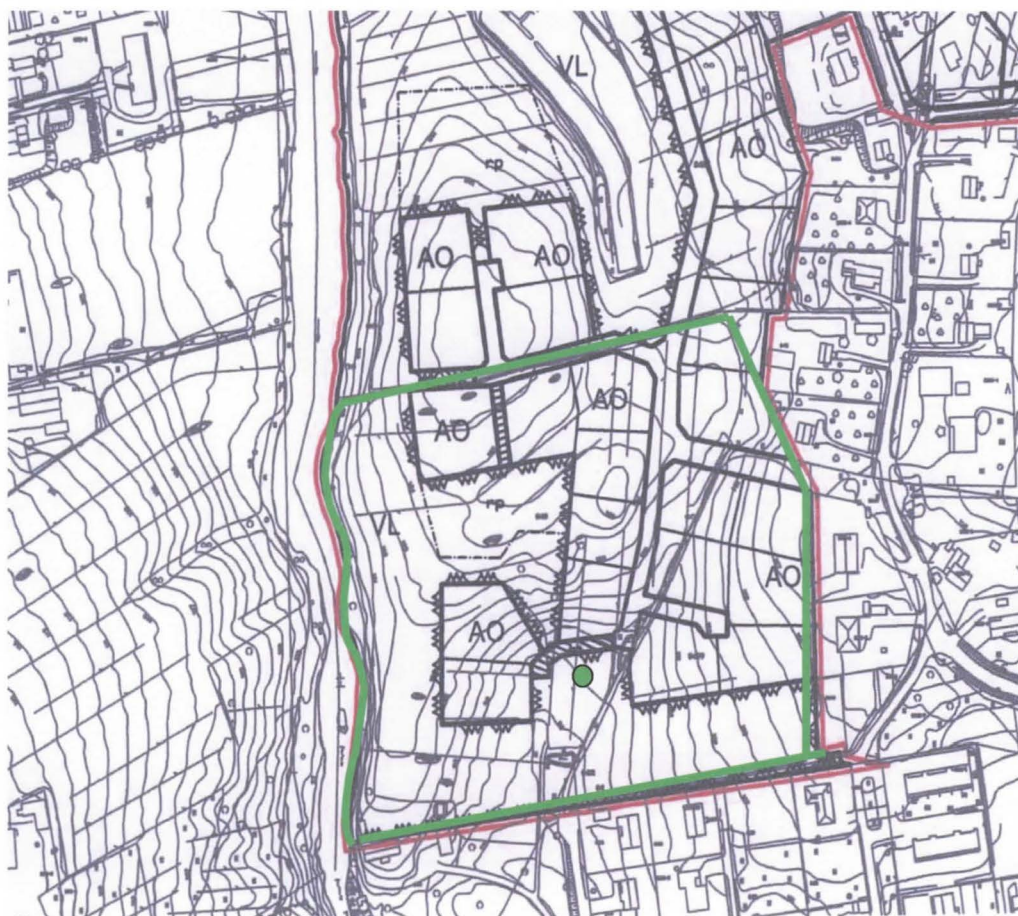
Kuva 2. Peltopöimittu alue kaava-alueen eteläosassa. Ympyrällä on merkitty liitupiipun palasen löytöpaikka.