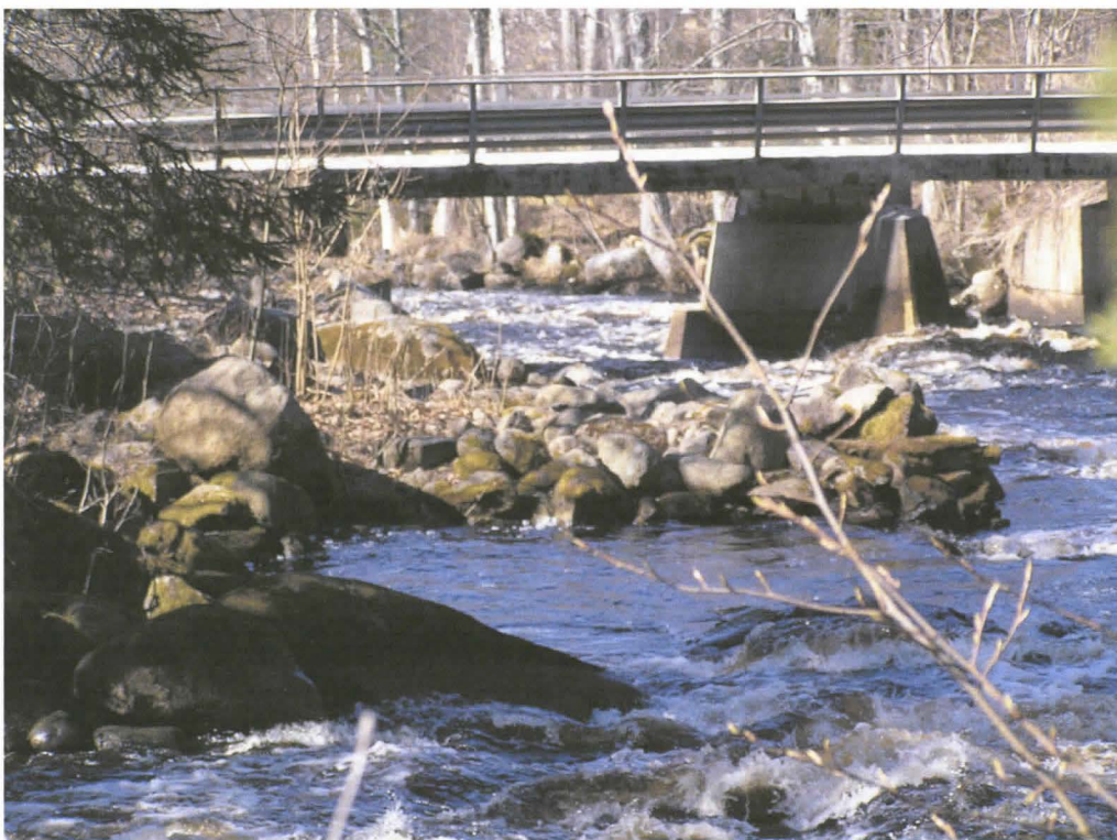
Kuva 6. Kairosken eteläpuolella oleva arkkurakennelma ja sen takana joen yli kulkeva silta. Kuvattu idästä.