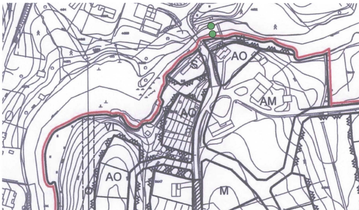
Kuva 3. Kiviarkun sijainti.