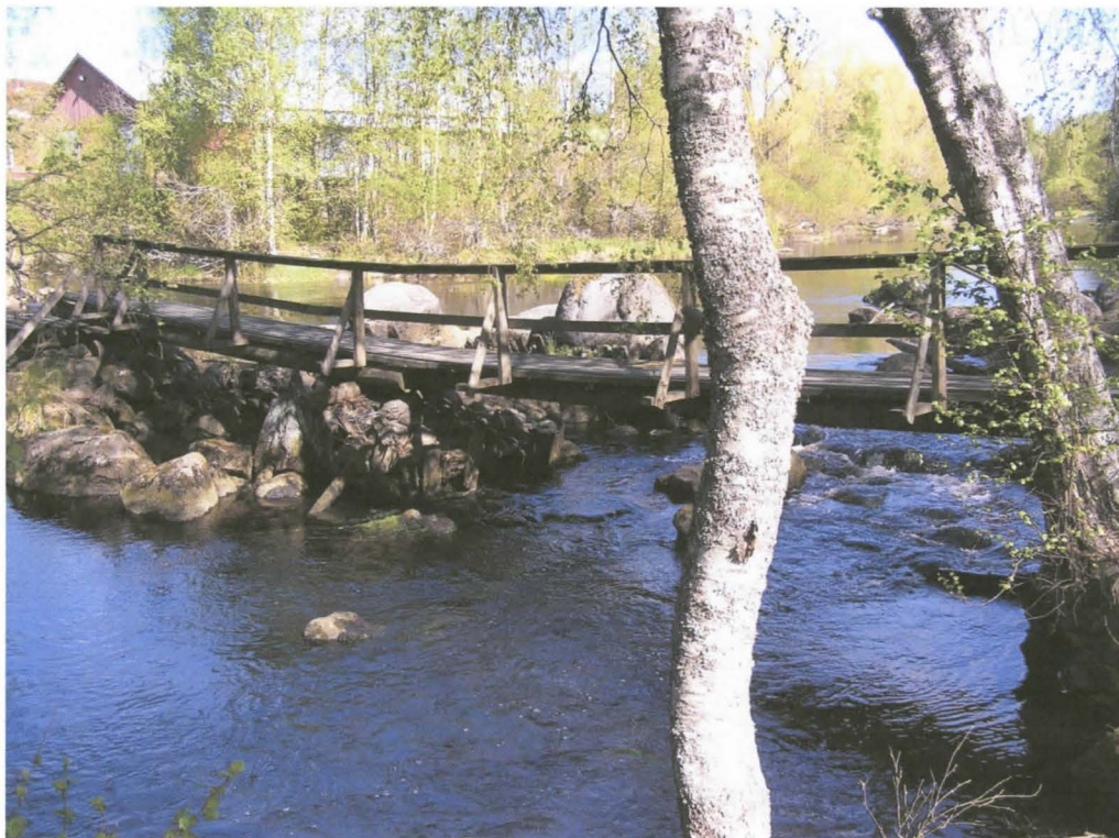
Kuva 11. Viinikankoskessa oleva kivikasa.