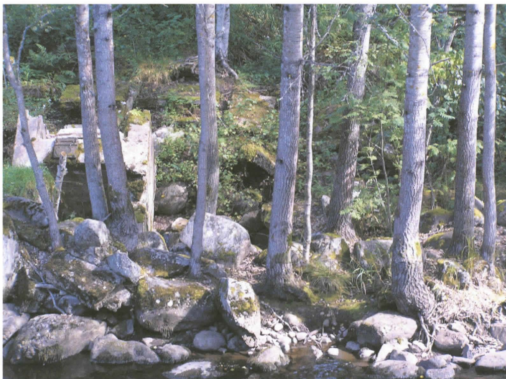
Kuva 9. Viinikanrinteen kohdalla oleva ränni. Kuvattu lännestä.