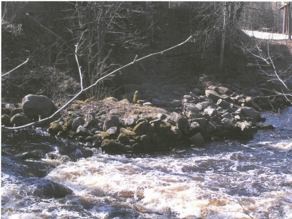
Kuva 5. Kairosken eteläpuolella oleva arkkurakennelma. Kuvattu pohjoisesta.