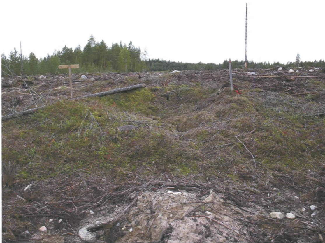
Kuva 2. Painanne koillisesta päin kuvattuna.