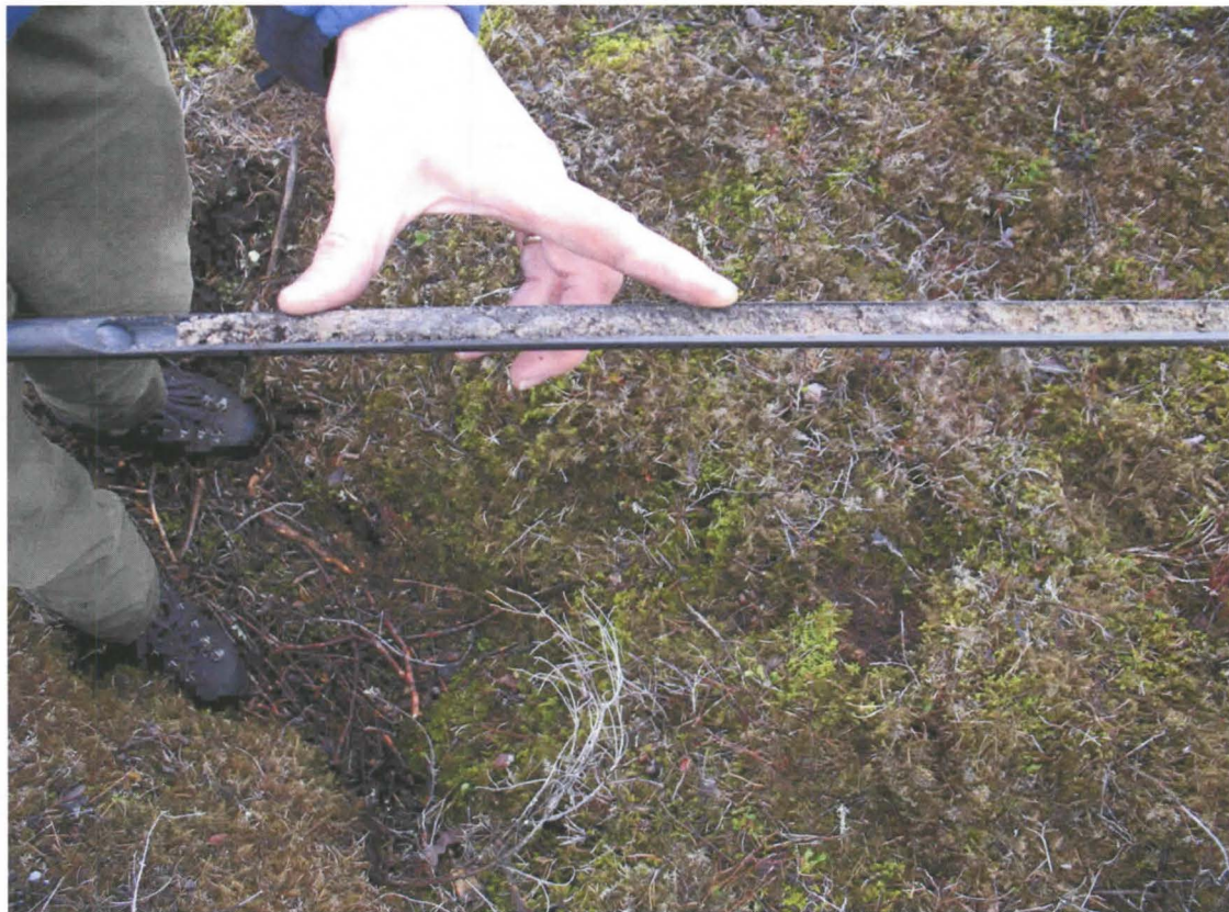
Kuva 4. Painanteen keskelle tehdystä kairanäytteestä esiin tullutta tummaa nokista maata.