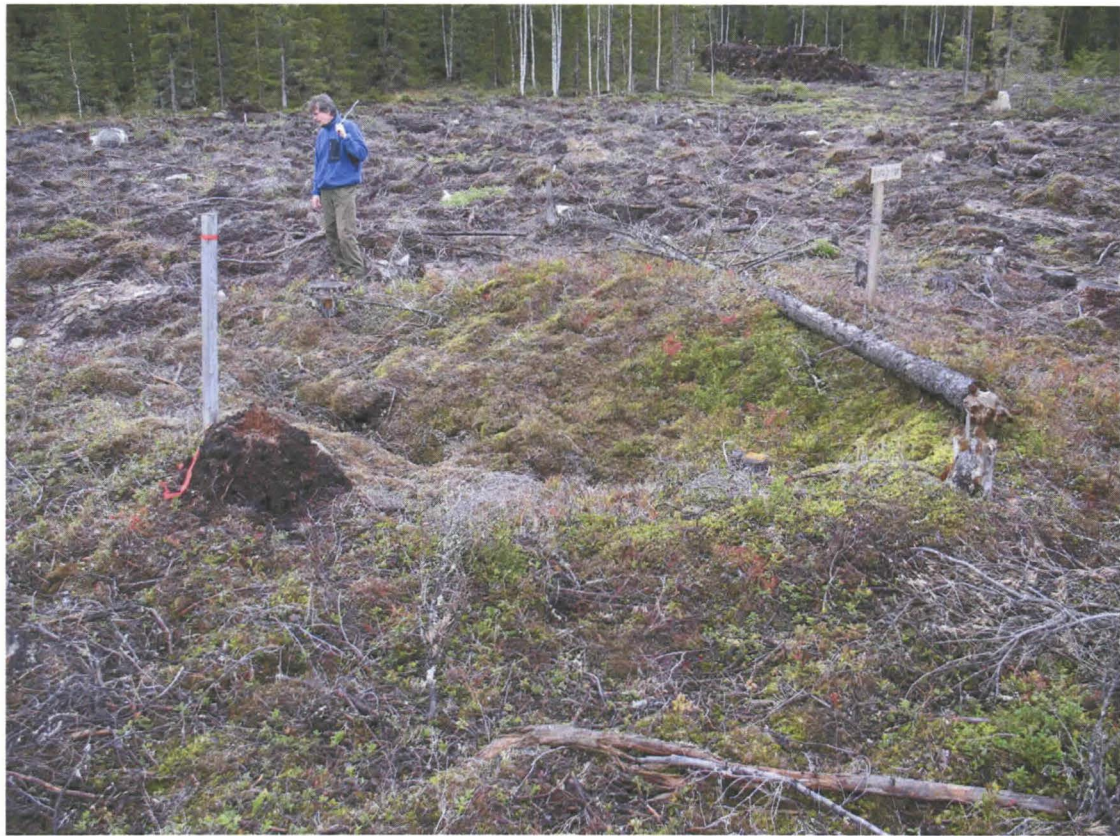
Kuva 3. Painanne lännestä päin kuvattuna.