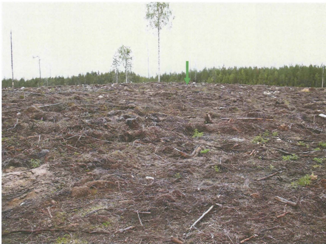
Kuva 1. Hakkuualue; painanne on merkitty vihreällä nuolella.