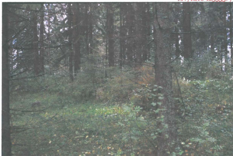
Kuva 4: Rakennuksen pohja. Kuvaaja: V.-P. Suhonen