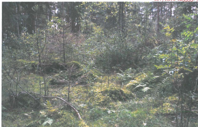
Kuva 2: Rakennuksen pohja.

Peltojen ympäröimällä harjanteella on tien vierellä noin 8 x 6 metriä laaja rakennuksen pohja. Rakennus on täysin pensaikon, vesakon ja aluskasvillisuuden peitossa. Rakennuksen sisällä on kumpare (uuni?). Noin puoli metriä korkean kivijalan päällä on jäljellä jonkin verran lahonneita seinähirsiiä.