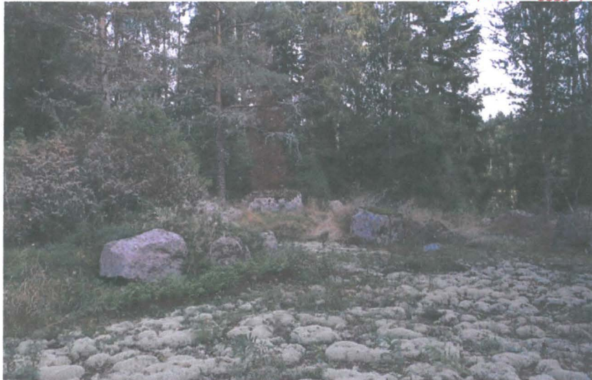
Kuva 3: Rakennuksen pohja.

Havaintomahdollisuudet olivat inventointiajankohtana kohtalaisen hyvät. Rakennuksen päällä kasvaa heinää ja katajaa. Rakennus rajoittuu etelästä avokallioon ja muualta kuusi-/mäntymetsään.