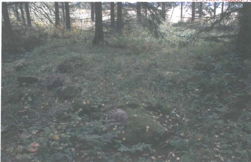
Kuva 1: Rakennus 2. Etualalla mahdollista kivijalkaa.