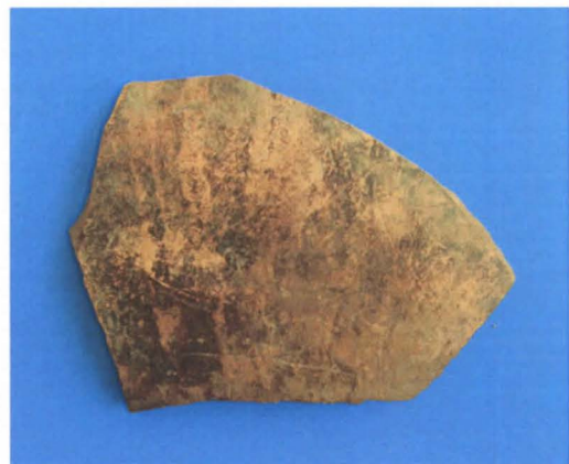
Kuvat 1 ja 2: Punasavikeramiikan toinen ulkopinta oli nokinen (KM2007016:1).