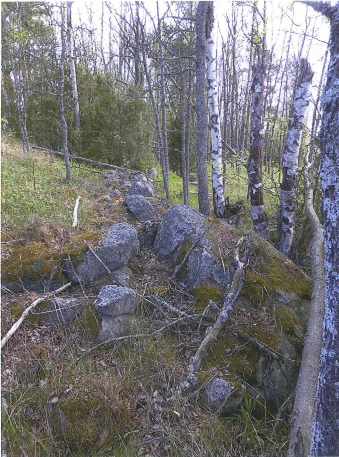
Kivaitaa alueen länsiosassa