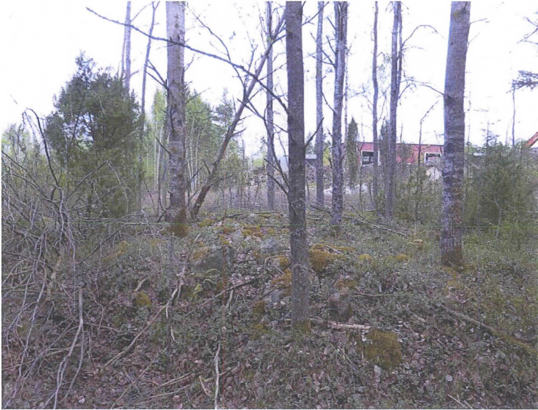
Viljelyröykkiö alueen pohjoisosassa