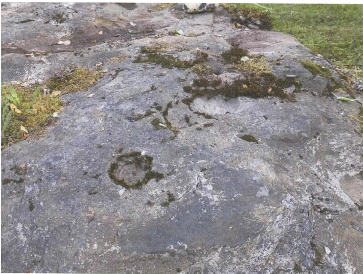
Kuvan keskellä mahdollisia ihmisen hiomia kuoppia