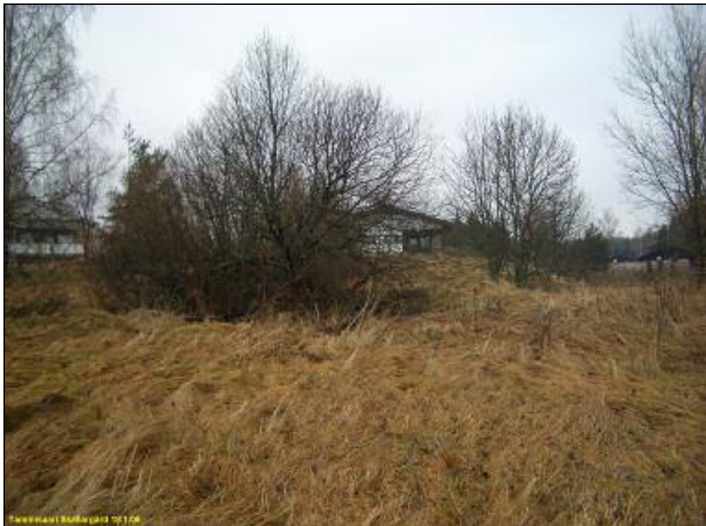
Sama kuin yllä, mutta kauempaa. Sköldargårdintien mutkan koillispuolella, pellon ja tien välillä.