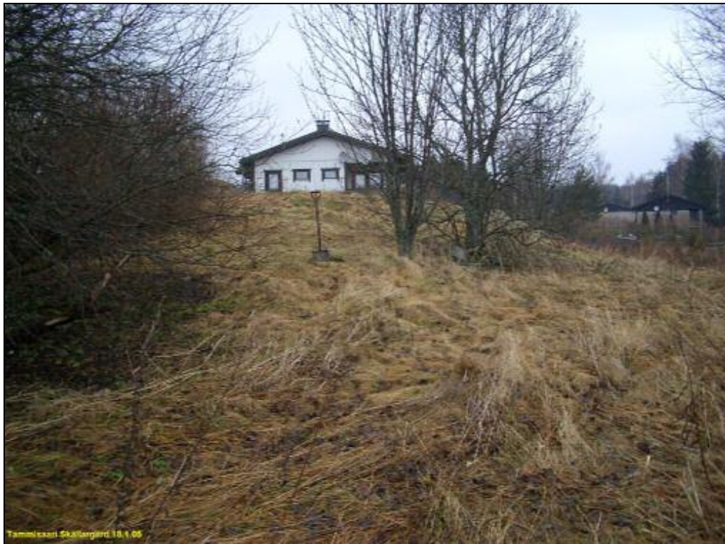
Matala maakasa törmän reunalla lapion kohdalla ja sen oikealla puolella koehuopissa laastin- ja tiilenpaloja. Kartalla kohteen 1 laidalla oleva punainen piste. Kuvattu koilliseen.