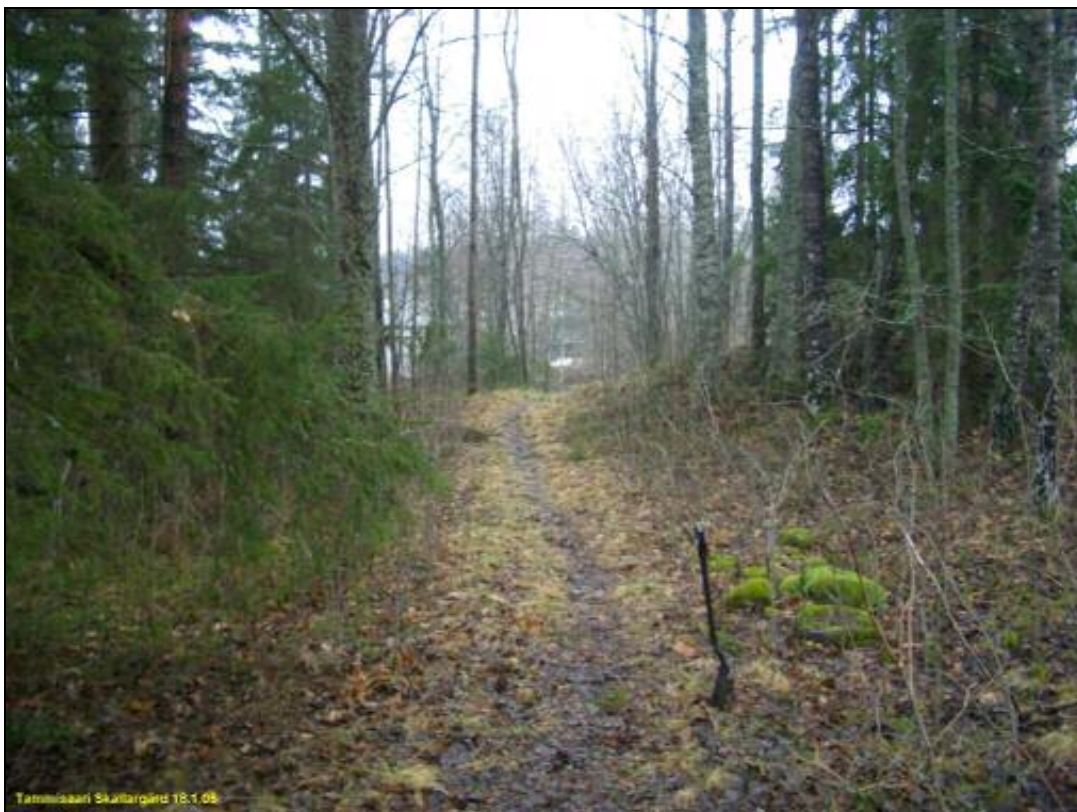
Vanha kuninkaankartassa näkyvä tiepohja Sköldargårdintien eteläpuolella, vedenottamon tasalla rinteiden laella. Kuvattu pohjoiseen.