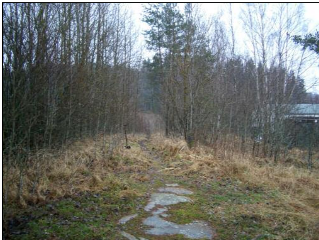
Vanha kuninkaankartassa näkyvä tiepohja heti Sköldgårdintien kalliroleikkauksen eteläpuolella. Kuvattu etelään.