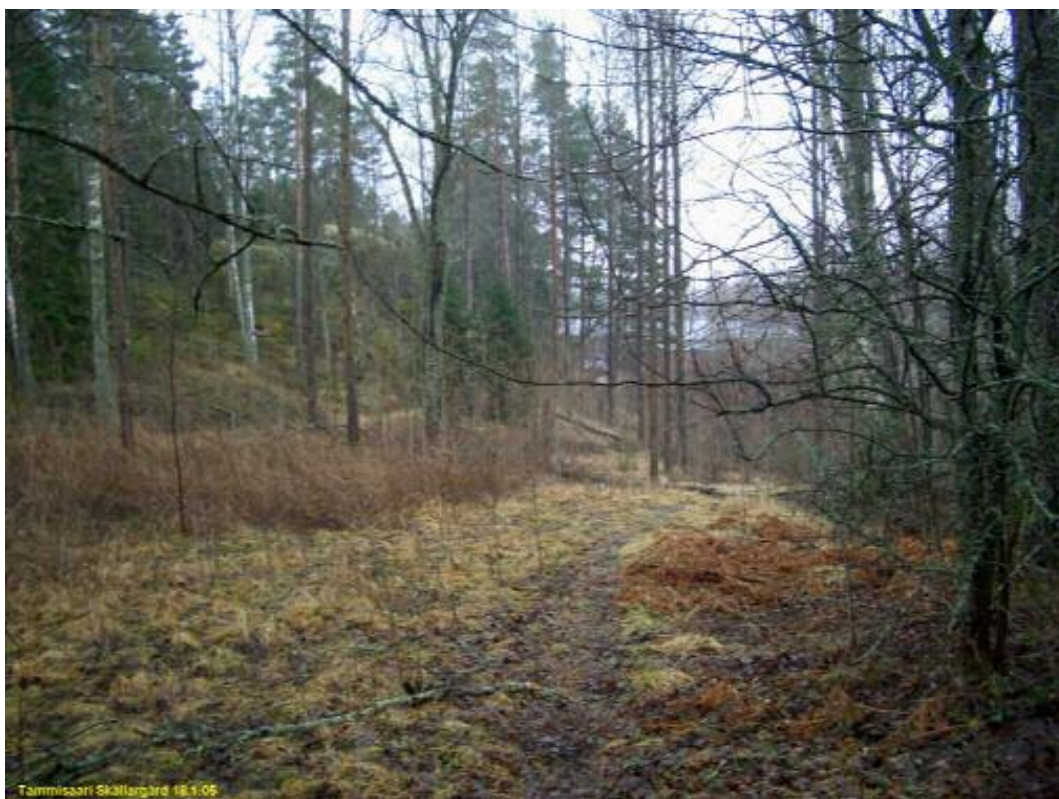
Vanha tienpohja, tien mutkan kohdalla, kuvattu lähes samalta paikalta kuin edellinen kuva, mutta etelään.