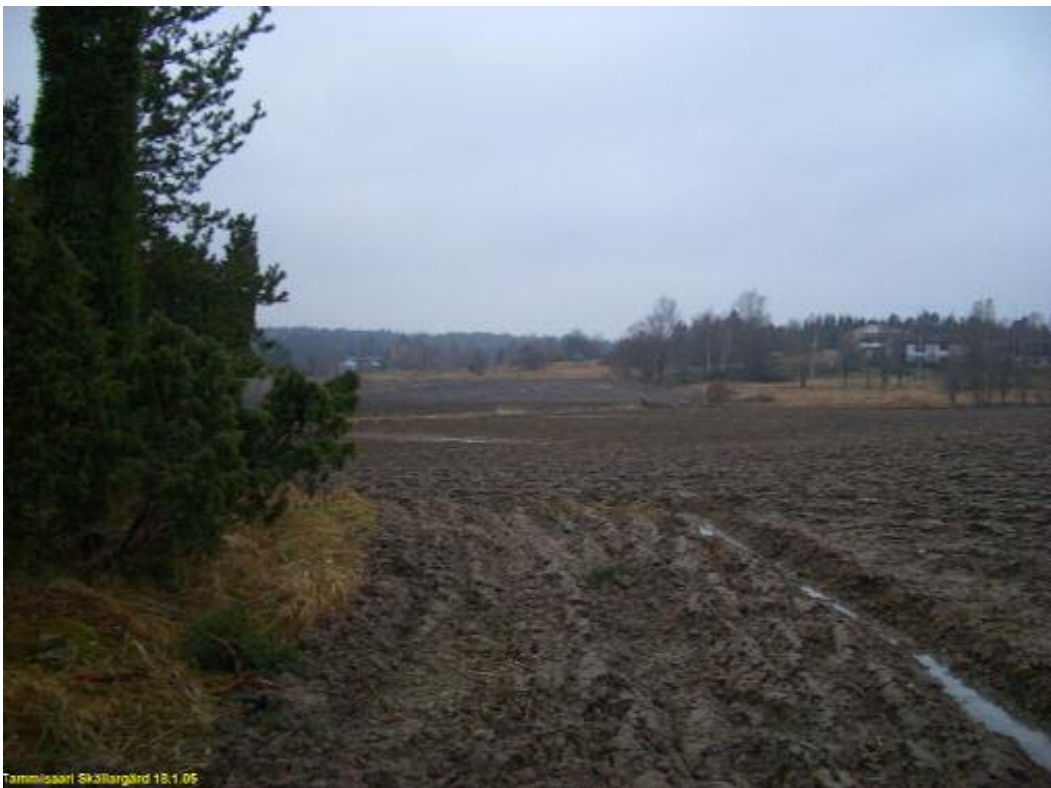
Paikalta 3 (kartalla) otettu kuva luoteeseen kohti Sköldargårdintietä. Tällä kohden pellossa oli hieman enemmän tiiltä ja keramiikkaa.