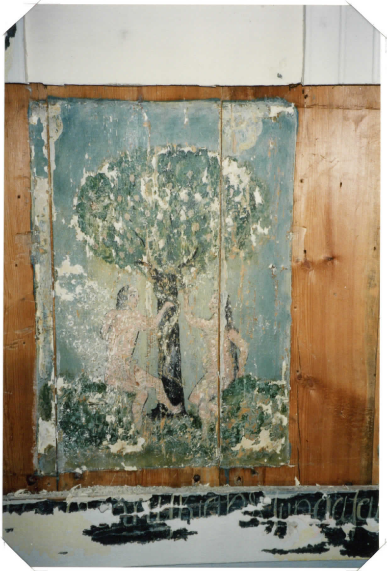
ESILLE OTTDA . . .