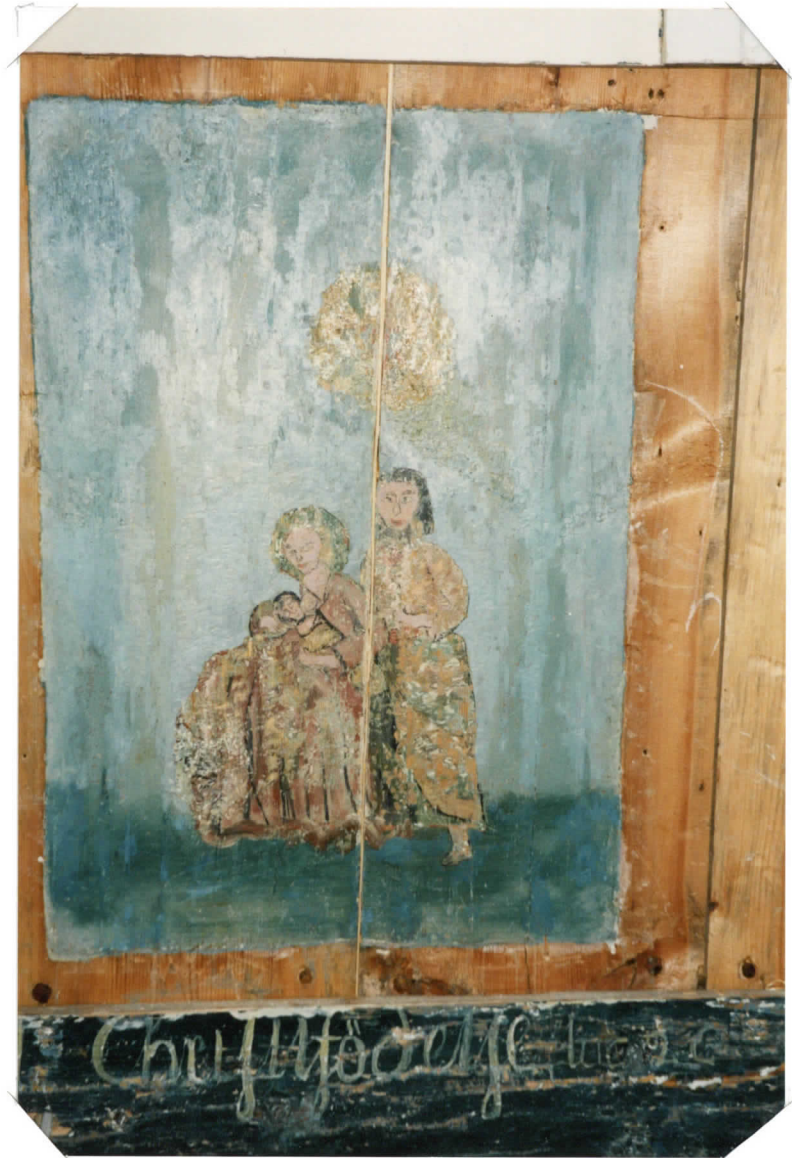
HEILIN TAUSTAMAALUSTA OSIN VÄRI TÄYDENNETTY