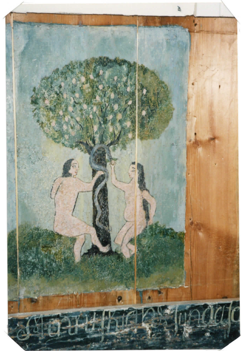
.JA. PEILIN VÄRIPAIKKAUSTA