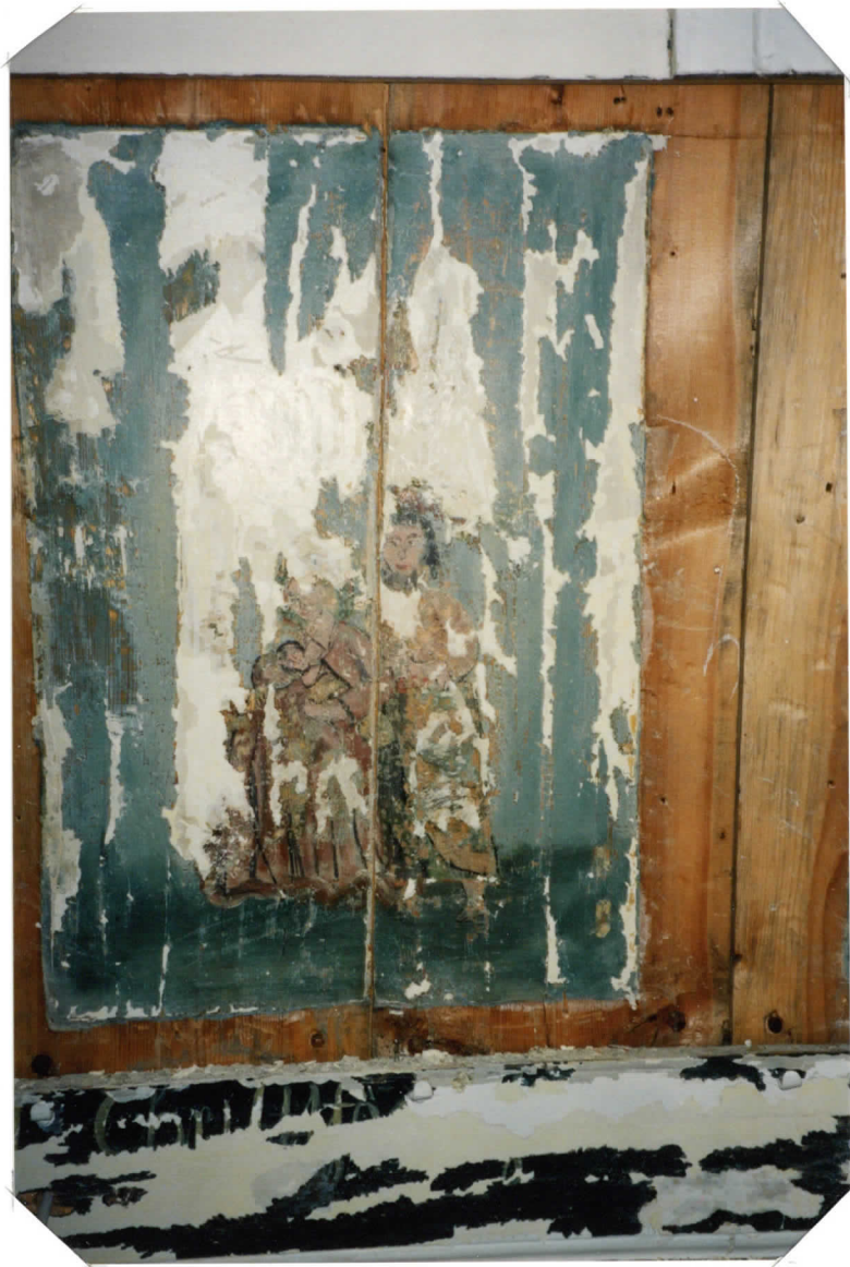
ESILLE OTTA ..... →