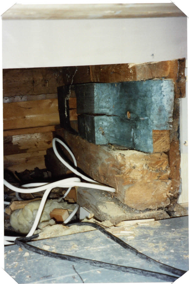
POHJ. LEHTERIN PORTAIKON TÄSNÄ ALAPUOLINEN TILA (JALAN PUOLELLA) TOD. NÄK. SINI PALKKI ON BSA 1800-L KÄYTTÖSSÄ