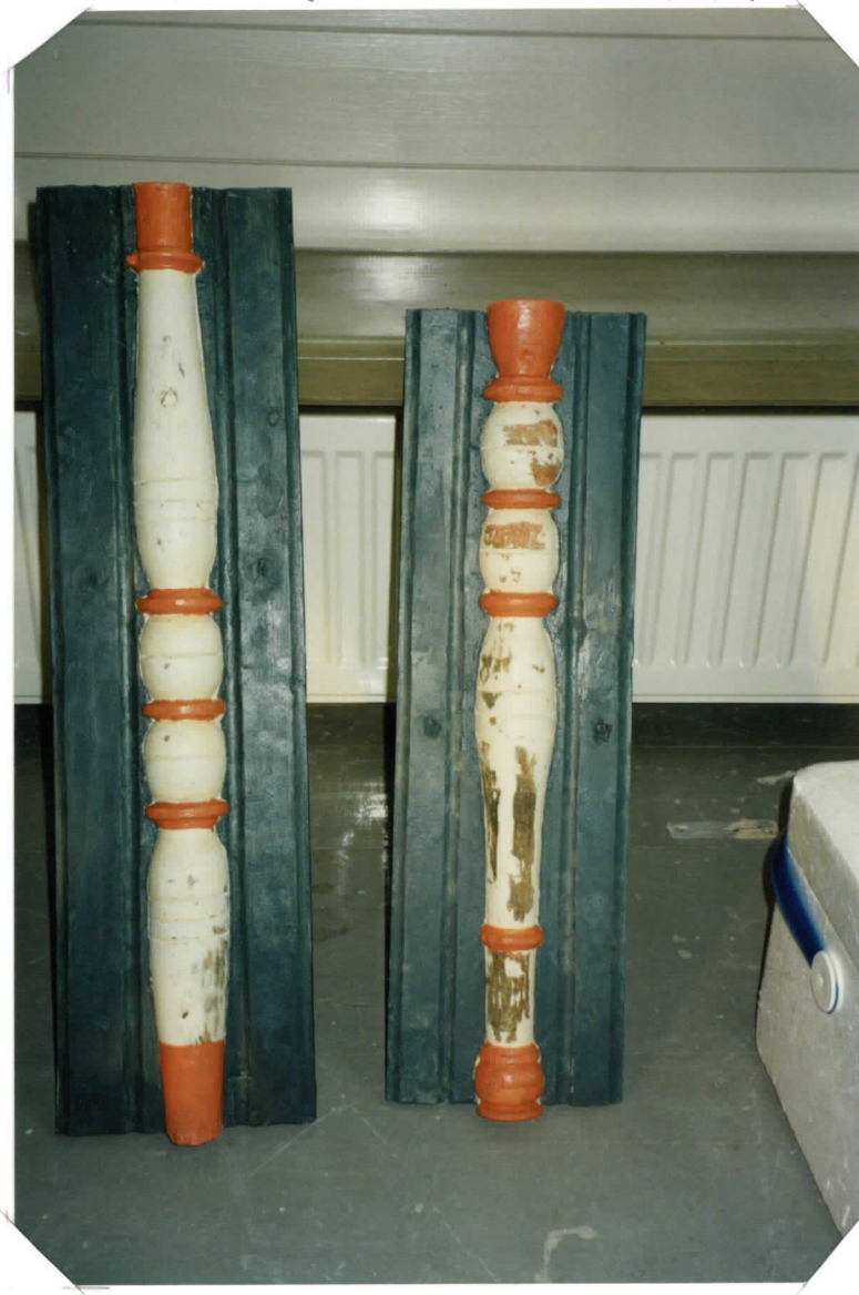
PILASTEREIDEN MAALAUSTA KULTAFRONSSAUS PUUTTU