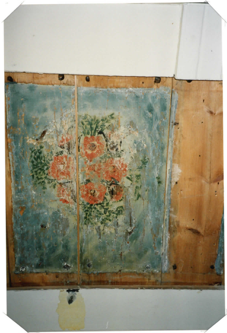
PEILI ESILLE OTETTUNA JA TIKUTETTUNA