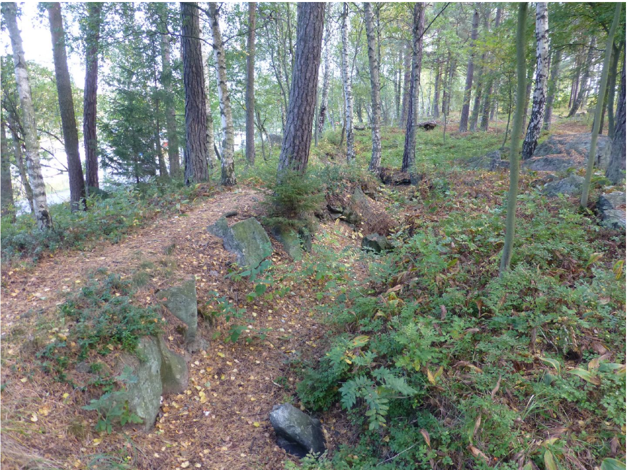
Varustukset kuvattuna lännestä, alueen keskivaiheilta