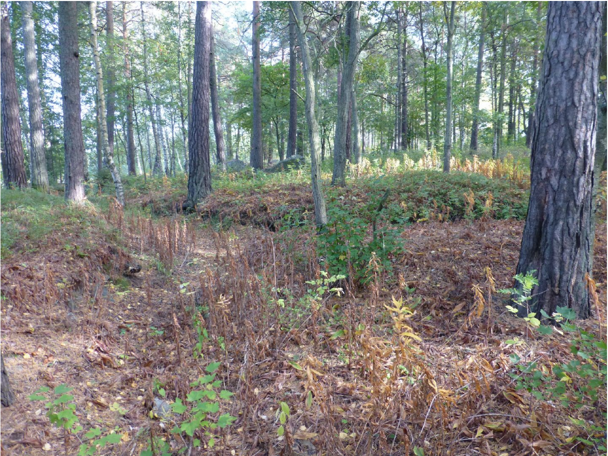
Varustukset kuvattuna lännestä