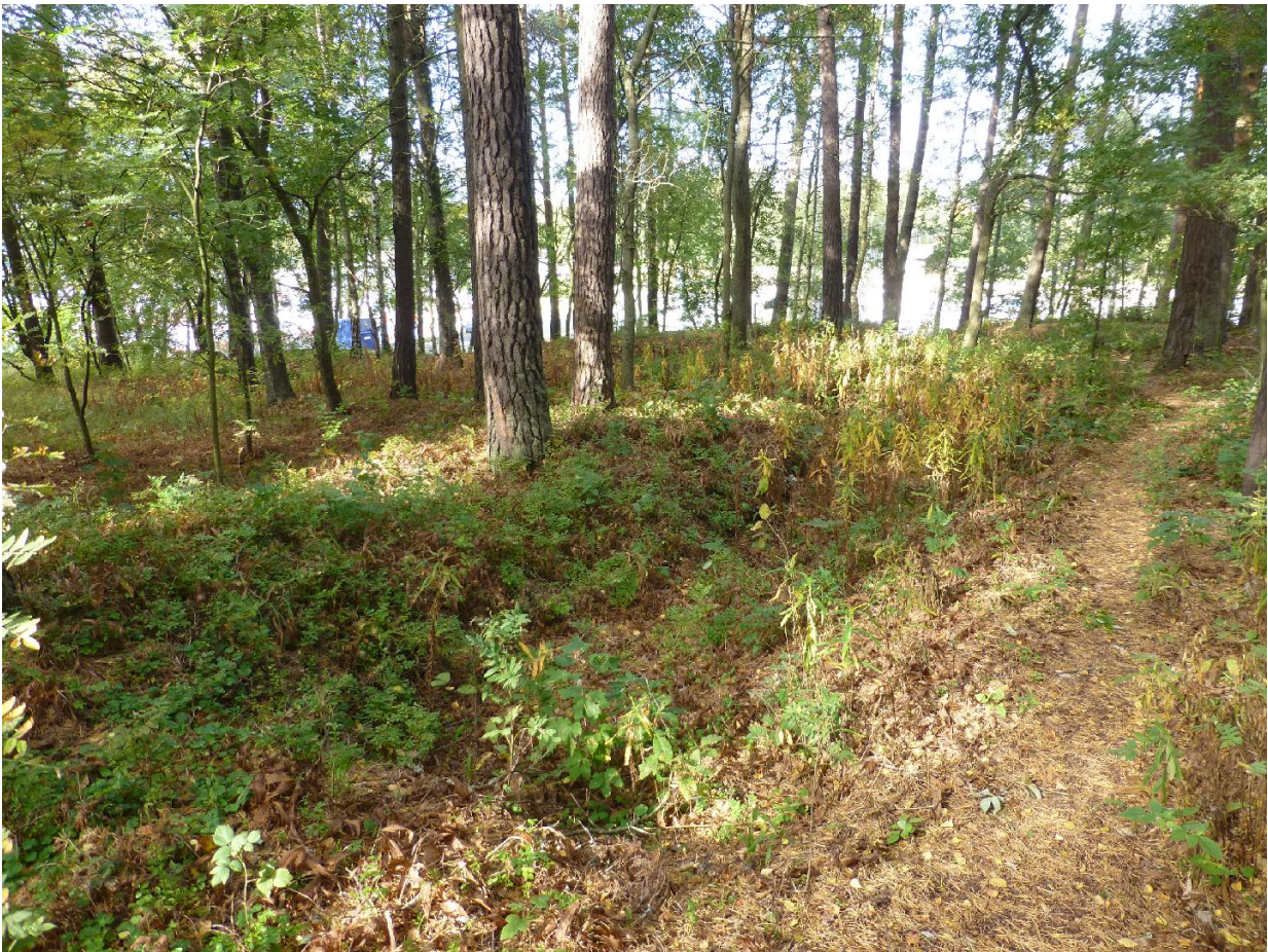
Varustusta kuvattuna kaakosta, taustalla Syväraumanlahti