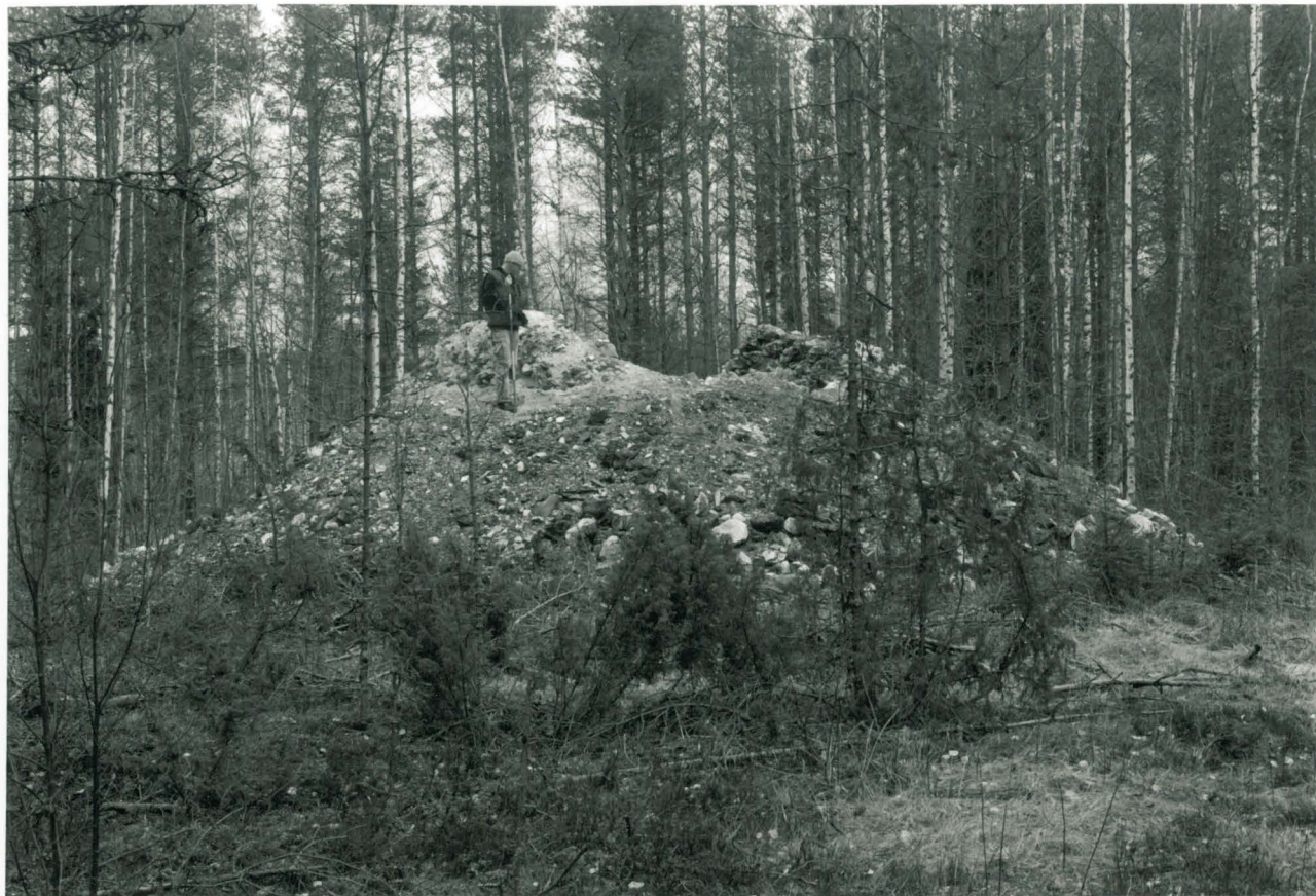
HESBACKAN VUONI EDESTÄ