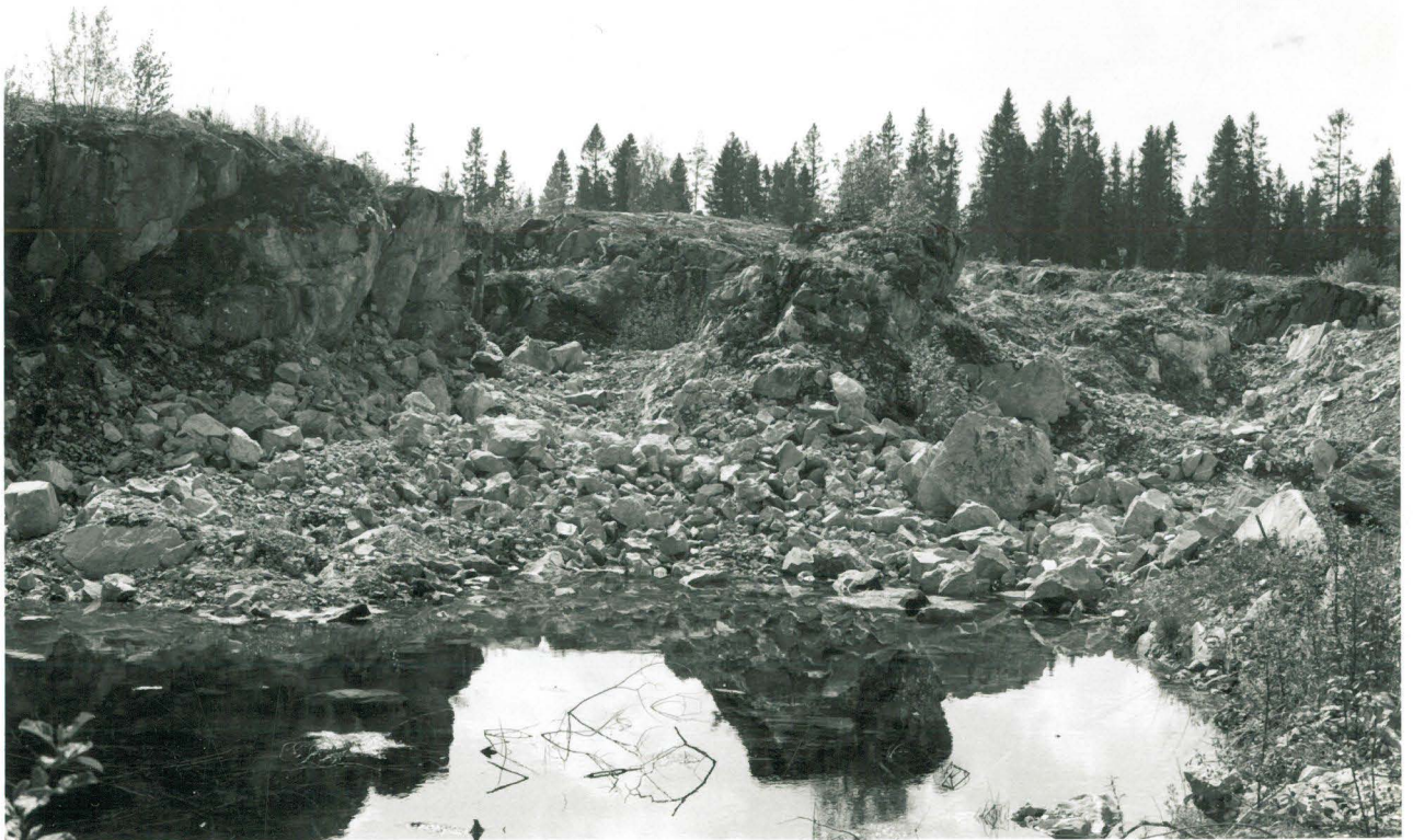
ETRA KOOPPA KOHDE 4 KUVAN OIK. REUNASSA