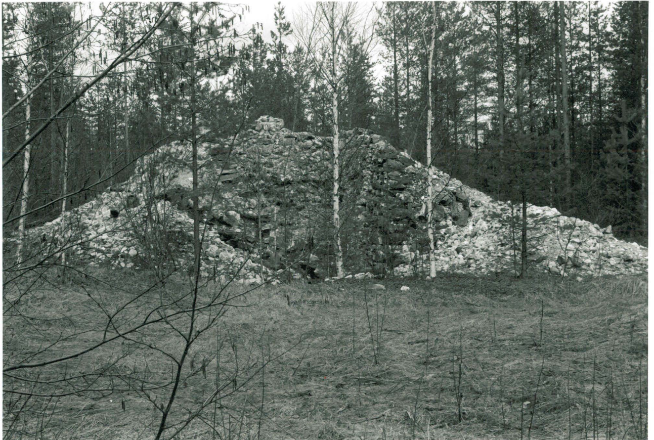
PIENEMPI UUNI EDESTÄ