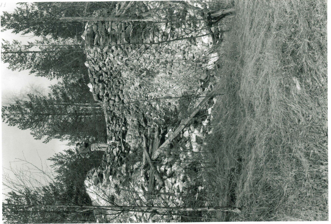
RHO NEG 113688