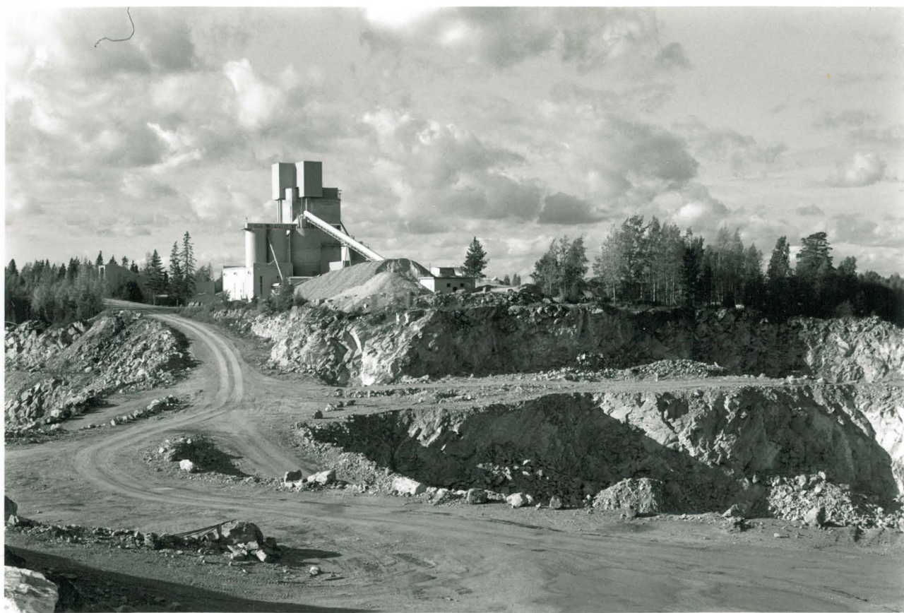
RYYTIMÄN - KOTAKANKAAN ALUE RYYTIMÄN LOUMOS