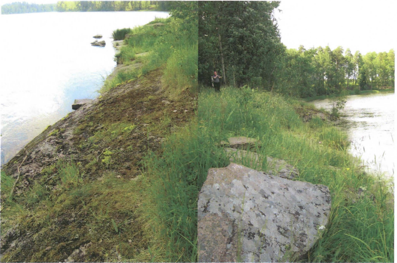
Kuvat 1-2: Sammaloitunutta kalliohakkauspintaa suunnasta N (vas.) ja suunnasta S (oik).