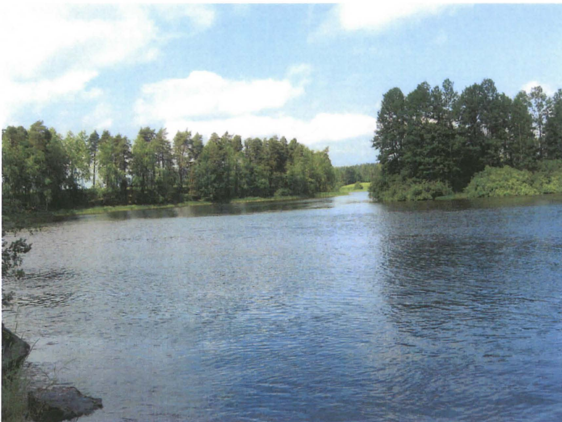
Kuva 3: Värälänkoskea joen yläjuoksuun päin. S.