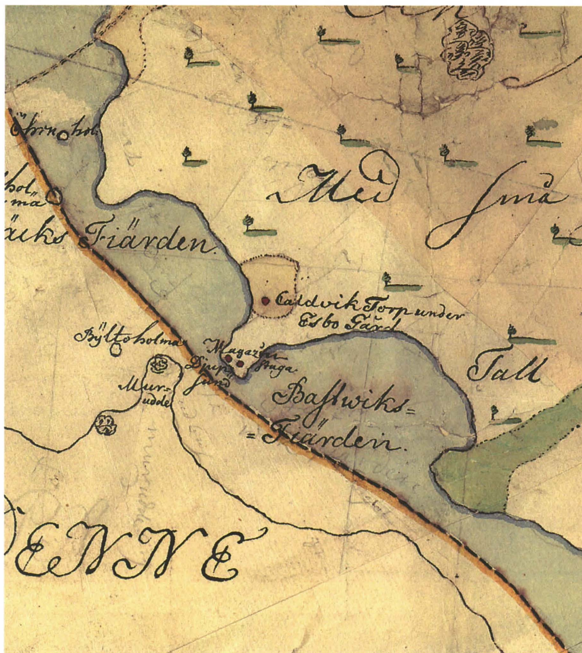
Vuoden 1750 Espoon pitäjän karttaan on merkitty makasiini ja tuparakennus.