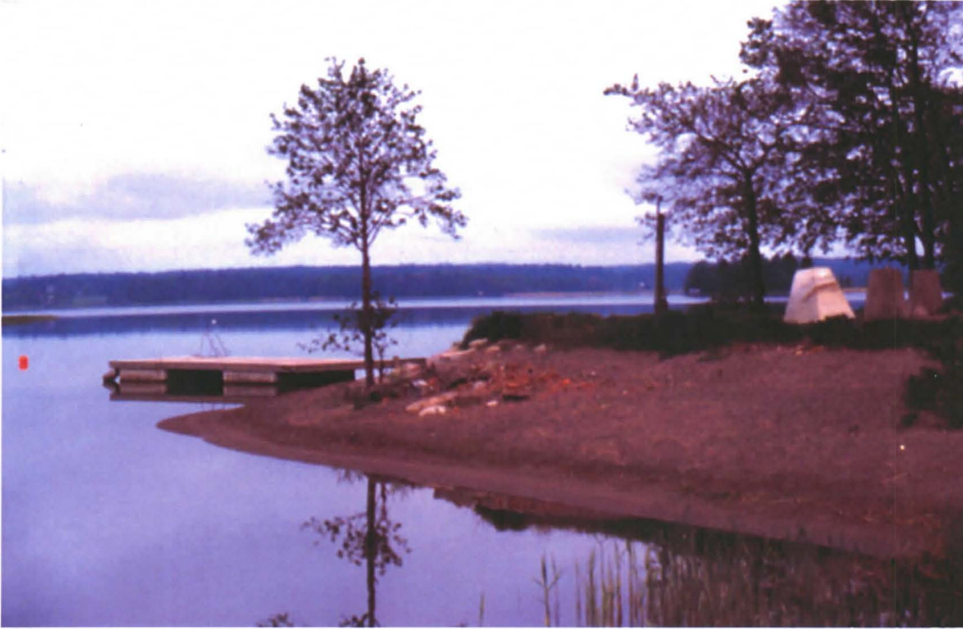
Kuva: Uimarantaa ja mahdollisen laiturin jäännökset. Kuvattu kaakosta. PH.

Paikalla on sijainnut Espoon kartanon lastauspaikka. Vuoden 1750 kartassa paikalla on ollut kruununmakasiini ja tupa kruunulaivuria varten. (Härö 1999, 137). Espoon kartanolla on ollut 1500-lopulla laivanrakennuspaikka, jonka tarkkaa paikkaa ei tiedetä. 1700-luvulta on ”tietoja”, että se olisi sijainnut Makasinuddenilla. (Ramsay 1924, 291; Härö, 1991, 137). Helsinkiläinen rakennusmestari Karl Wikman perusti 1886 Kalvinkin rantaan Åminnen suuren tiilitehtaan (Härö, Erkki 1991, 51).