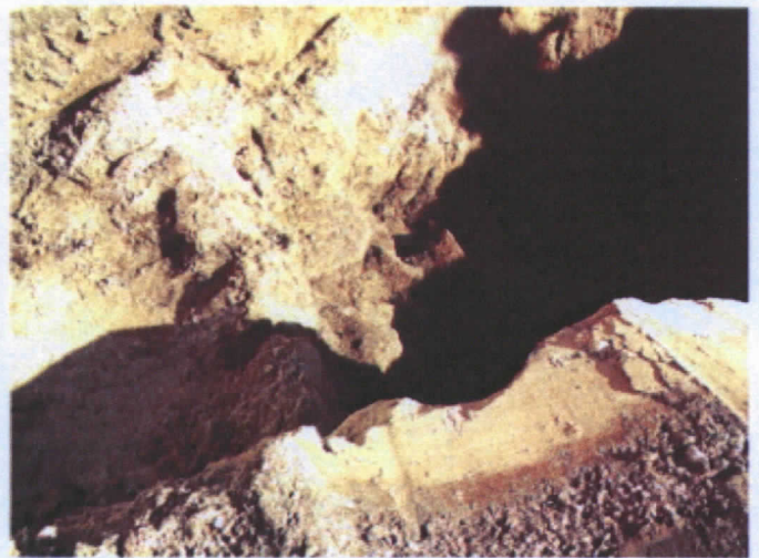
Kuvaliite 5-6 : koeojan 2 muuria