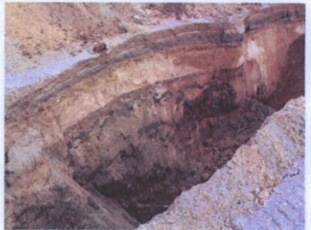
Kuvaliitteet 1-4 : koeojan 1 muuria.