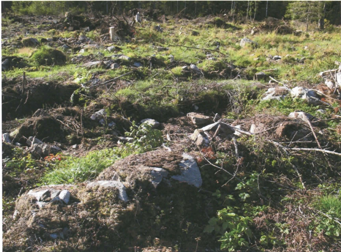
Kuva 6. Rakennuksen perustus.