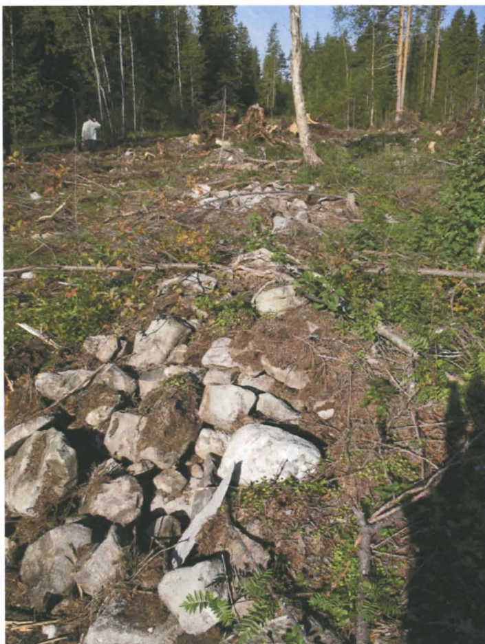
Kuva 2. Pitkittäin kulkevaa kiviladellmaa.