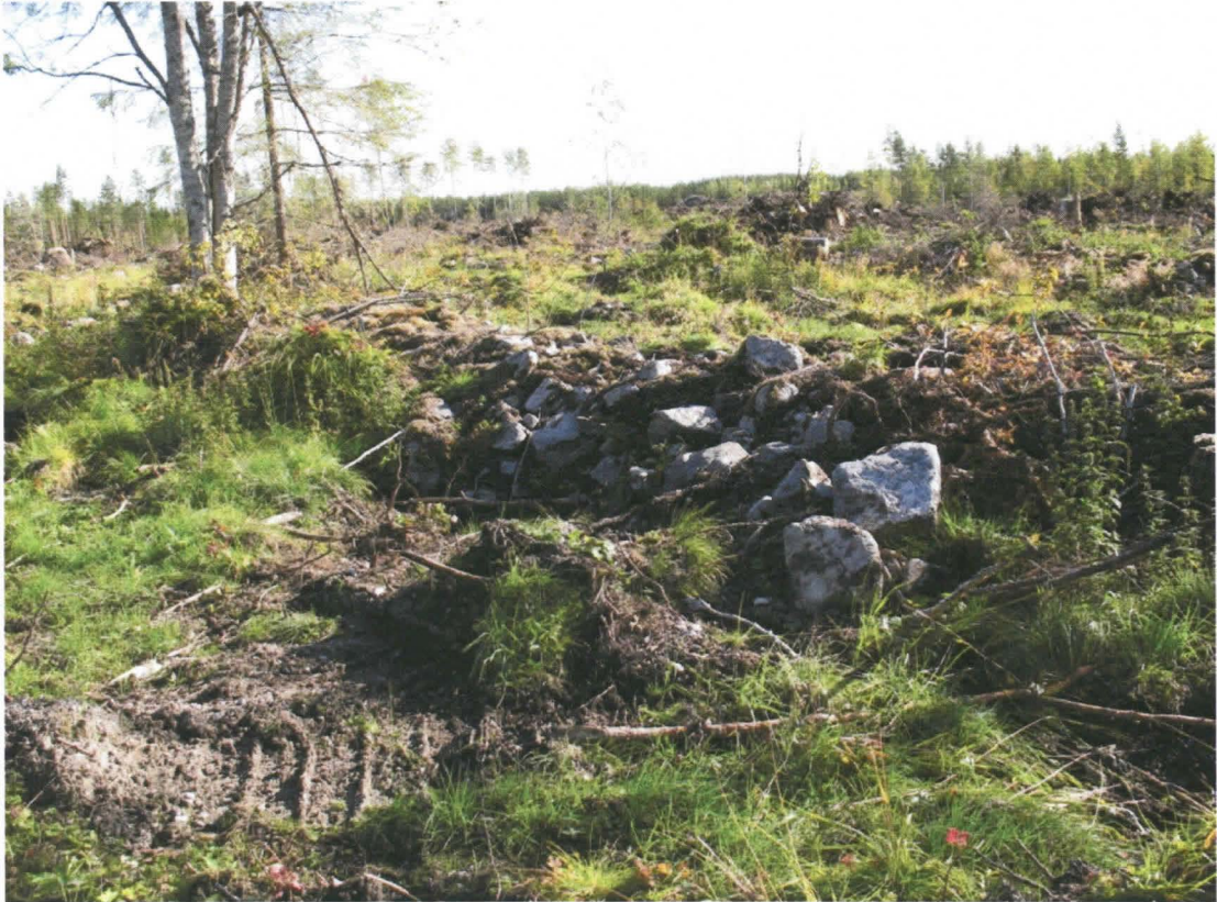
Kuva 3. Poikittain kulkeva kiviladelma.