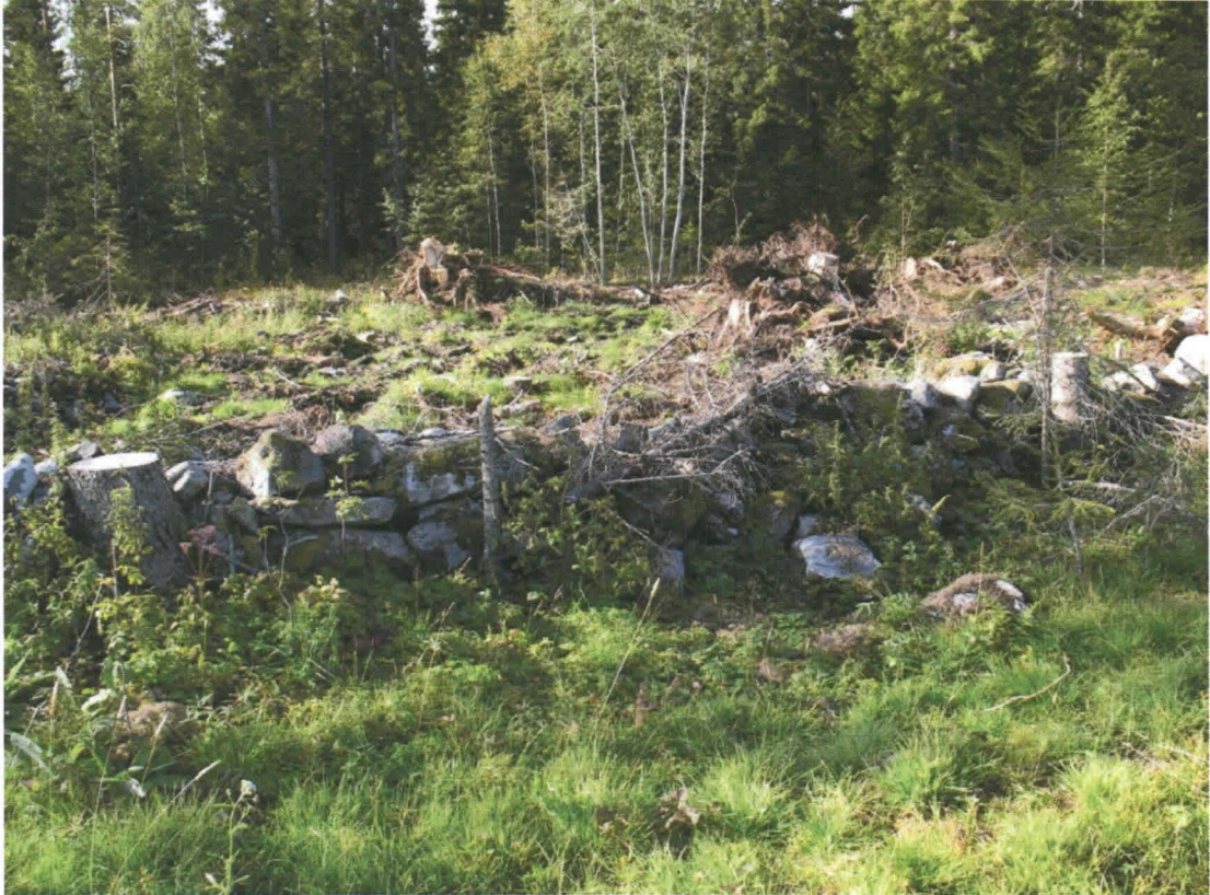
Kuva 5. Säilynyttä kiviaitaa.