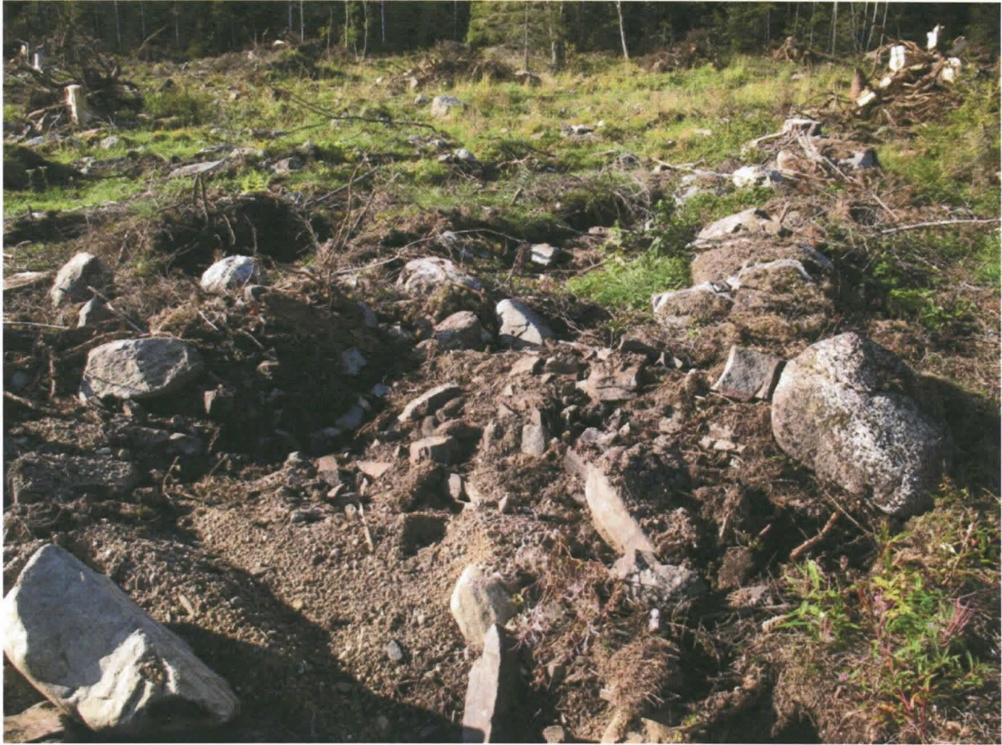
Kuva 7. Rakennuksen perustuksen pohjoiskulmassa oleva todennäköinen tulisija, jossa palanutta kiveä.