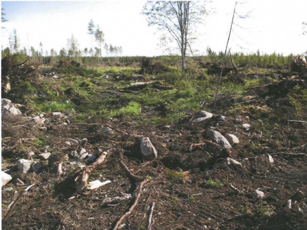
Kuva 1. Yleiskuva kannonnostoalueelta. Alueen keskellä kulkee luontopolku, joka johtaa Levanevan retkeilyreitistölle.