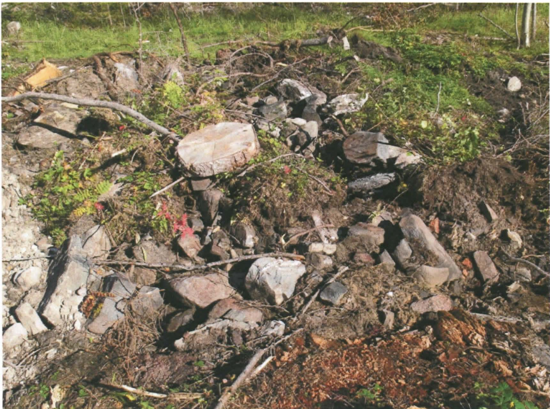
Kuva 8. Alueen länsiosassa esiin tullut mahdollinen tulisijan paikka.