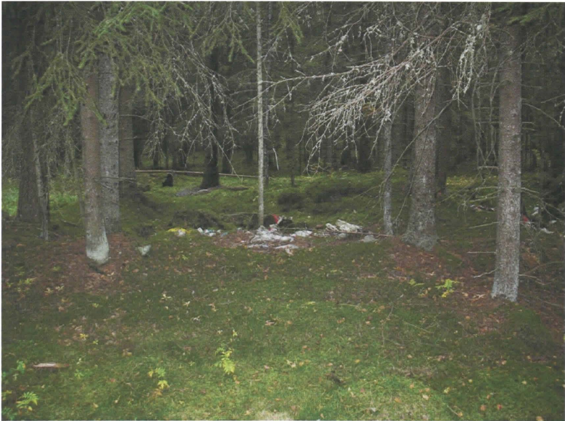
Kuva 4. Sama kuin edellä.