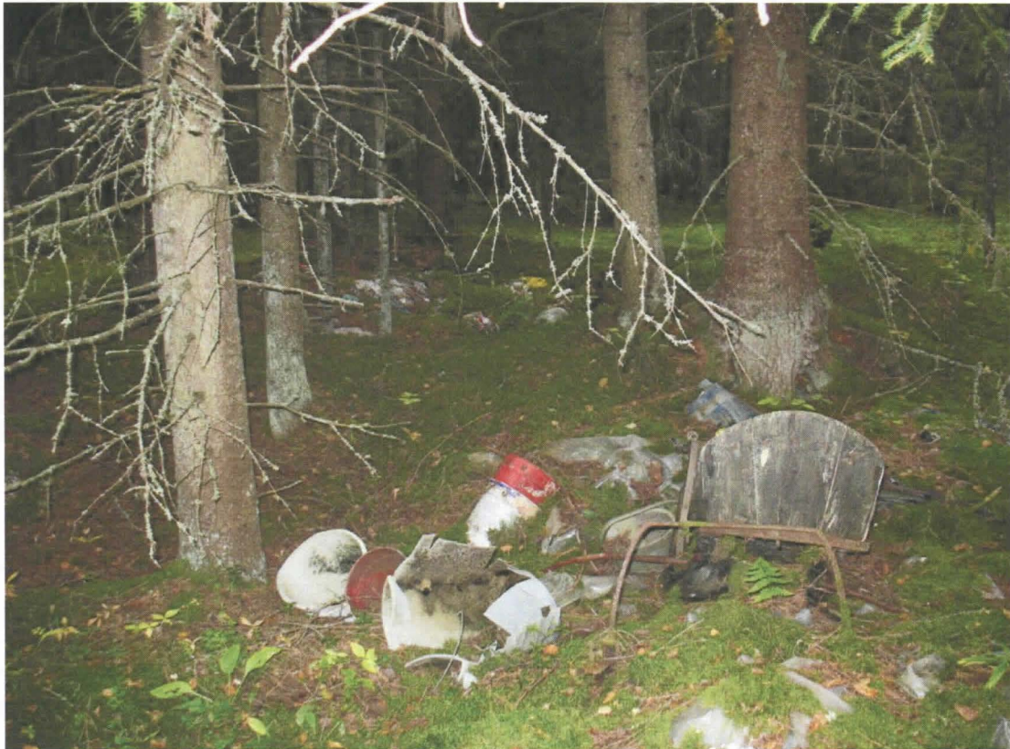
Kuva 2. Kohteen selvin ja suurin rakennuksen perustus, jonka päälle on kerätty kaikenlaista jätettä.