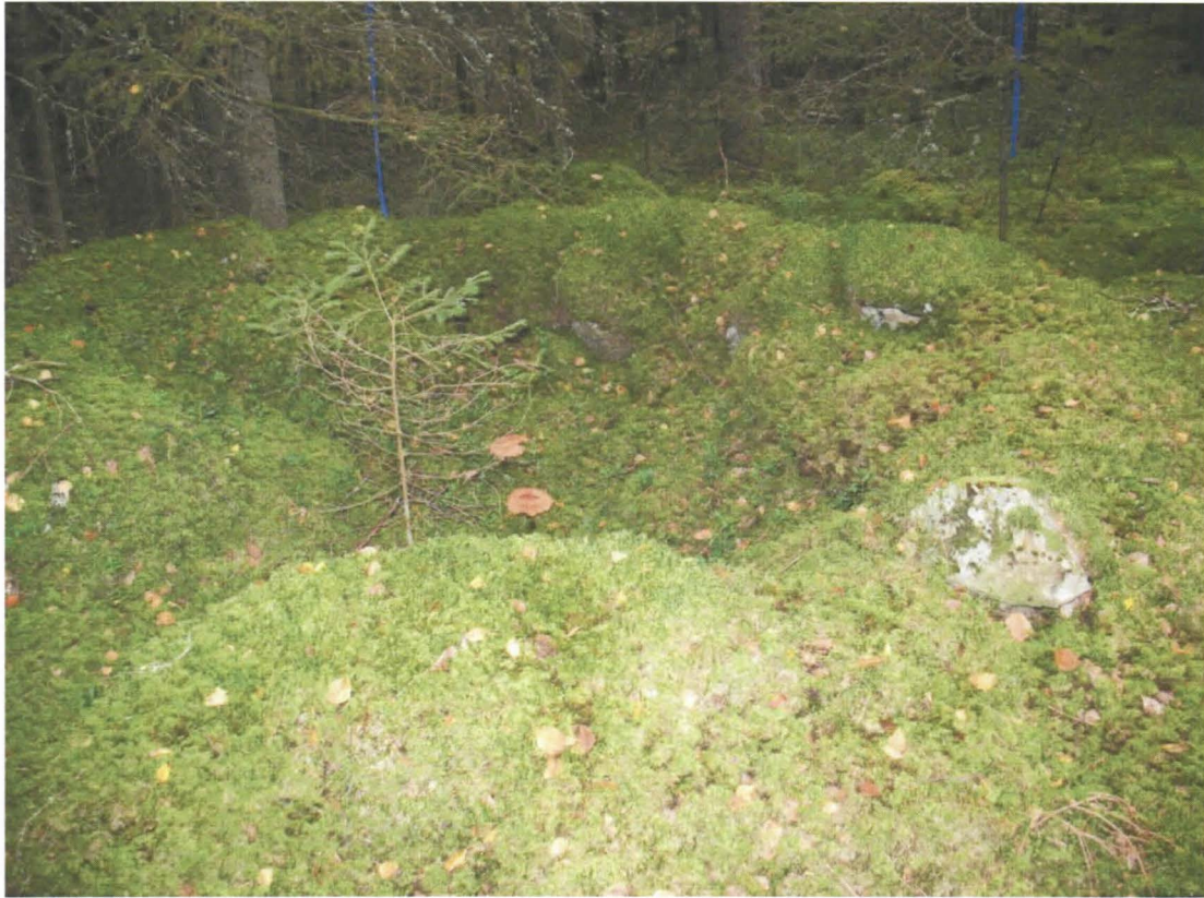
Kuva 5. Pienempi, sammaloitunut rakennuksen perustus.