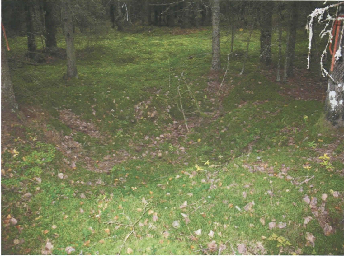
Kuva 1. Sammaloitunut rakennuksen perustus, joka hakkuita varten merkittiin kuitunauhoin.