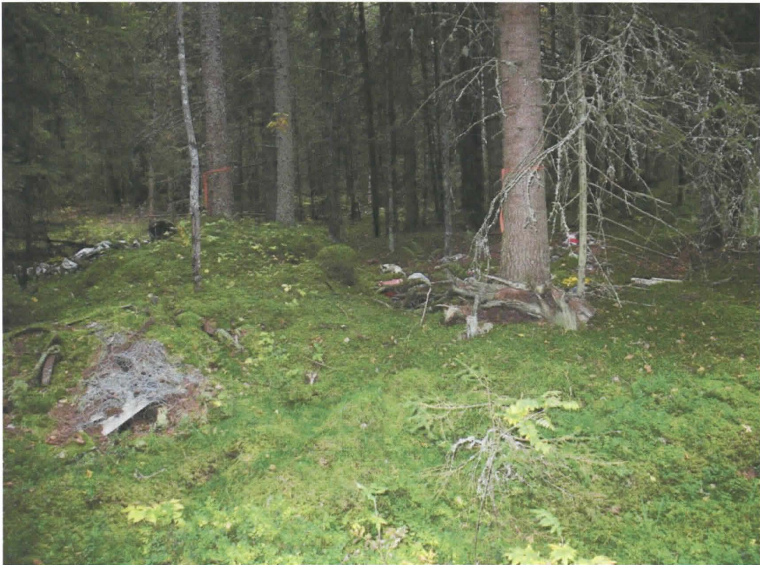
Kuva 4. Sama kuin edellä.