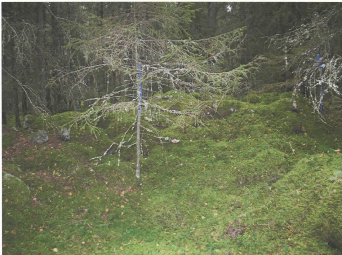
Kuva 6. Epämääräinen, suurehko röykkiö, jonka tarkoitus ei ole tiedossa. Röykkiön keskellä on syvennys.