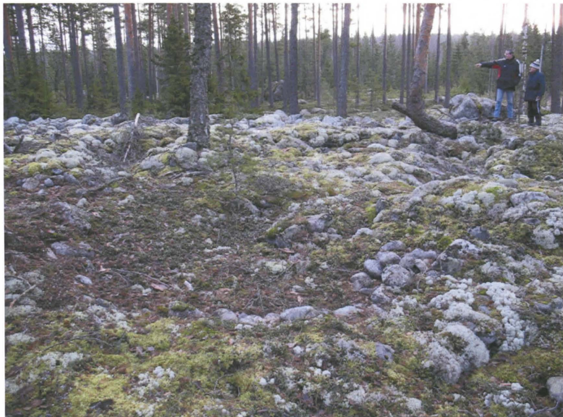
Kuva 2. Etualalla kivistä raivattu alue, mahdollinen kodanpohja?