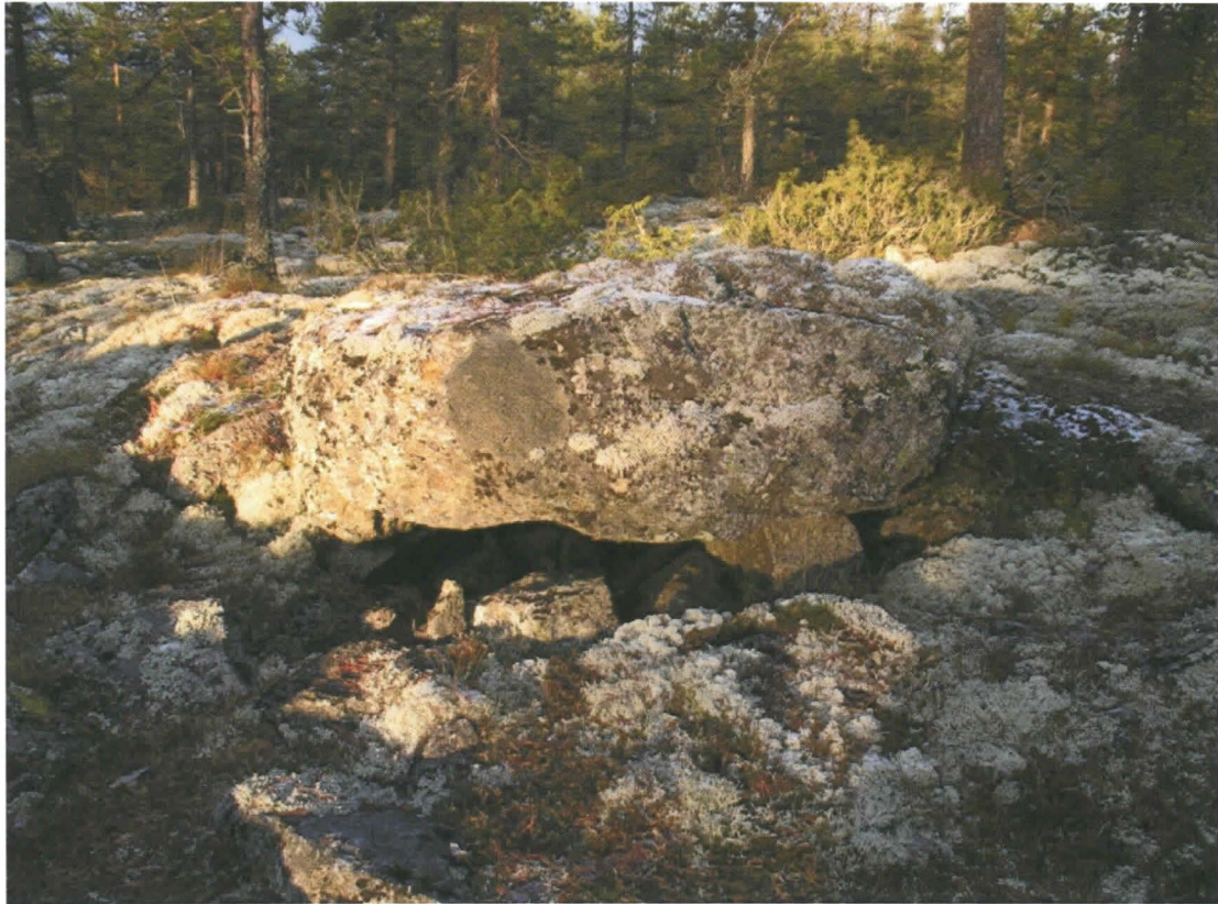
Kuva 7. Pyöreähkö kivipaasi, joka on selvästi ihmisen toimesta nostettu pienempien kivien varaan.