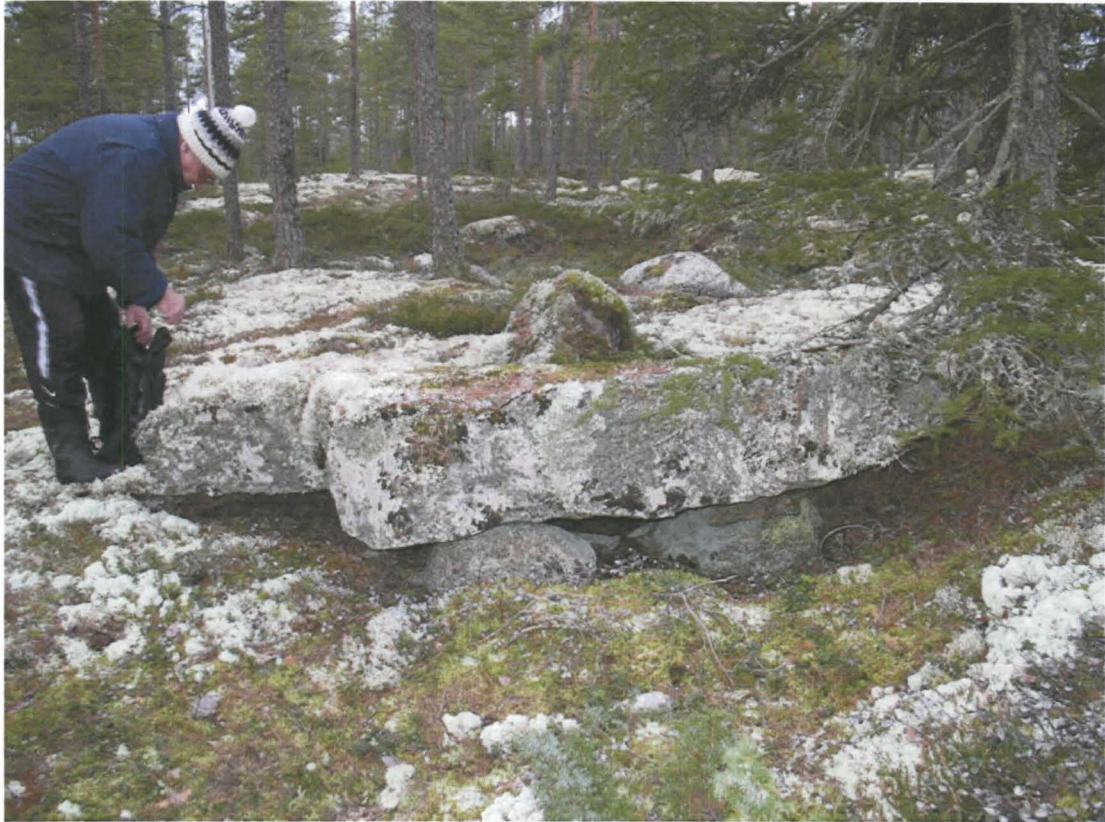
Kuva 5. Kivipaasi, joka on nostettu kolmen ”jalan” päälle. Kuvassa Torsten Rabb.