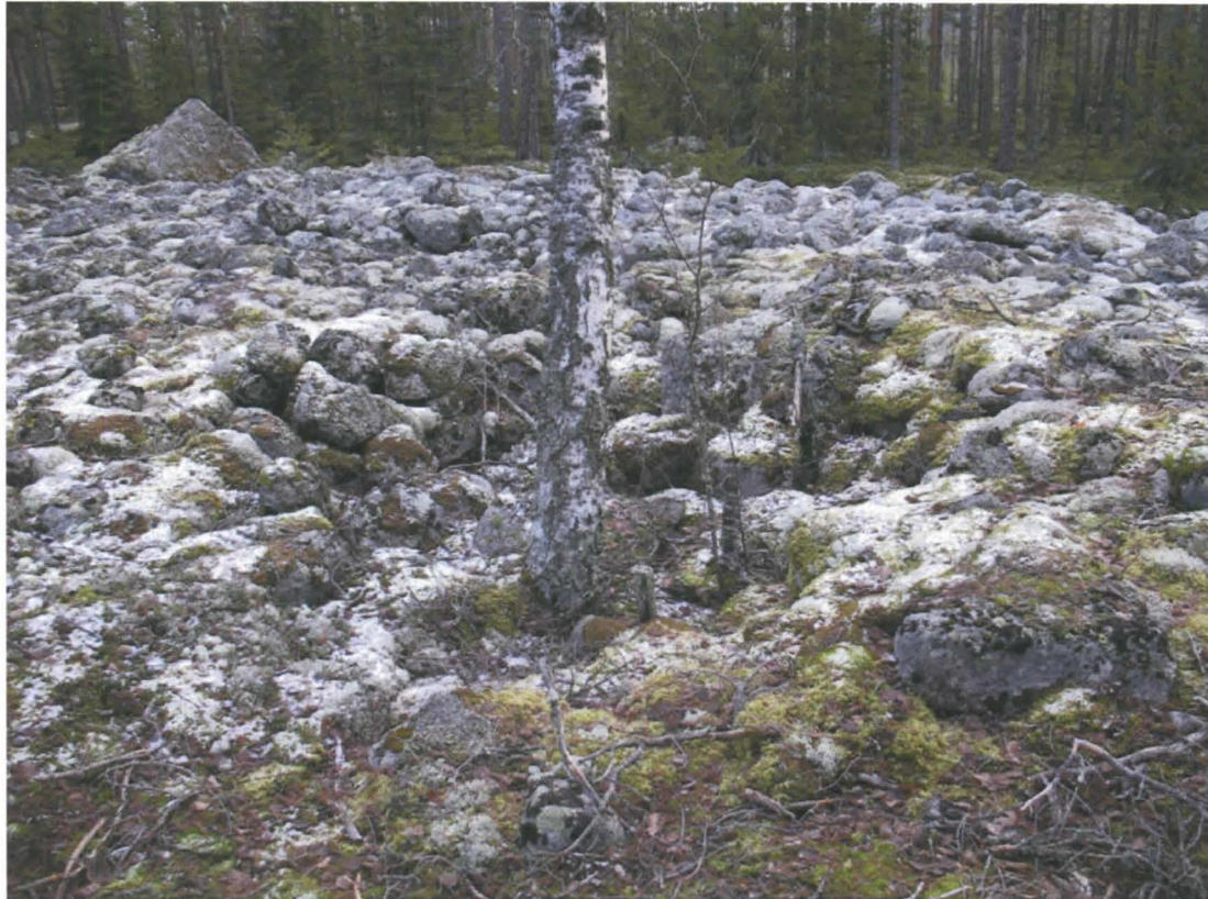
Kuva 1. Pirunpelto, jossa on ihmisen tekemiä kuopanteita.