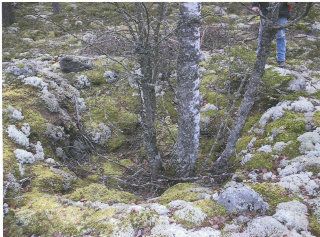
Kuva 4. Sama kuopanne kuin kuvassa 3.