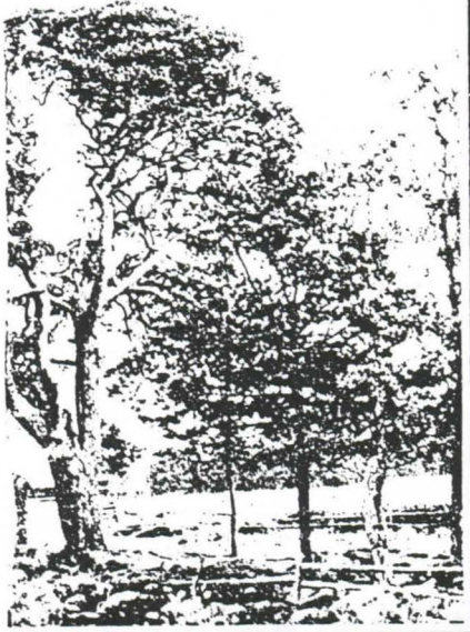
Vähäsarjan petäjävanhus, josta kerrotaan monta isoonvihaan liittyvää tarinaa.

kuormia tervaa, potaskaa, kapahaukia, nahkoja, liha-, hillo ja puolukkasaa-veja. Talvisin hevospelleillä turkiksia, lintuja ja käsitöitä poikkimaisin myös Raahen porvareille.