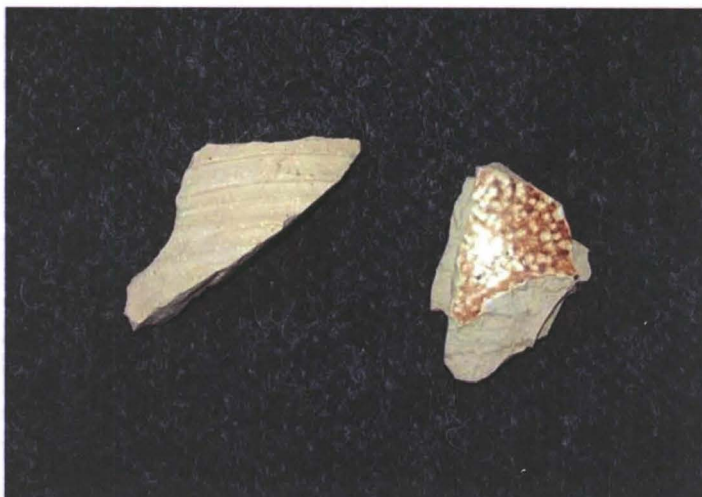
Kuva 2. 1300-luvun Siegburg- kannun pala ja 1500- luvulle ajoitettava parta- miehen kannun pala löytöpaikalta 2. KM 2006098:1 ja 2.