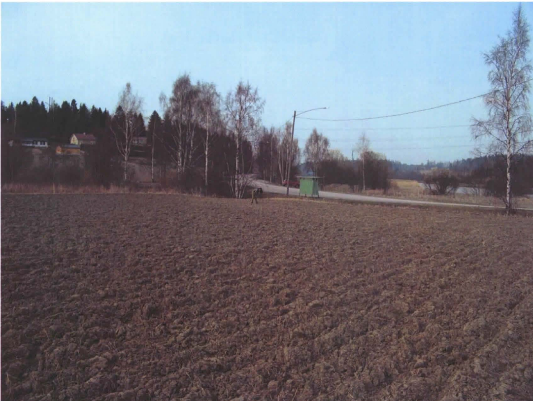
Kuva 5. Löytöpaikka 3, kuva pohjoiseen. Porvoonjokeen laskeva puro virtaa pellon takana olevien koivujen luona.