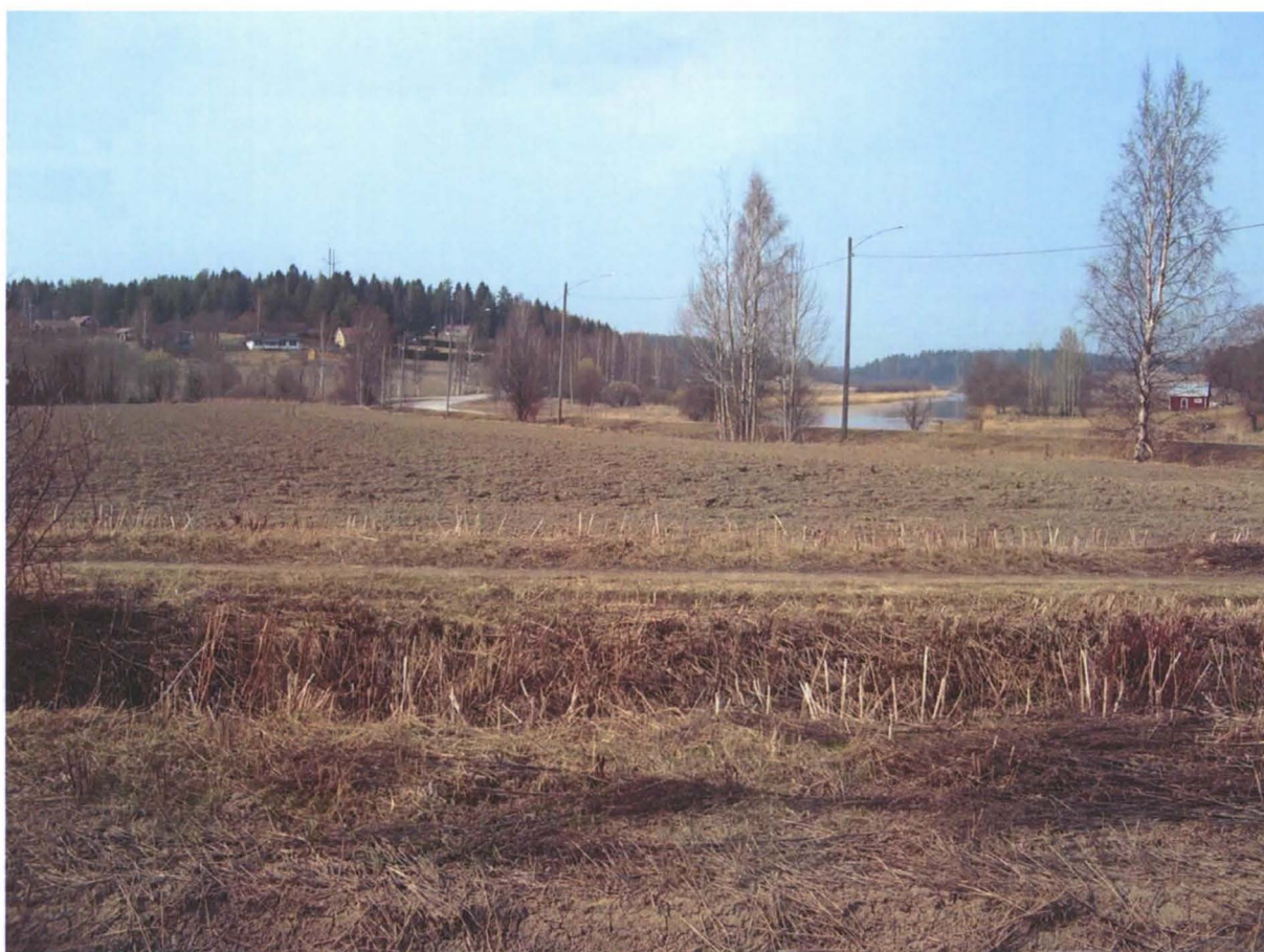
Kuva 3. Kuva on otettu löytöpaikalta 2 luoteeseen. Vastapäätä näkyy Blåkullan mäki ja Krogarsin talo. Kuva M. Niukkanen