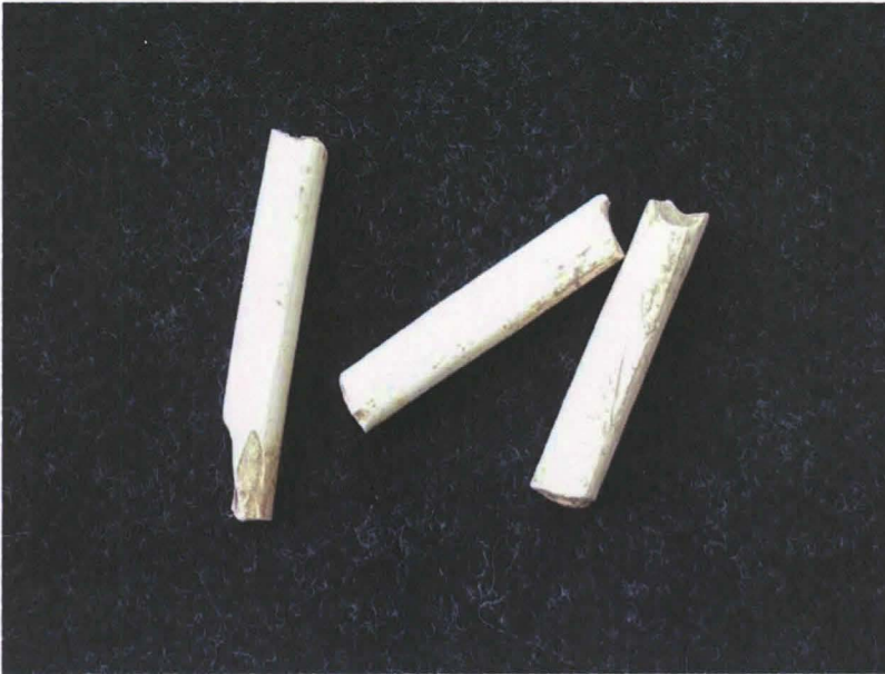
Kuva 4. Kolme liitupiipun varren katkelmaa löytöpaikalta 3.

Veli-Pekka Suhosen inventointikertomuksen (2003) mukaan markkinapaikan on arveltu sijainneen paikassa, jossa puro laskee Porvoonjokeen ja joki tekee mutkan. Puron varresta Saksalaan johtavan tienhaaran eteläpuolelta löytyi kolme koristelematonta liitupiipun varren pätkää (kuvat 4 ja 5), muttei muita markkinapaikkaa mahdollisesti indikoivia löytöjä. Piipunvarsia ei talletettu. Pelto on ko. kohdalla melko alavaa, eikä kohde vaikuta erityisen sovelialta markkinapaikaksi. Löytöpaikka on merkitty karttaan 3 numerolla 3.