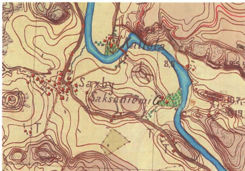
Porvoo Saksala senaatin kartassa vuonna 1873.