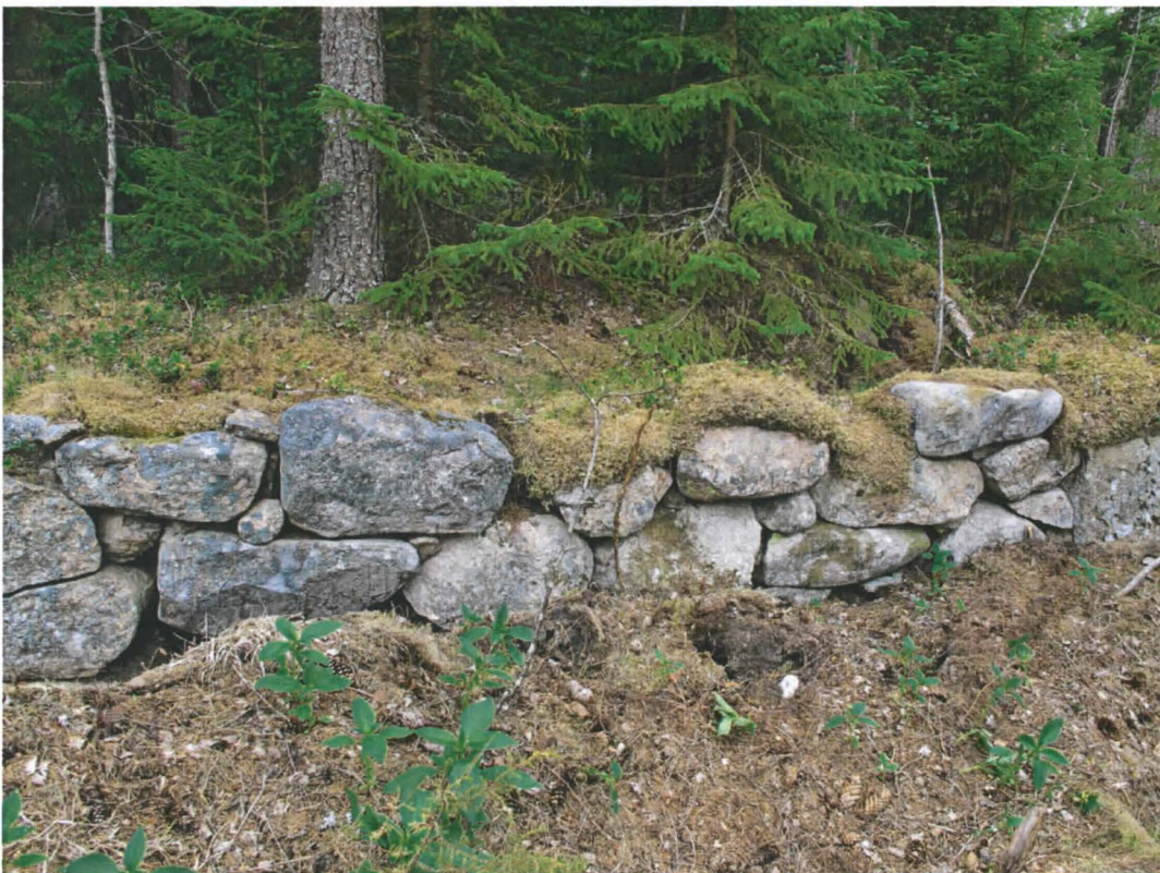
Kuva 2. Tuulenskaadon paljastamaa kiviaitamaista latomusta. Rakennelman länsireunaa, kuvattuna lännestä.