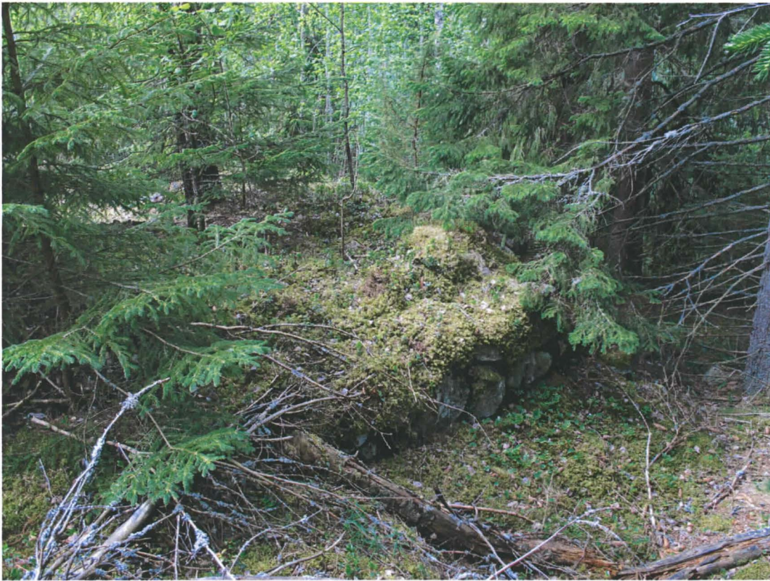
Kuva 3. Rakennelman "takaosaa" eli kaakkoispuolta.