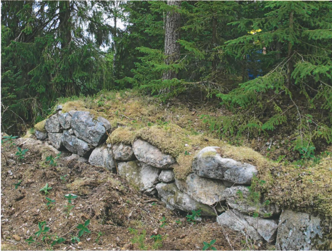
Kuva 1. Tuulenskaadon paljastamaa kiviaitamaista latomusta. Rakennelman länsireunaa, kuvattuna lounaasta.