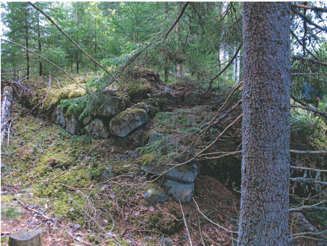
Kuva 4. Rakennelman koilliskulmaa, jossa kiviä on valahtanut kallionyppylän päältä.