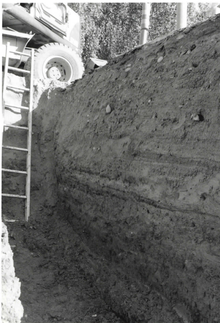
2. Kaarina Vanha Viipurintie. Kaivannon idän puoleinen seinämä KF2009:377