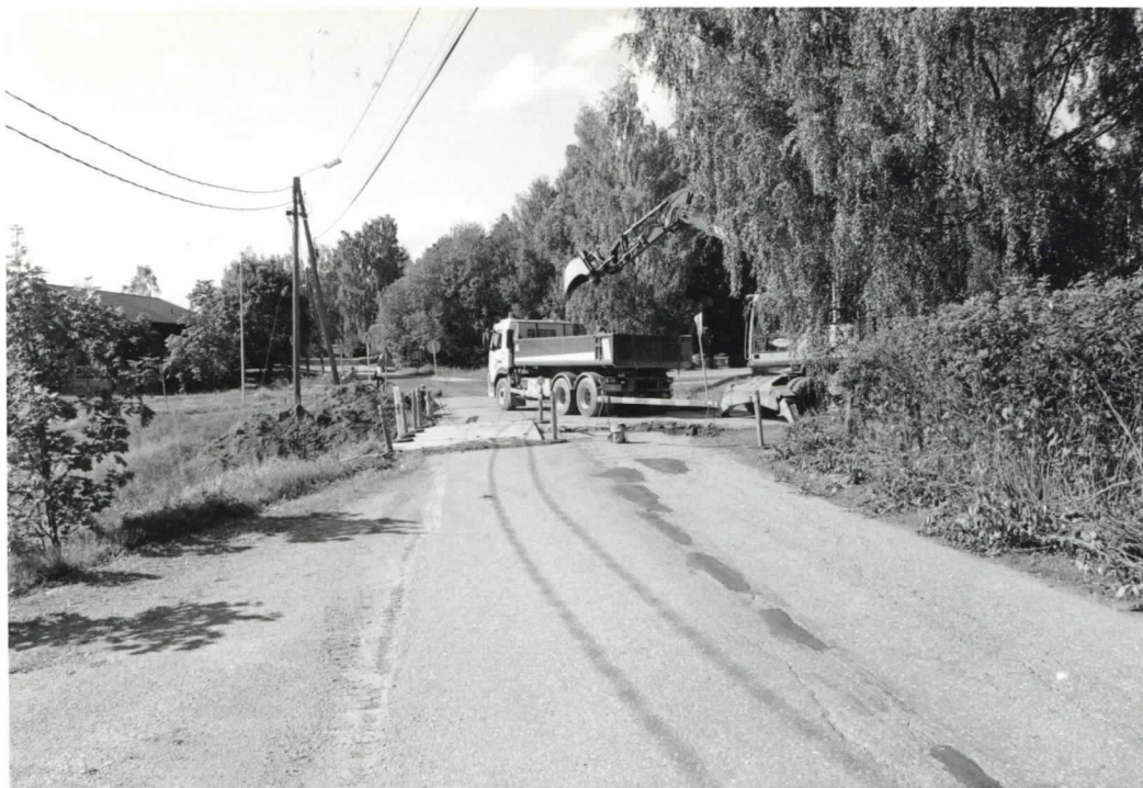
1. Kaarina Vanha Viipurintie. Yleisnäkymä kuvattu idästä. Valok. H. Brusila KF2009:378