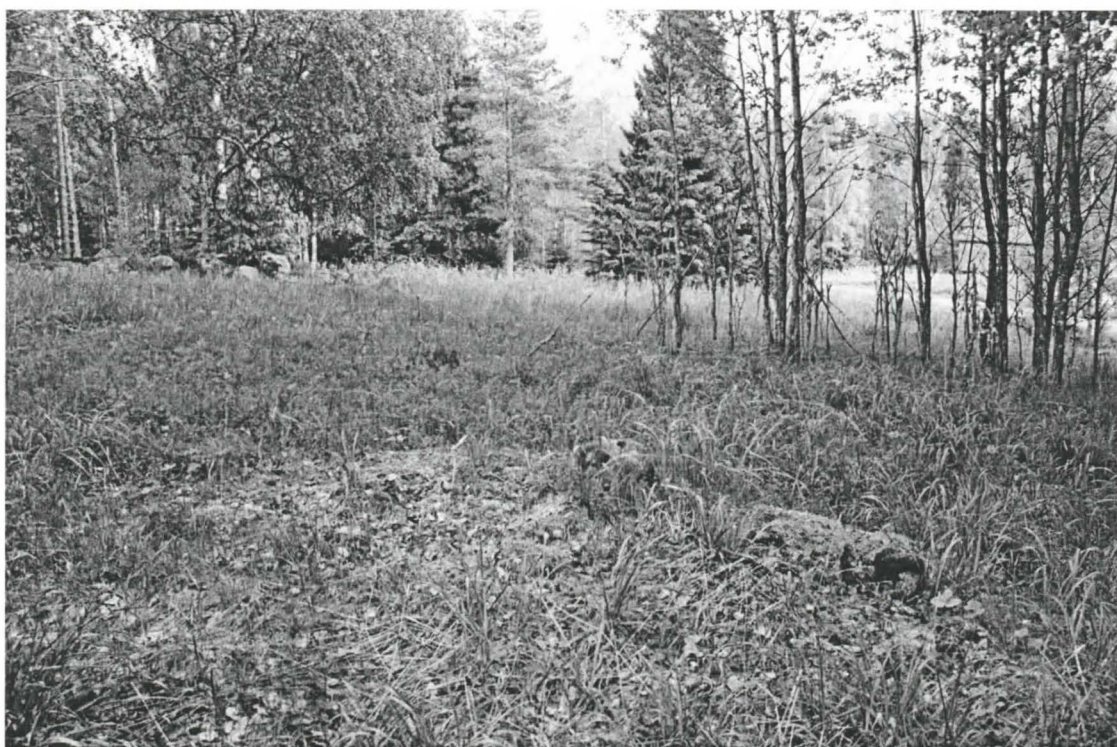
Metsäpelto, kiviröykkiö kalliokedolla. W-E. (f. 141956).