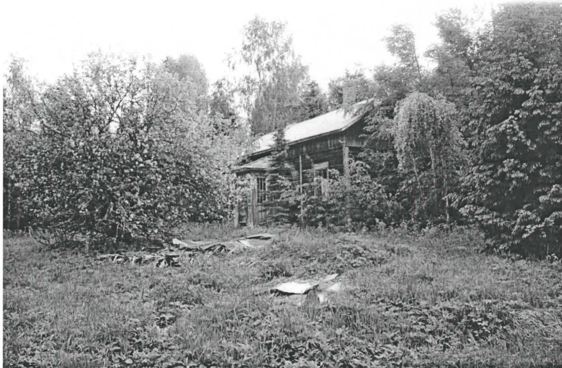
Metsäpelto, autiotalo (f. 141957).