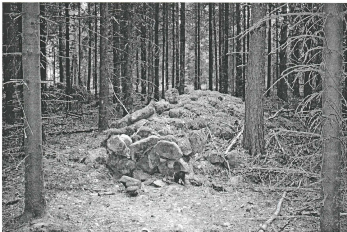
Yksi kuusimetsässä olevista röykkiöistä. E-W. (f. 141955). Kuvannut Petro Pesonen 2006.