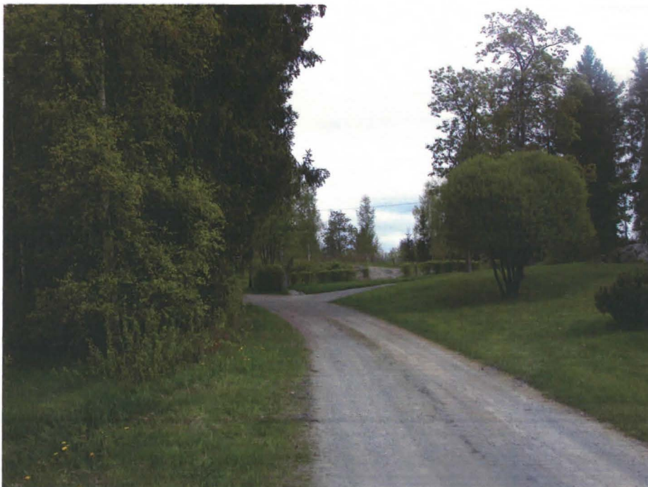
Kangasala, Haviseva. Näkymä Antilan talon suuntaan vanhan kylänpaikan alueella.