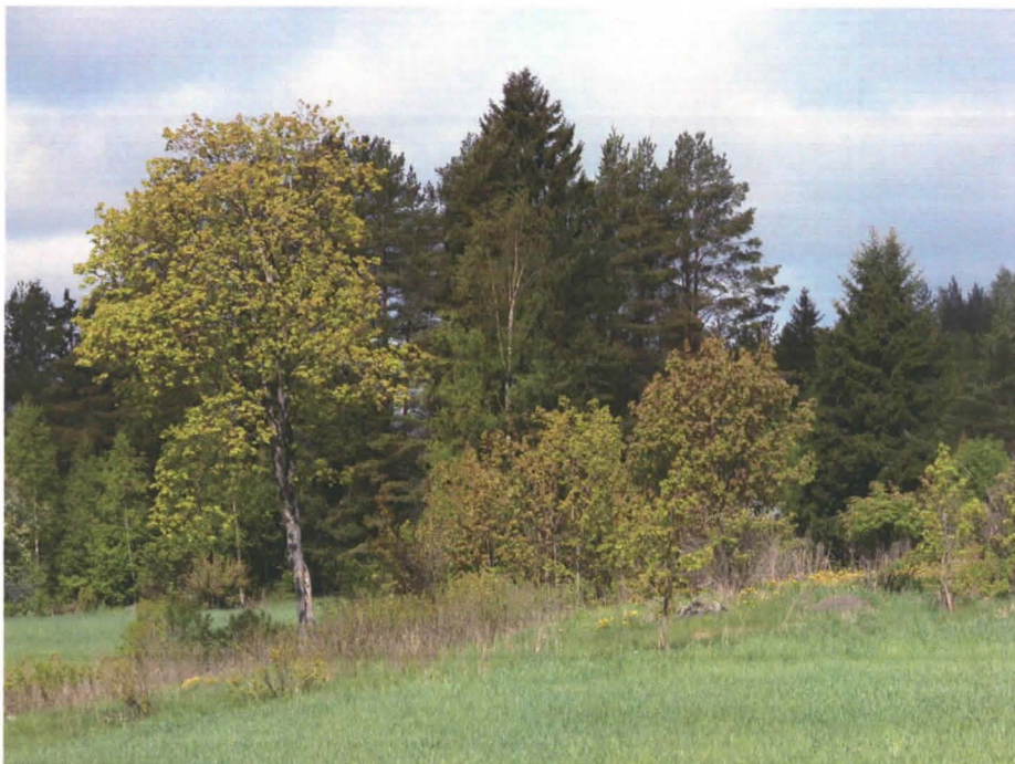
Kangasala, Haviseva. Historiallisen ajan kyläpaikan maanpäälle erottuvia jälkiä Antilan talon lounaispuolella peltosaarekkeessa. Kuvattu kaakosta.