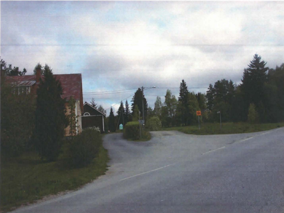
Kangasala, Haviseva. Siitaman tien pohjoispuolella olevaa kylänpaikkaa nykyisten rakennusten ja teiden alla.