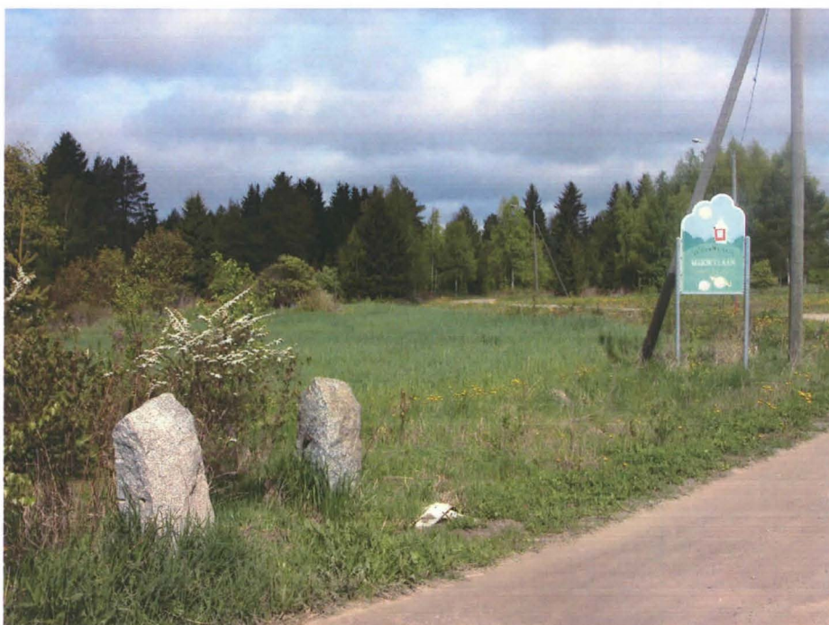
Kangasala, Haviseva. Kivipylväät (portti?) vanhan kylänpaikan alueella. Tonttimaa on jatkunut takana näkyvälle pellolle ja metsäsaarekkeelle.