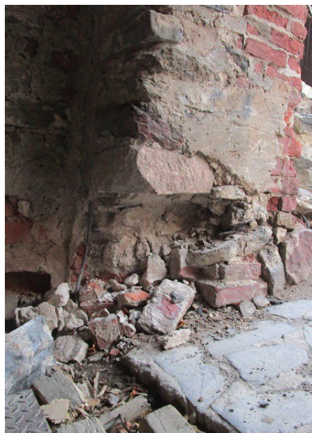
KUVAT 2 ja 3. Tilanne ennen korjausta.