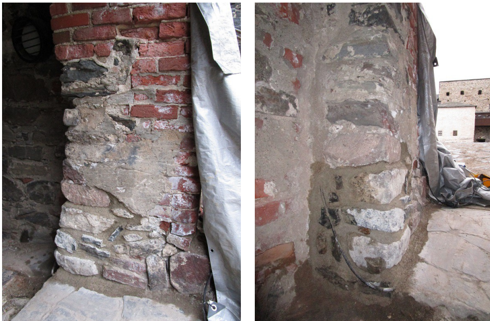
KUVAT 4 ja 5. Valmis portinpieli muuraustöiden jälkeen.

Korjaus aloitettiin siivoamalla irtoava aines pois ja puhdistamalla korjattava alue. Aukkoon valikoitiin sopivat luonnonkivet huonokuntoisten tilalle. Tiilet päätettiin myös korvata kestävämmillä luonnonkivillä, koska portinpielen alaosa on alttiina kolhuille ja maaperästä nousevalle kosteudelle. Muuraus toteutettiin Thorborg Von Konowin räätälöimällä hydraulisella kalkkilaastilla, joka on suunniteltu luonnonkiviosille. Rakenteen kohdalla kulkee sähköjohto, joka on luultavasti kulkenut rakenteen saumoissa. Nyt osa johtoa jäi paljaaksi, koska se oli liian jäykkä ja kireä yltääkseen kauttaaltaan saumoihin. (KUVAT 4 ja 5)