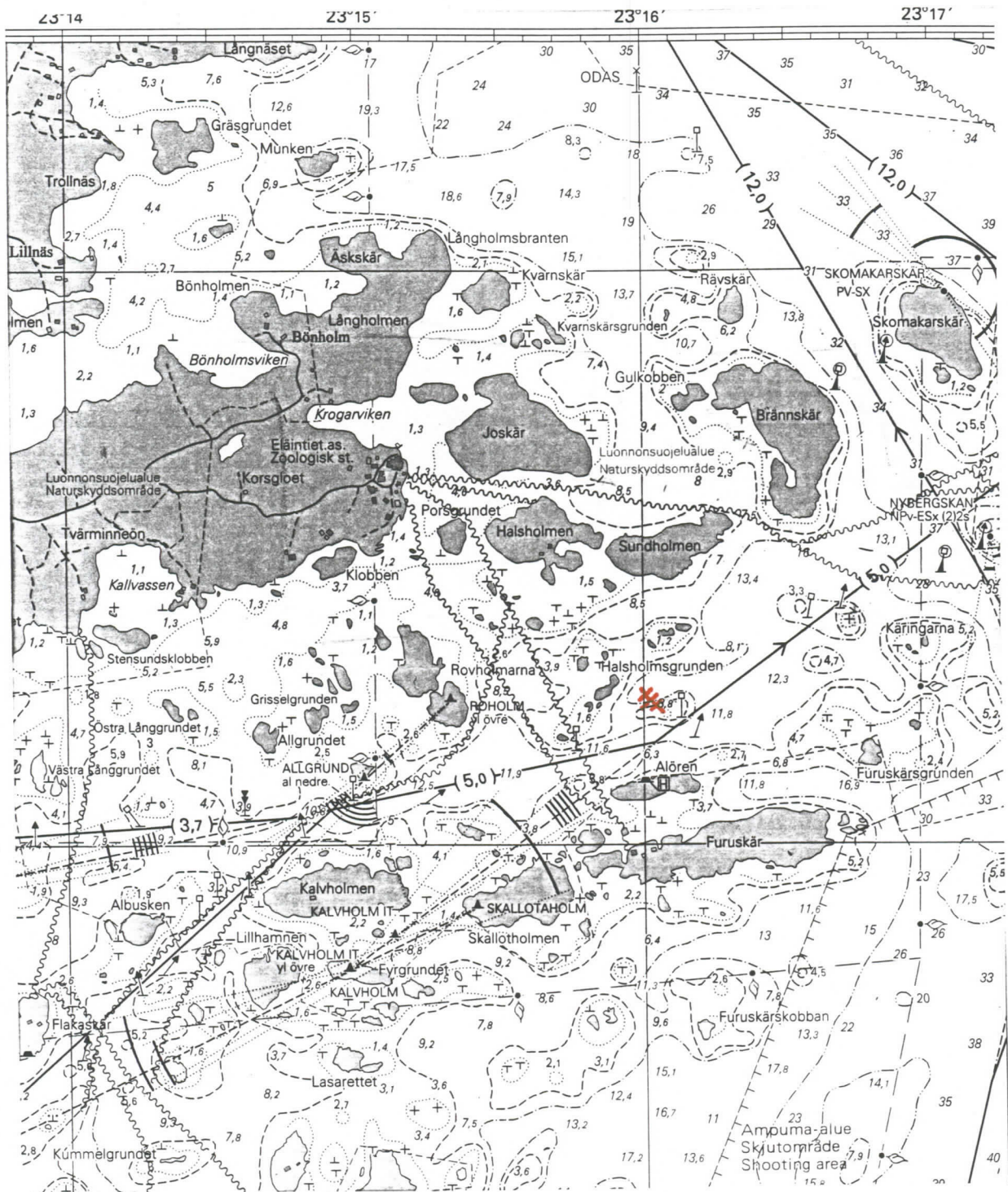
Båtsportkort Sjökortsserie B Jussarö - Pargas 1999 636 1:20000