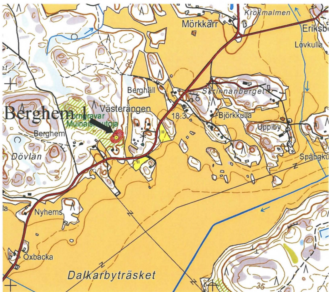
Yllä: Berghem 1: p = 6681742, i = 262539. Seuraavat alla: Volter Högmanin asemapiirroksia vuonna 1886 tutkittujen röykkiöitten pohjaosista.