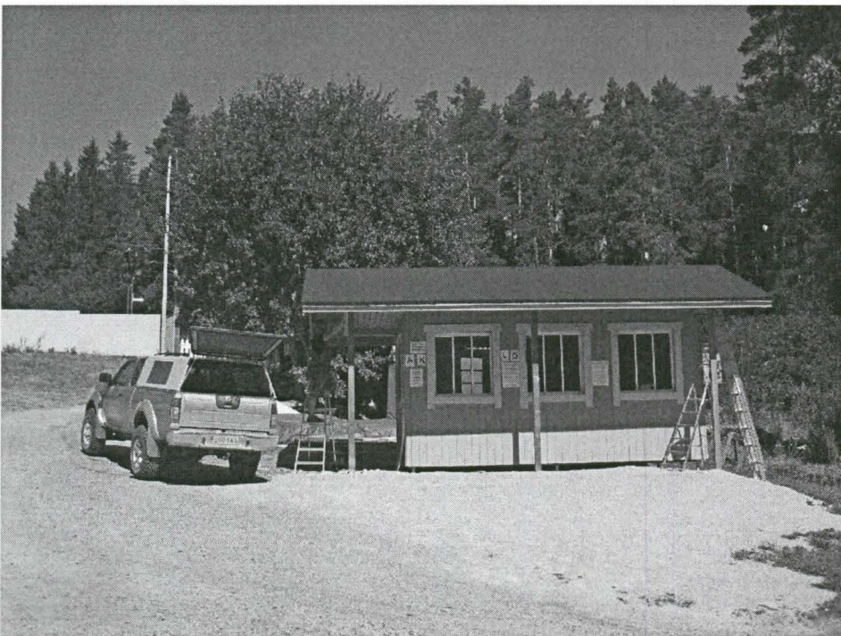
Kuva 6. Lipunmyyntirakennus valmiina. Edustalla paikalle tuotu sepeli- pintakerros. Kuvattu etelästä.