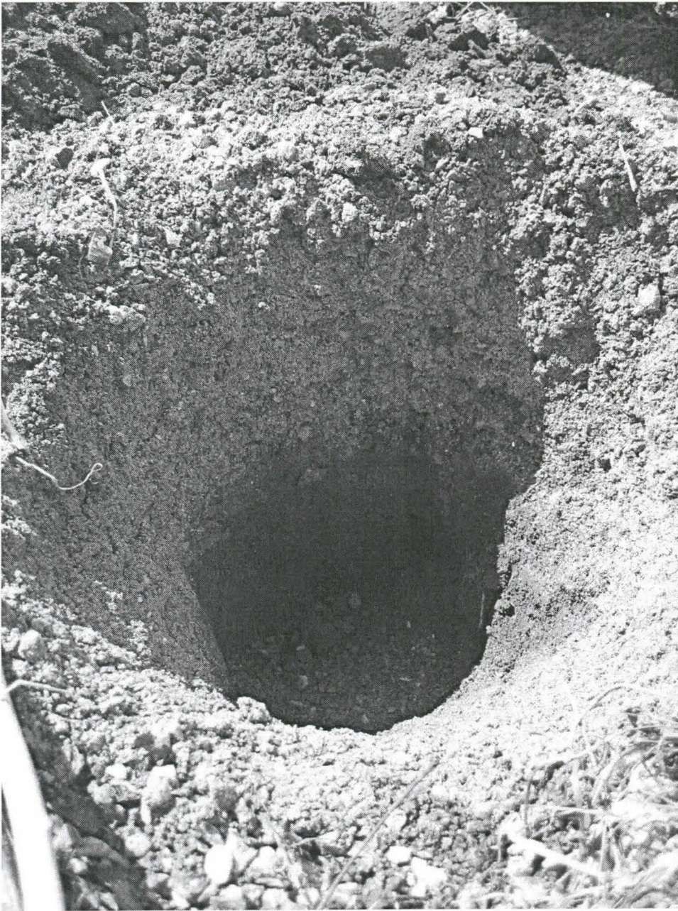
Kuva 4. Kuoppa 3. Kuvattu itäkaakosta.