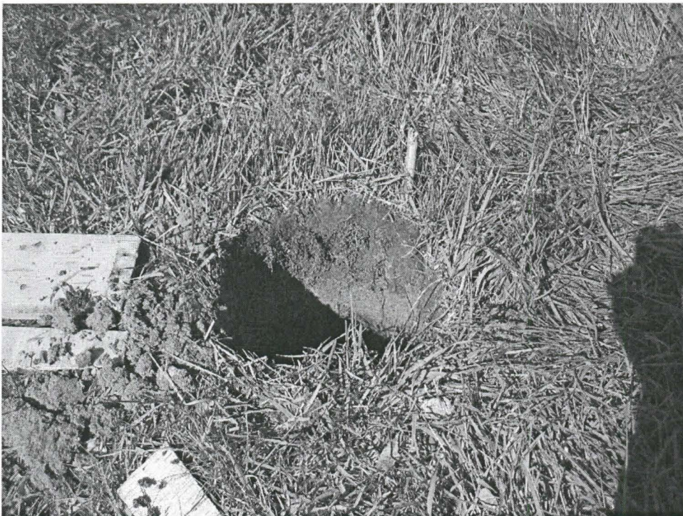
Kuva 2. Kuoppa 1. Kuvattu itäkaakosta.