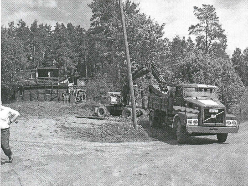
Kuva 1. Yleiskuva rakennusalueesta. Koneasemoinnit. Kuvattu lounaasta.