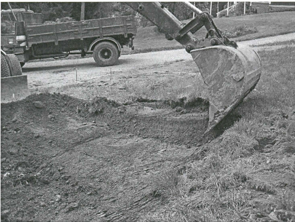
Kuva 2. Pintamaan poisto kerroksittain noin 20 cm kerroksissa. Kuvattu idästä.