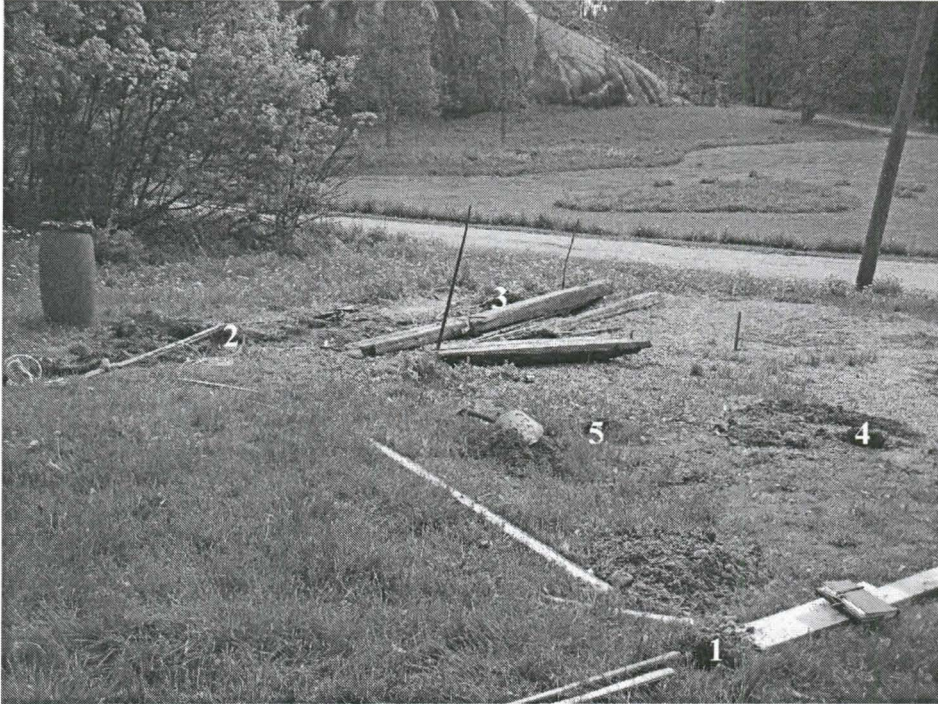
Kuva 1. Yleiskuva rakennettavasta alueesta. Koepistot numeroitu. Kuvattu luoteesta.