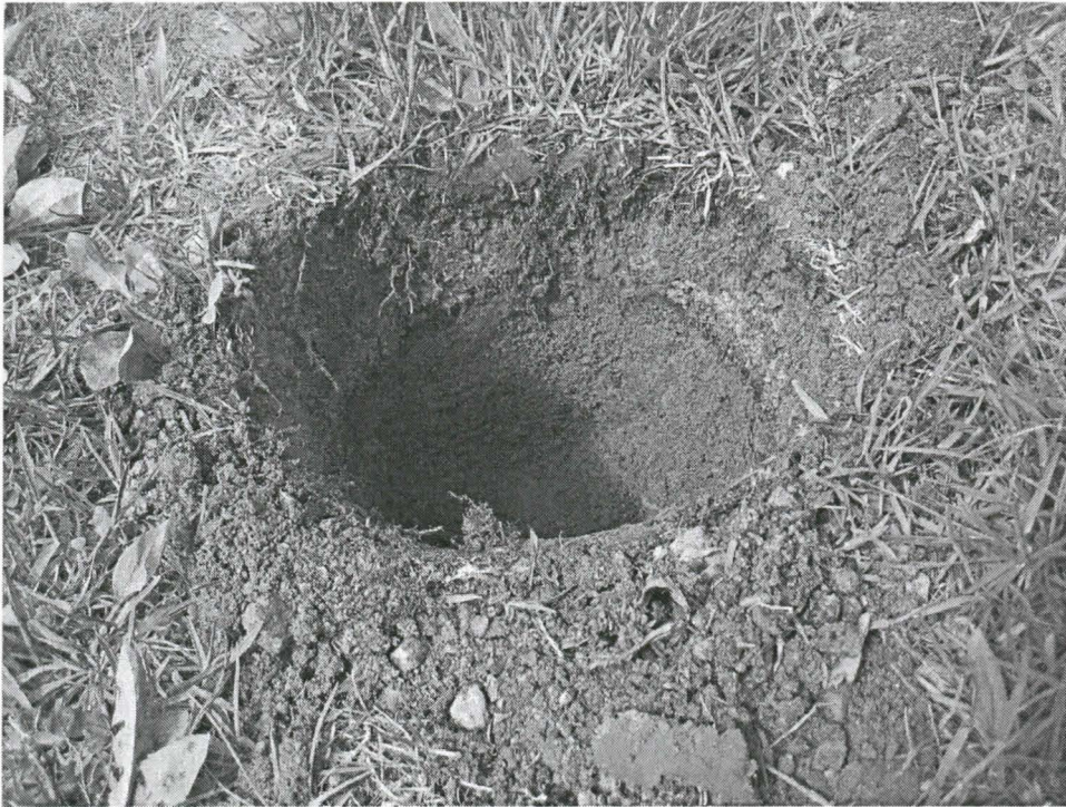
Kuva 6. Kuoppa 5. Kuvattu itäkaakosta.