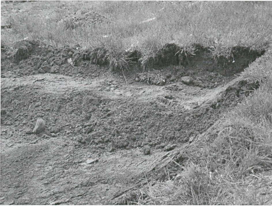
Kuva 5. Multavaa maa-ainesta rakennuspaikan kohdalla. Ilmeisesti paikalle tuotua täytymaata, jolla tasoitettu painannetta teatterin rakentamisen aikaan. Kuvattu itäkaakosta.