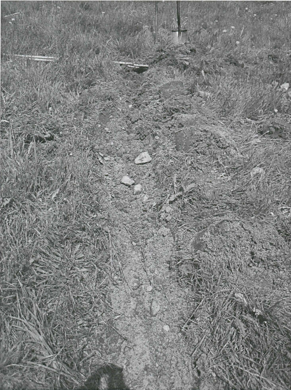
Kuva 3. Ennen koekaivua lapiolla tehty kaivu-ura. Kuvattu etelästä.