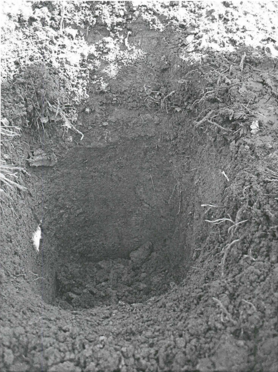
Kuva 3. Kuoppa 2 kuvattu itäkaakosta.