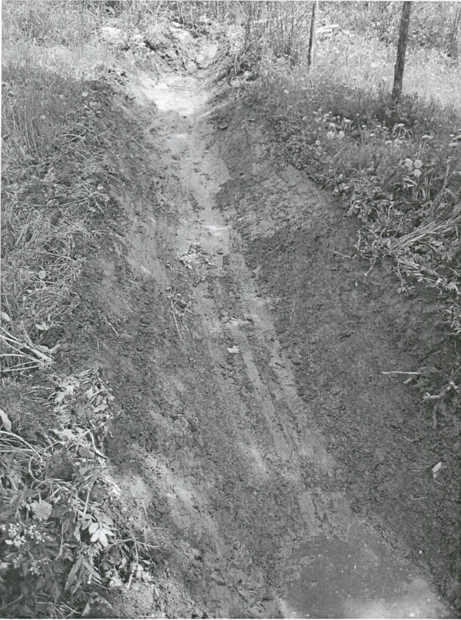
Kuva 4. Lapiouran kohdalle koneella kaivettu kuivatusoja. Puhdas savi, jonka päällä multava maa-aines. Multava maa-aines ilmeisesti ainakin osin ilmeisesti paikalle tuotua täytemaata, jolla tasoitettu painannetta teatterin rakentamisen aikaan. Kuvattu etelästä.