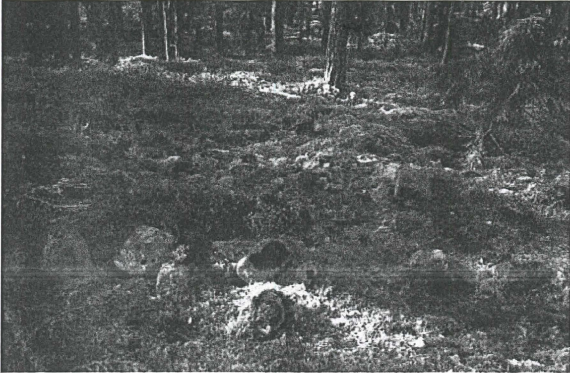
124423:1 Kivikon NW-osaa, kuoppia. NE