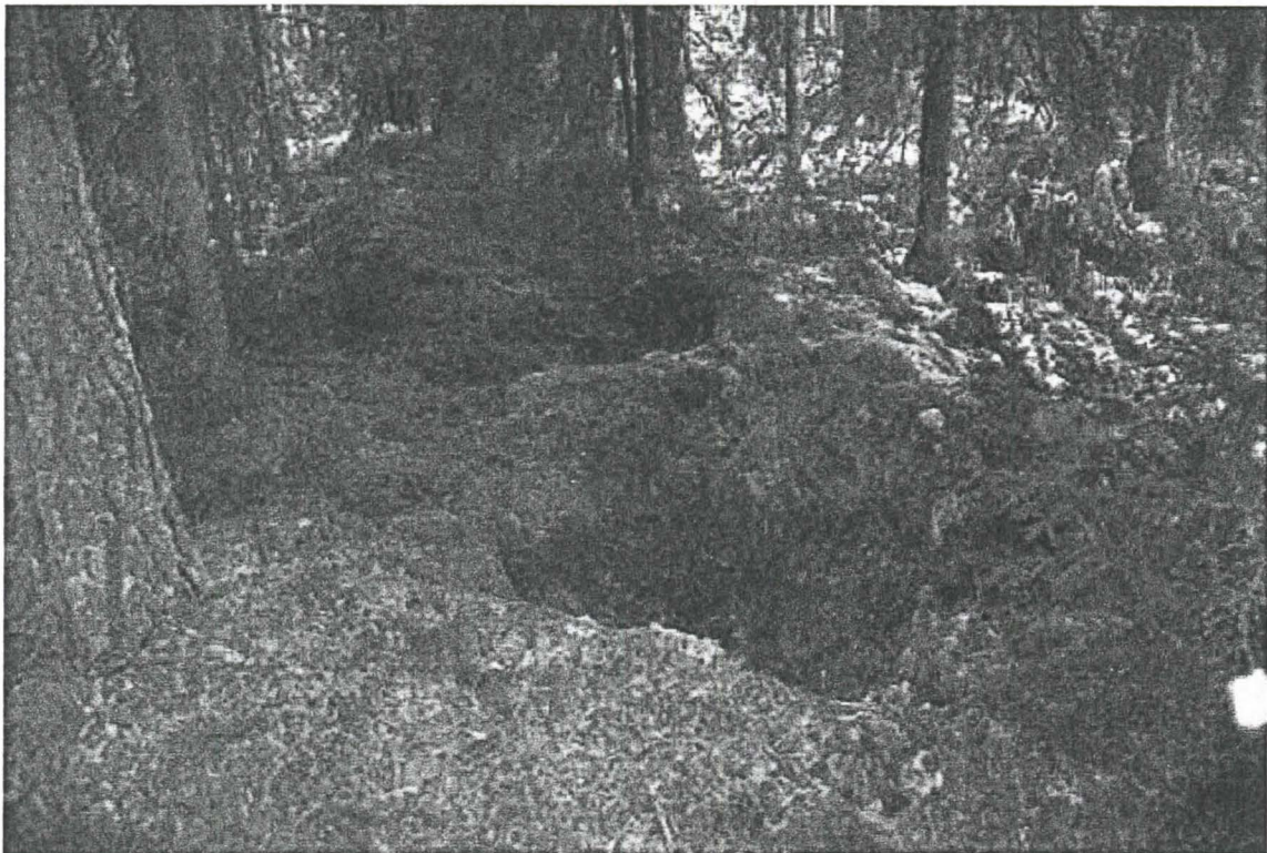
124423:2 Kaksi kuoppaa kivikon SE-osassa. Etualalla ”tutkittu” kuoppa. NNW