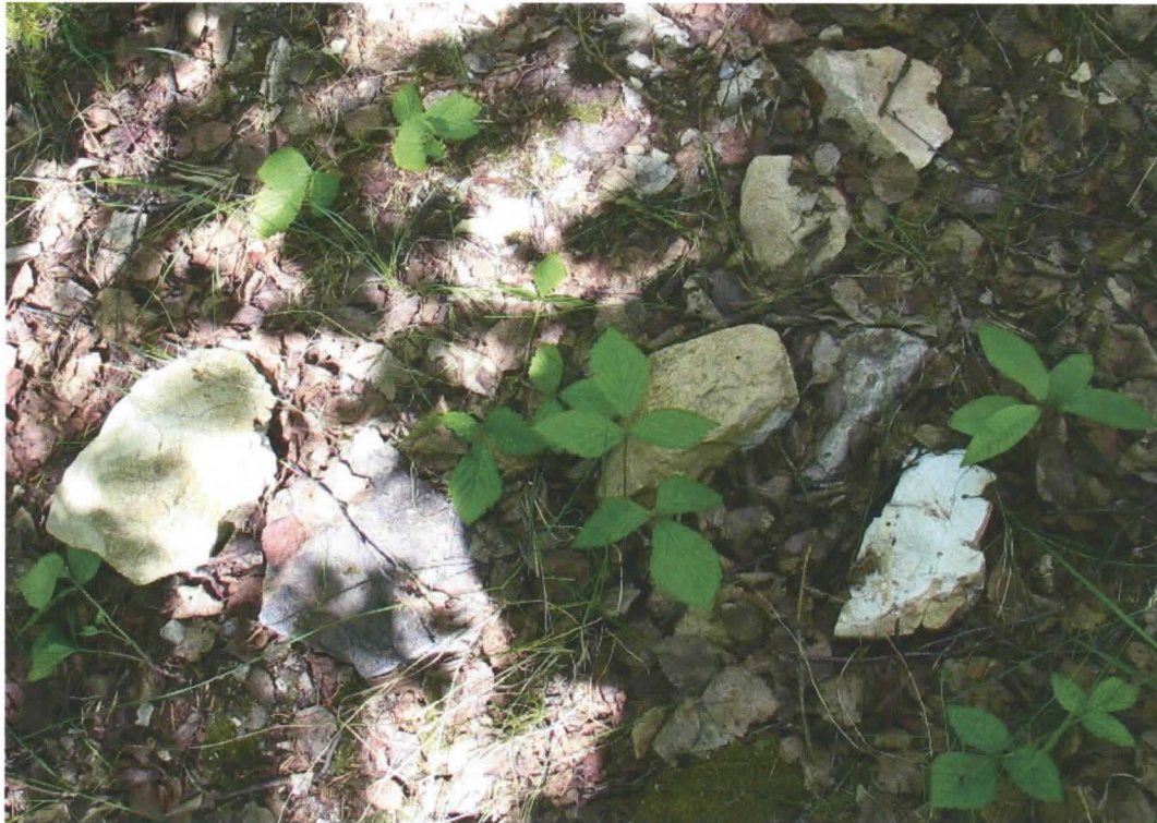
Kuva 3. Kalkkikiven kappaleita uunin päällä (Kuva: Maria Suvanto/Lapin tiepiiri).