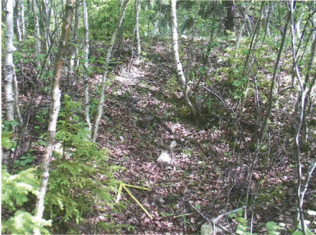
Kuva 1. Kemi Siikalampi. Kalkkiuuni uunin sisäpuolelta kuvattuna (Kuva: Maria Suvanto/Lapin tiepiiri).