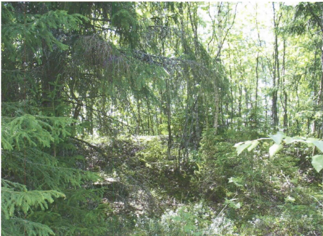
Kuva 2. Kemi Siikalampi. Kalkkiuunin valli, kuvattu etelästä.