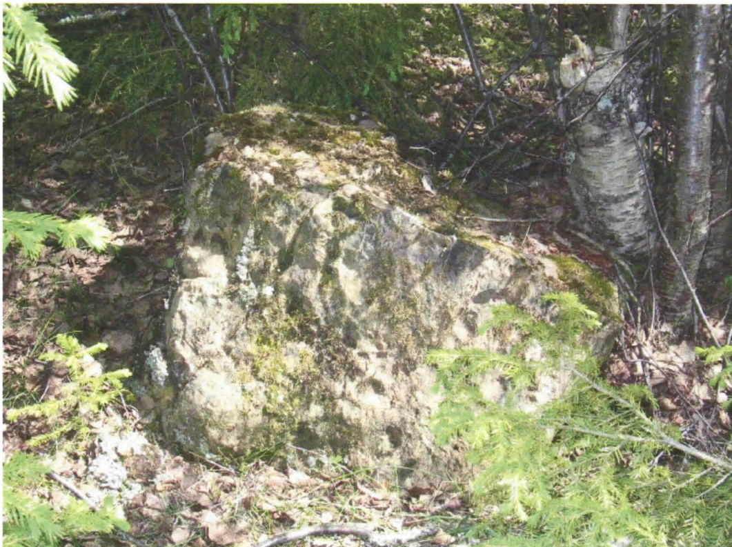
Kuva 4. Isompi kivi uunin sisäpuolella (Kuva: Maria Suvanto/Lapin tiepiiri).