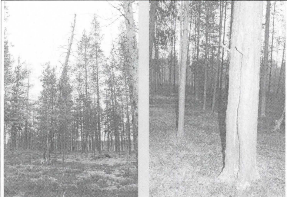
Kuva 3. Kuviokelon kallistuskulma.