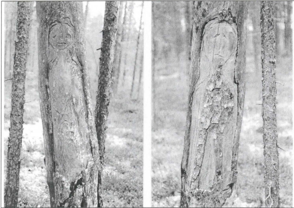
Kuva 1. Naiskuvio kelossa.