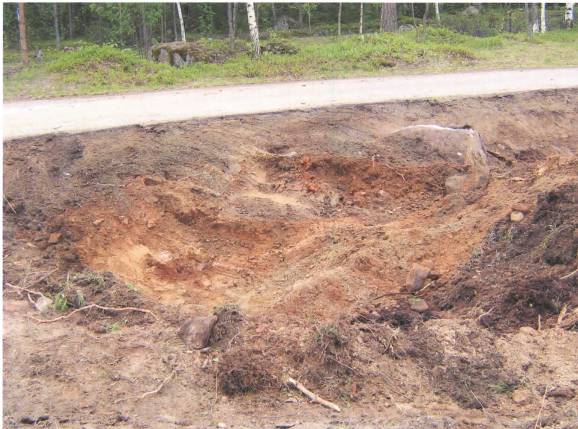
Kuva 4: Tiilimiilun jäänteitä, lähikuva. NE. KyMM/M. Kykyri.