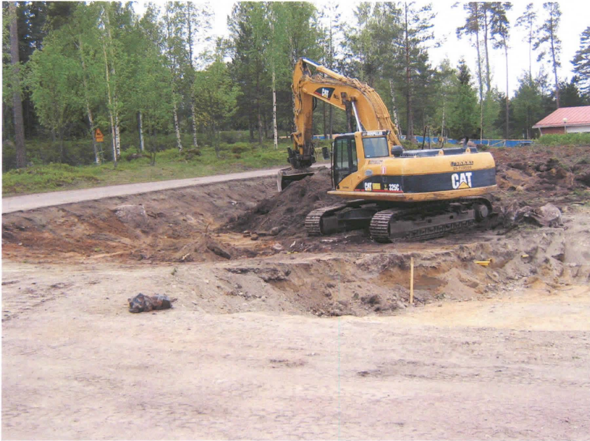
Kuva 3: Tiilimiilun jäänteitä paljastetaan kaivinkoneella.