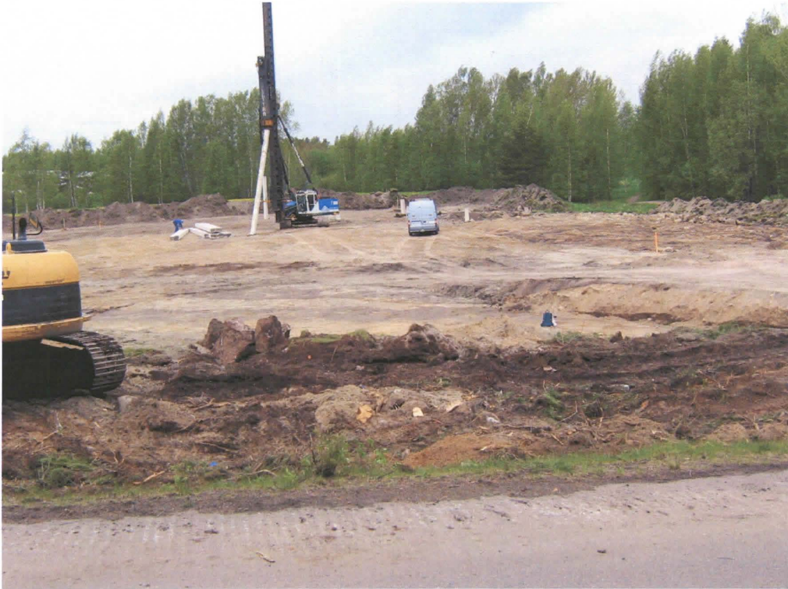
Kuva 1: Koulutontin paalutusta ja maakaivua. Tiilimiilun paikka suoraan kuva-alan edustalla kevyen liikenteen väylän reunustalla kaivinkoneesta oikealle.