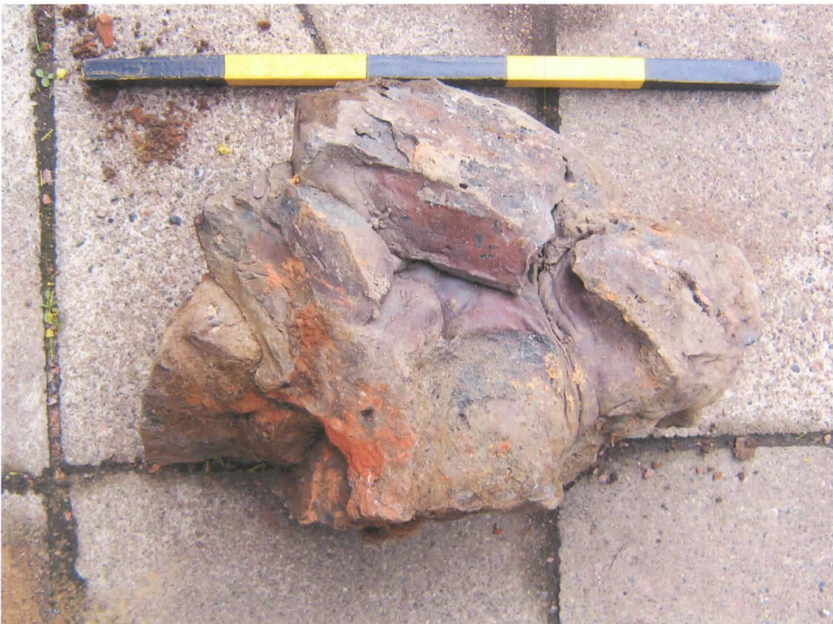
Kuva 6: Deformoitunutta tiilimassaa.