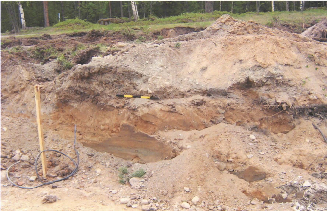
Kuva 2: Tiilijätehorisonttia pohjahiesun päällä. Taustalla Rajamäentie.