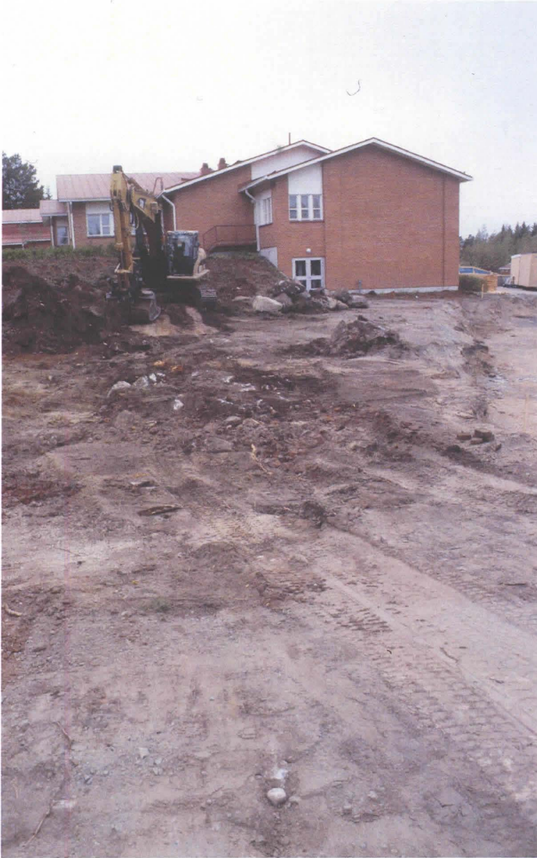
.Kuva 7: Keskellä täyttömaan alta paljastunutta kivitasoa. E. KyMMM/M. Kykyri.