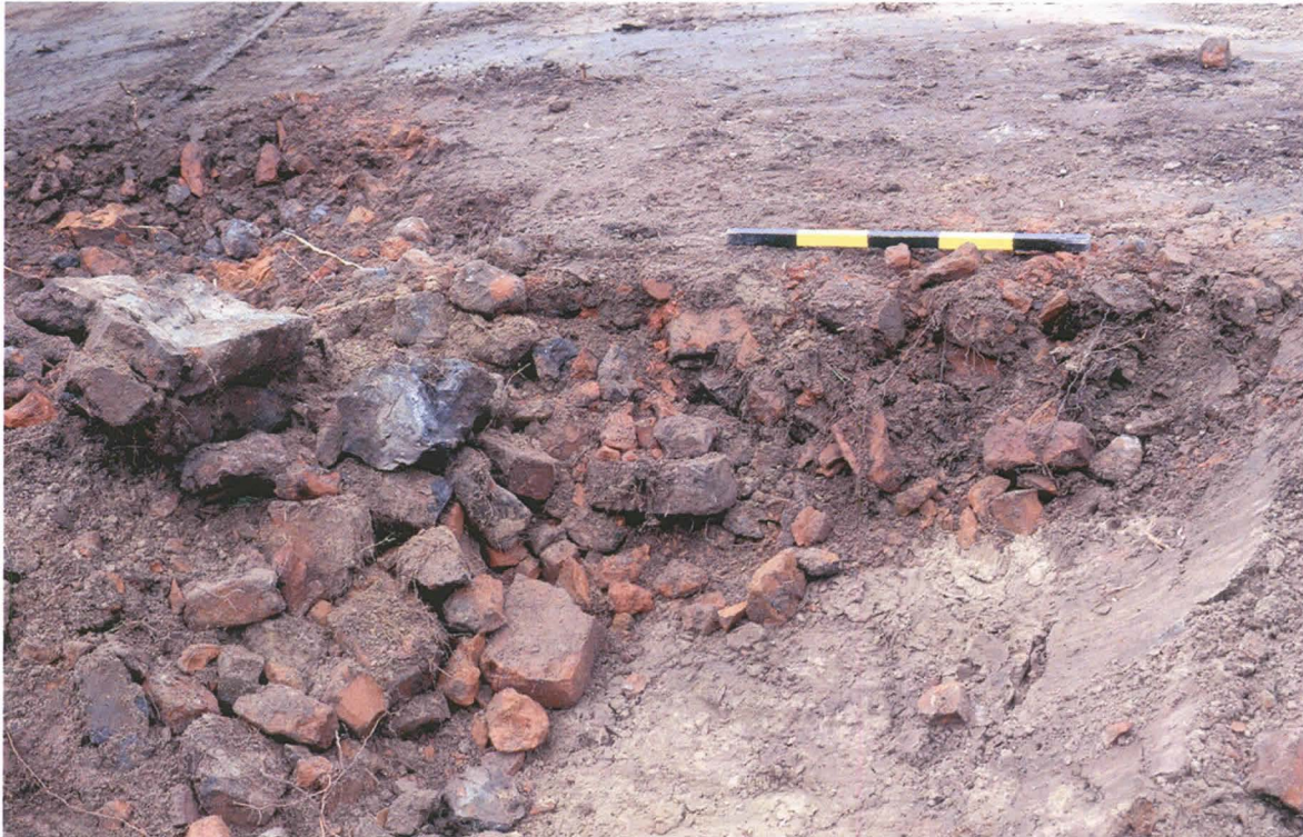
Kuva 5: Lähikuva tiilimiilun pohjasta.