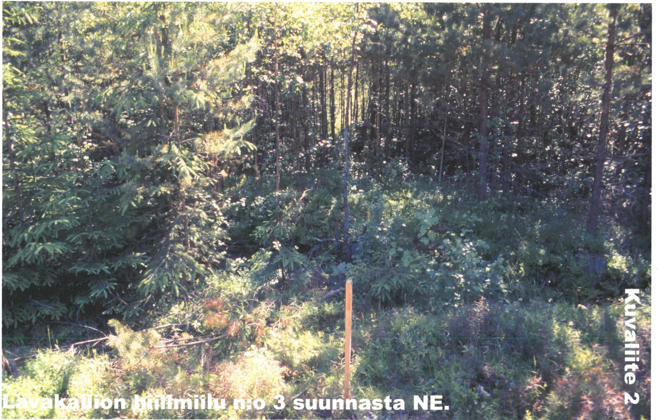
Lavakallion hiiltmiilu n:o 3 suunnasta NE.