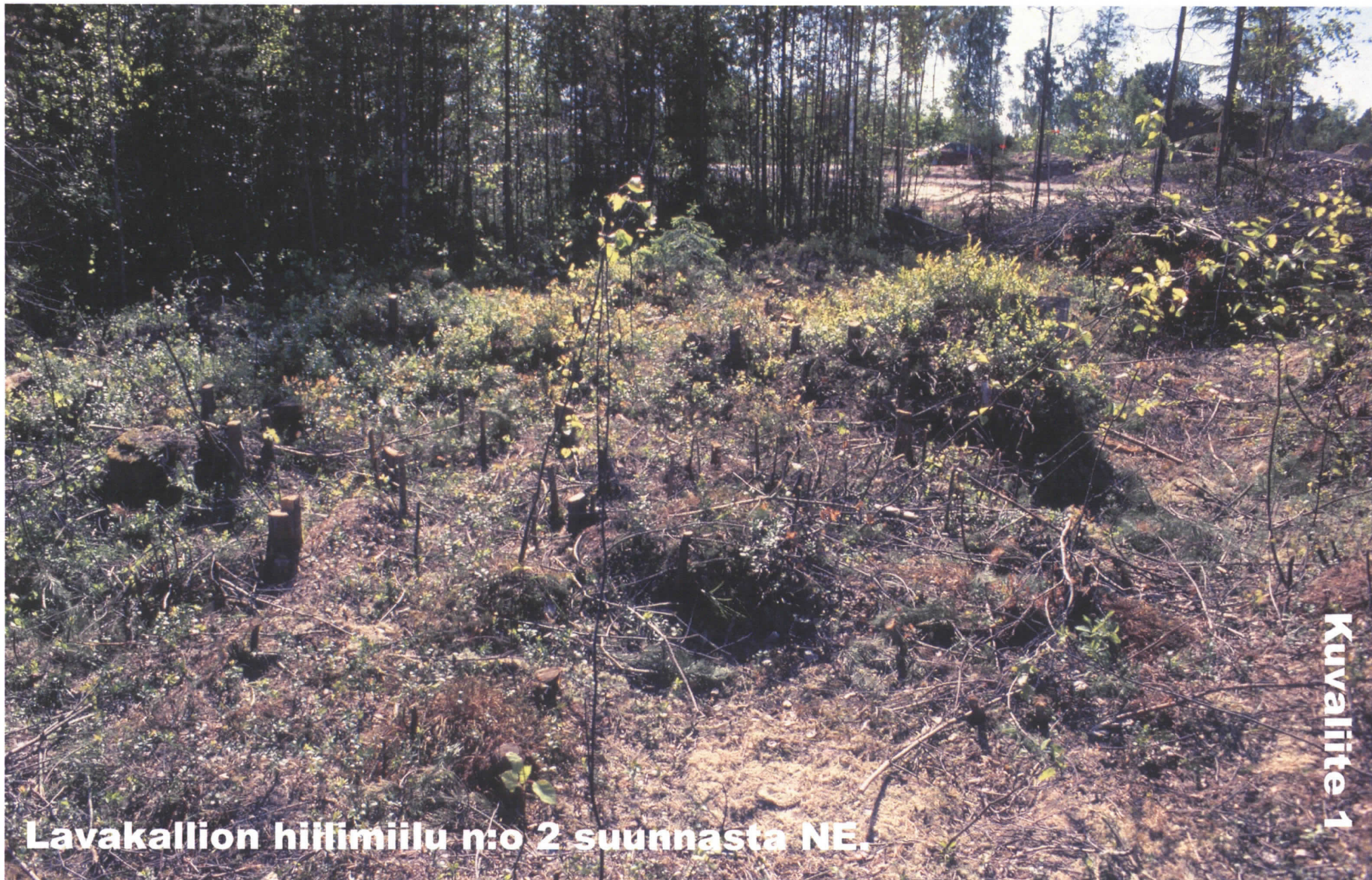
Lavakallion hiilimiilu n:o 2 suunnasta NE.