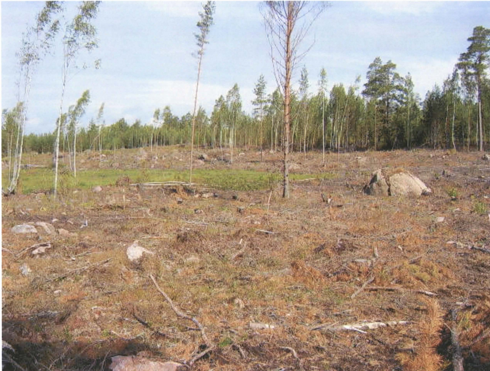
Kuva 1: Mussalon Takakylän Rajakalliontien eteläpuolista miilumaastoa. S. KyM/M. Kykyri 2007.