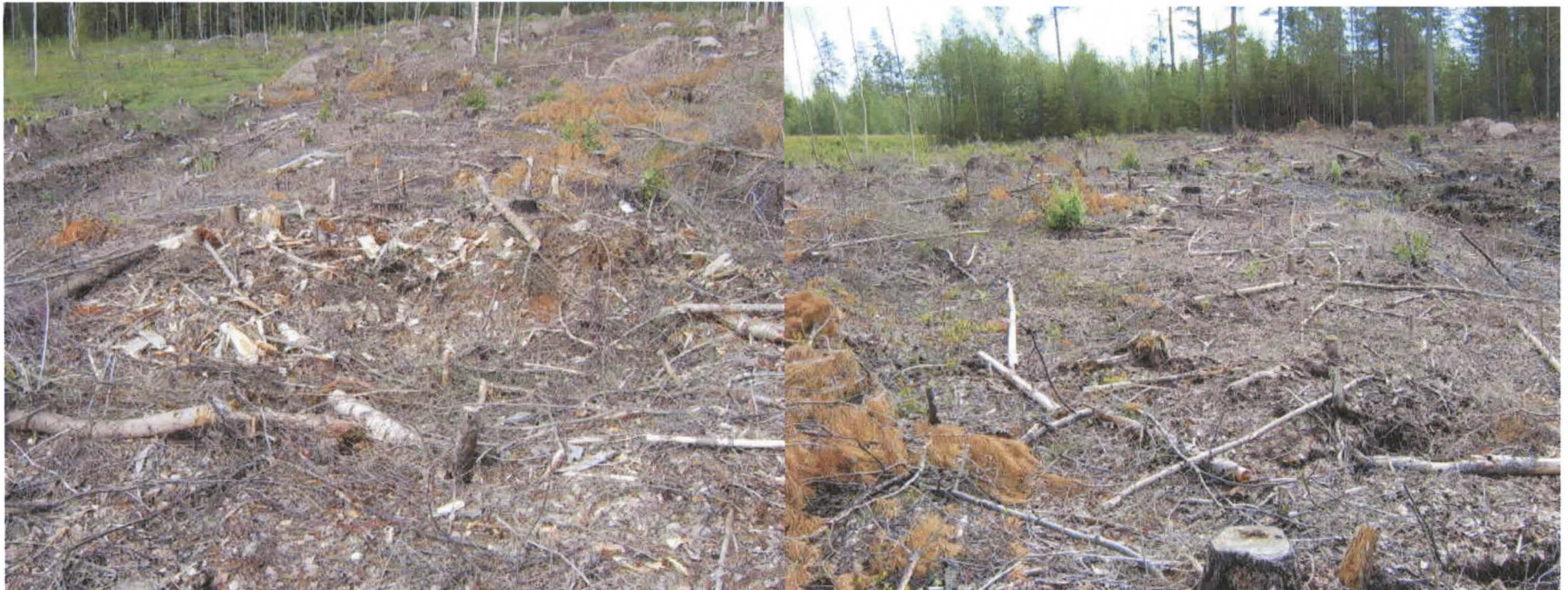
Kuva 2: Miilu suunnasta E (vas.) ja W. KyM/M. Kykyri 2007.