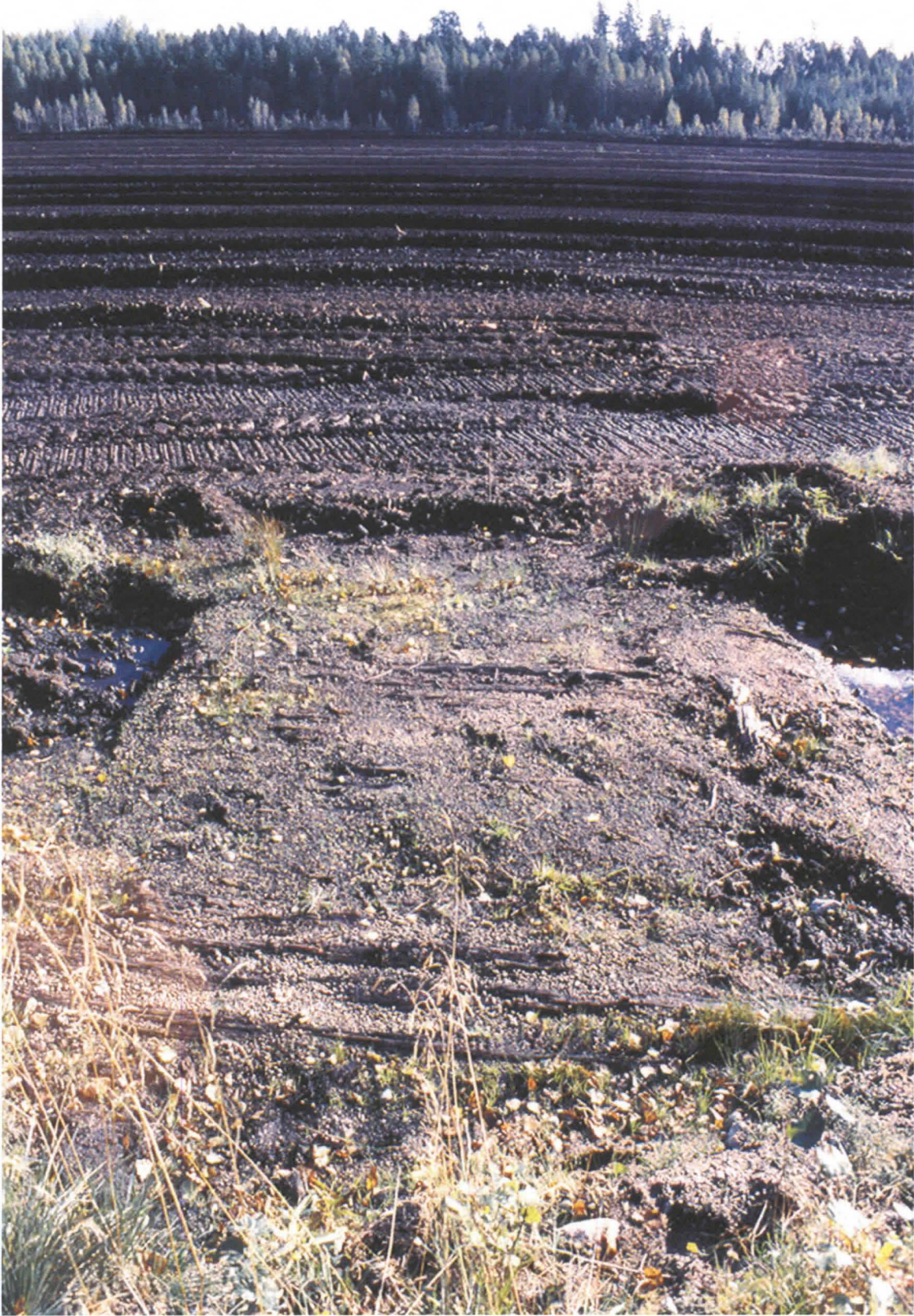
Valkeala, Inkerilä, Lakiasuo. Suosilta lännestä. KyMM 51396:15/M. Kykyri.