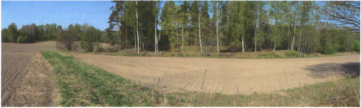
Kuva 2. Ruotsulan redutin valleja idän suunnalta tarkasteltuna.