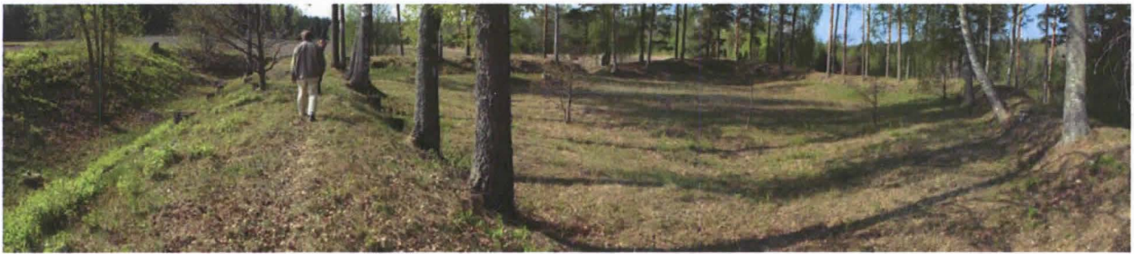
Kuva 4. Ruotsulan redutin valleilta on poistettu yli-ikäistä puustoa.