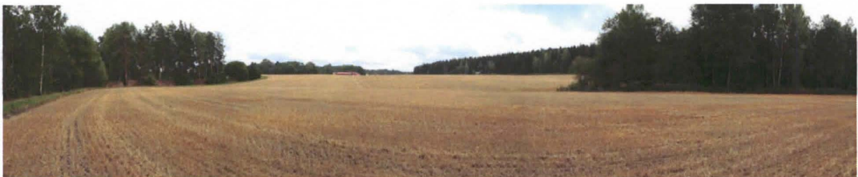
Kuva 1. Yleisnäkymä Ruotsulan redutin alueesta. Redutti on kuvassa vasemmalla ja Kaivomäki taustalla. Peltoaukealla sijaitsi vanha Ruotsulan kylä.