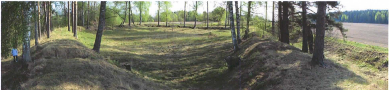
Kuva 3. Ruotsulan redutin valleja lännen suunnalta tarkasteltuna.