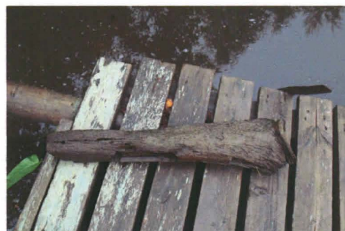
Laiturin päälle nostettuna hyllyn osia, joita oli alueella runsaasti irtonaisina.