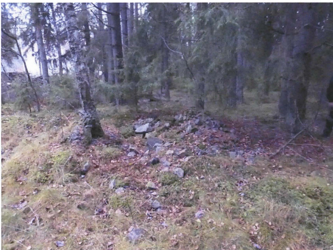
Mahdollinen uunin perusta alueella