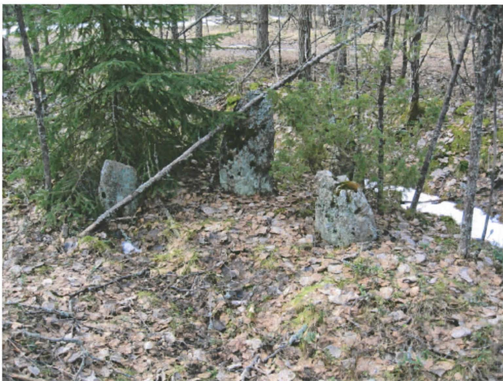
2. Turku, Kärsämäki, Lentoasema. 5-kivinen rajakivi Nunnanpolun I. Pyhän Henrikin tien varressa. Kuvattu pohjoisesta. Nunnanpolku taustalla. DT2009:35:007