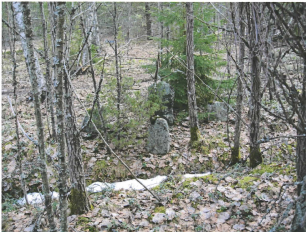
1. Turku, Kärsämäki, Lentoasema. 5-kivinen rajakivi Nunnanpolun I. Pyhän Henrikin tien varressa. Kuvattu lännestä kys. tieltä. DT2009:35:006